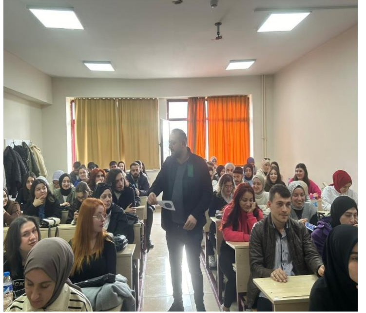
Atatürk Üniversitesi İletişim Fakültesi Halkla İlişkiler ve Tanıtım bölümü öğrencilerine yapılan seminer