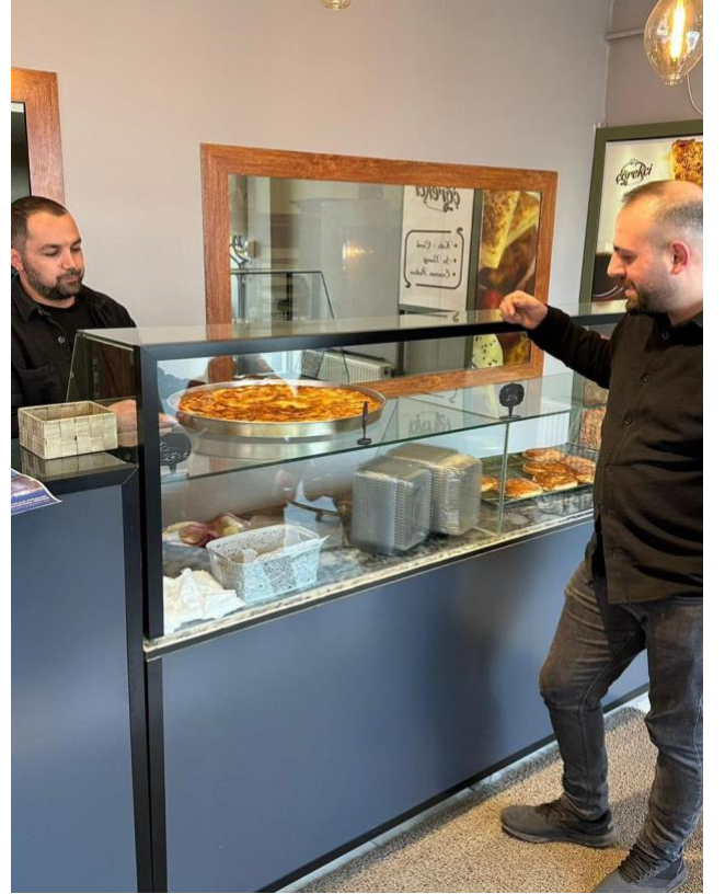
Esnaf Ziyareti ve Bilinçlendirme