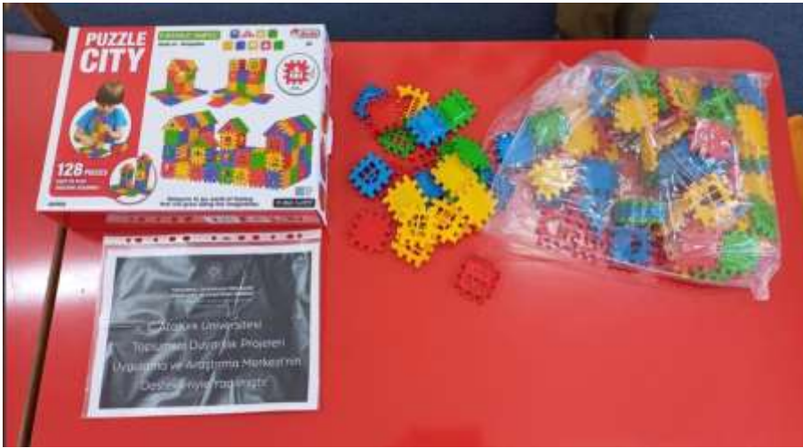
Projenin uygulandıđı ortam