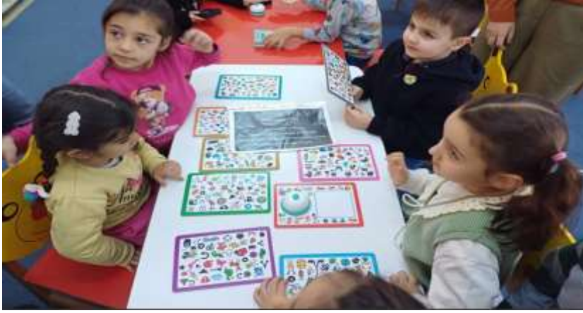
Projenin uygulandıđı ortam