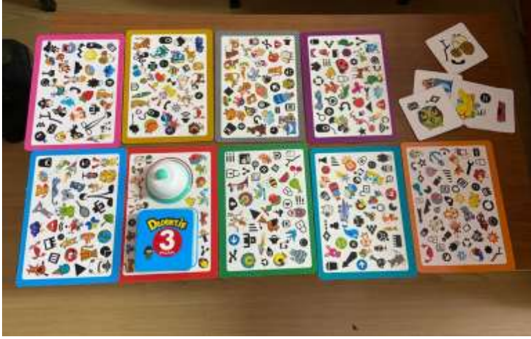
Projenin uygulandıđı ortam