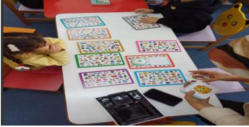
Projenin uygulandıđı ortam