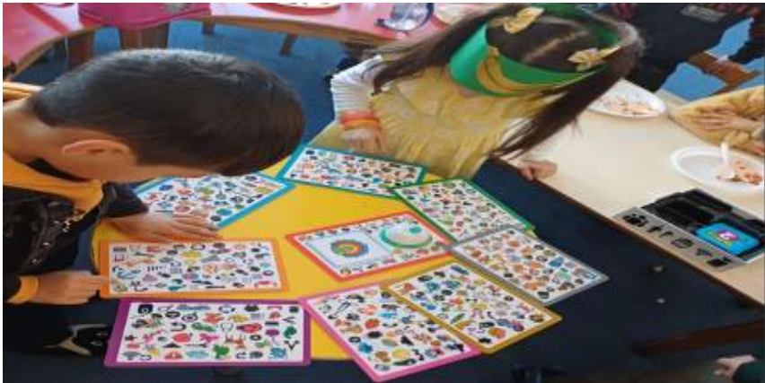
Projenin uygulandıđı ortam