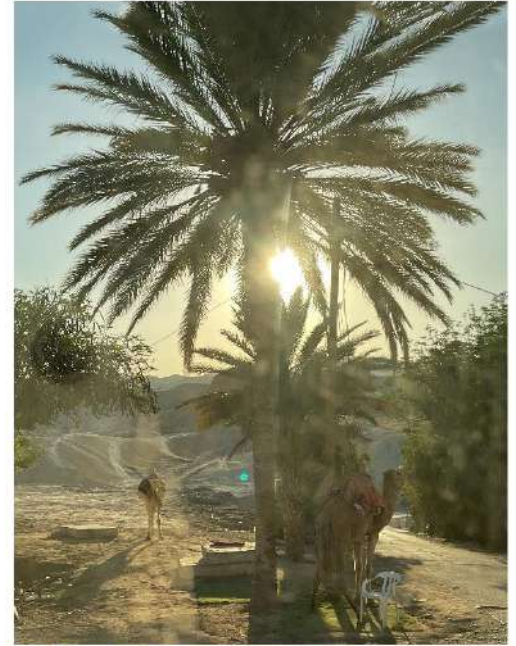
BATI ŞERİA BÖLGESİNDE DİNLENDİRİLEN DEVELER 3 MAYIS 2023, SAAT:10.15