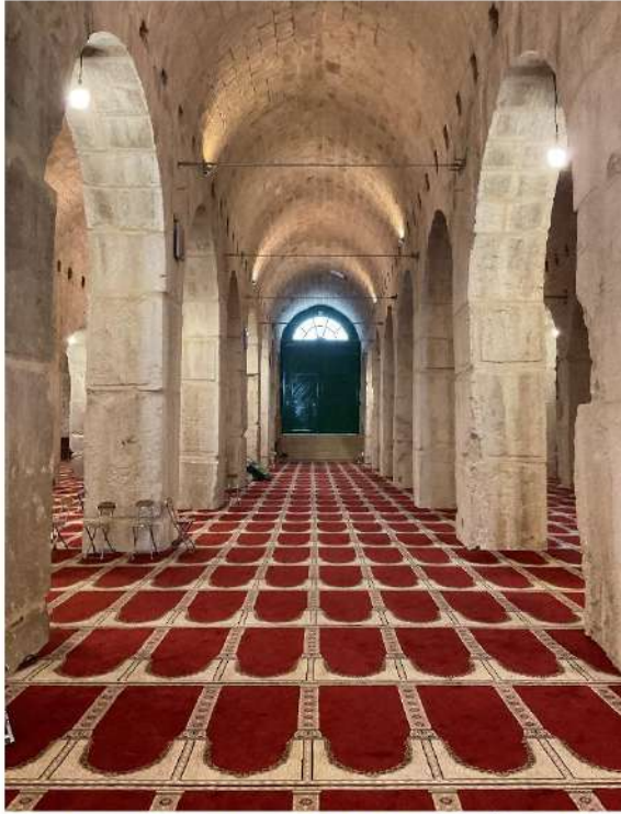
MERVAN MESCİDİ (MESCİD-İ AKSA OLARAK BİLİNE KUTBETÜ'S SAHRA'YI DA İÇİNE ALAN BÖLGEDE 144 DÖNÜMLÜK YER ALTI MESCİDİ) 5 MAYIS 2023, SAAT:15.27