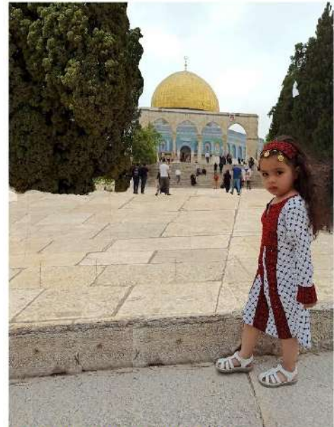
AKSA'NIN KÜÇÜK MURABİTİ 5 MAYIS 2023, SAAT:10.42