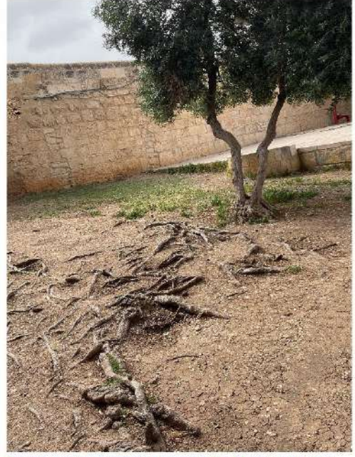
RAHMET MESCİDİ BAĞÇESİNDE BULUNAN ZEYTİN AĞACI VE KÖKLERİ 6 MAYIS 2023, SAAT:15.07