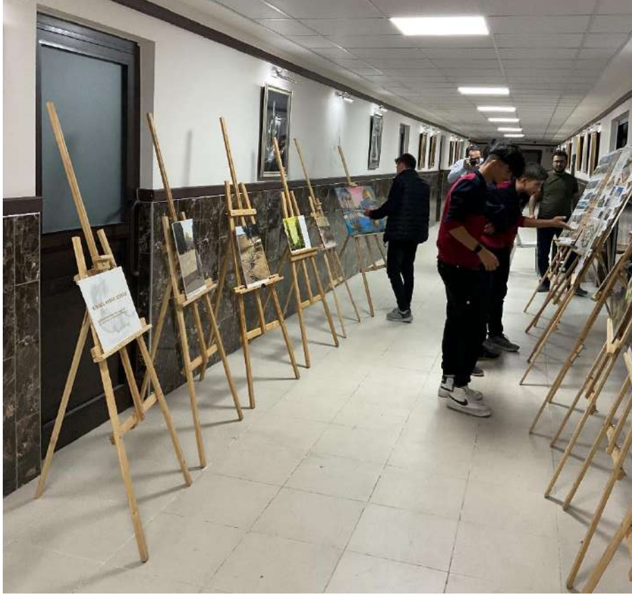
Görsel 1. Öğrenciler ve davetliler sergiyi incelerken (İhl konferans salonu fuaye)