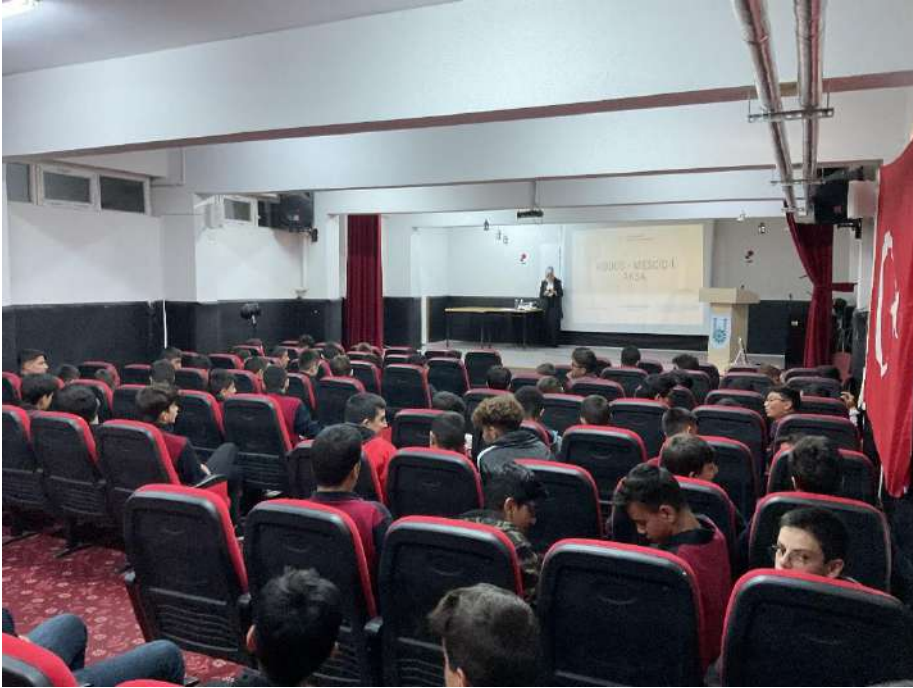
Görsel 2. Projenin uygulandığı ortam (Erzurum Anadolu İhl Proje Okulu Konferans Salonu – öğrenciler ve davetliler ile birlikte)