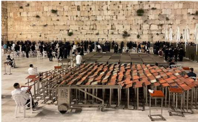
BURAK DUVARI (YAHUDİLER İÇİN AĞLAMA DUVARI) - YAHUDİ ERKEKLER DUA EDERKEN 4 MAYIS 2023, SAAT:10.50

Atatürk Üniversitesi Etkinlik Dönerlik Projesi Uygulanması ile Kurulan İnkılapçıların Desteklenişine Katılımı.