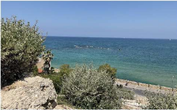
YAPA (İBRANİCE YAFFO) LİMAN KENTİ OSMANLI KALINTILARI (DENİZİN İÇİ) 3 MAYIS 2023, SAAT:11.30