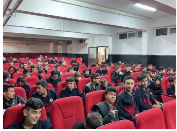
Görsel 3. Projenin uygulandığı ortamdaki sunum öncesi görüntüler