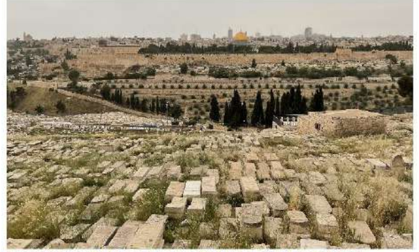
YAHUDİ MEZARLIKLARINDAN KUTBETÜ'S SAHRA (SARI KUBBELİ YAPI) 5 MAYIS 2023, SAAT:17.57