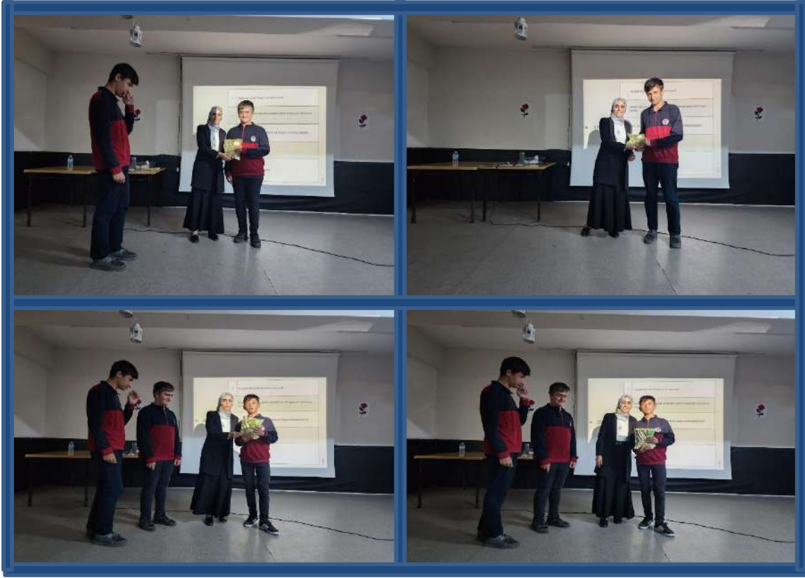
Görsel 6. Sunum sonunda sorulan sorulara yanıt veren öğrencilere hediye takdimi