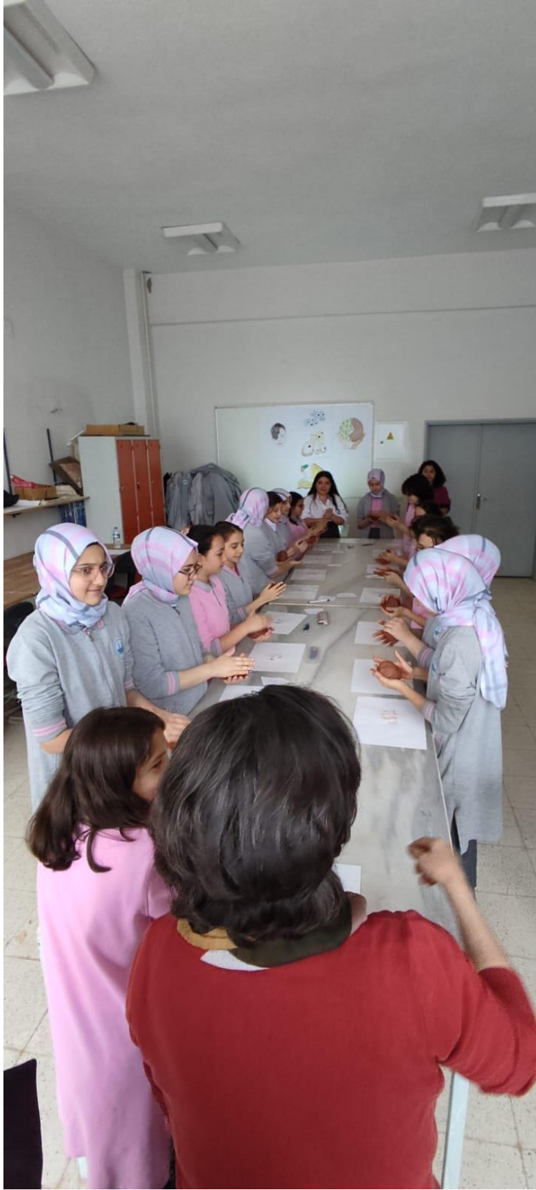
Çini Desenlerinin Geçirileceği Kil Toplarının Hazırlanması