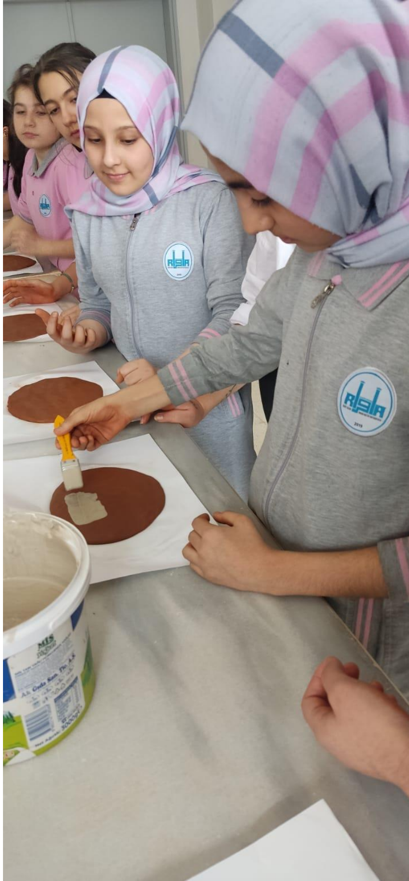
Kil Plakalar Üzerine Farklı Kilden Astarın Uygulanması.