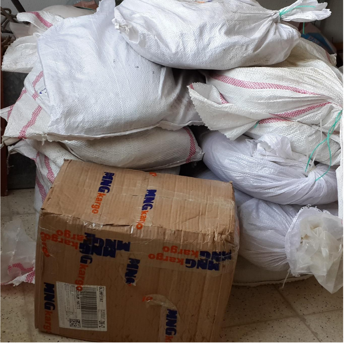
Proje materyallerinin teslim alınması