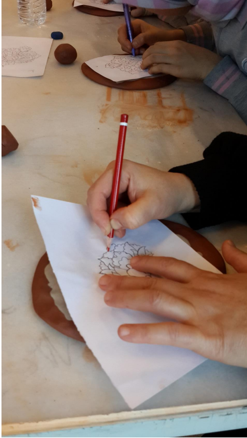
Işıkli Masada Hazırlanan Lala Paşa Camii Çini Desenlerinin Astarlı Kil Plaka Üzerine Geçirilmesi.