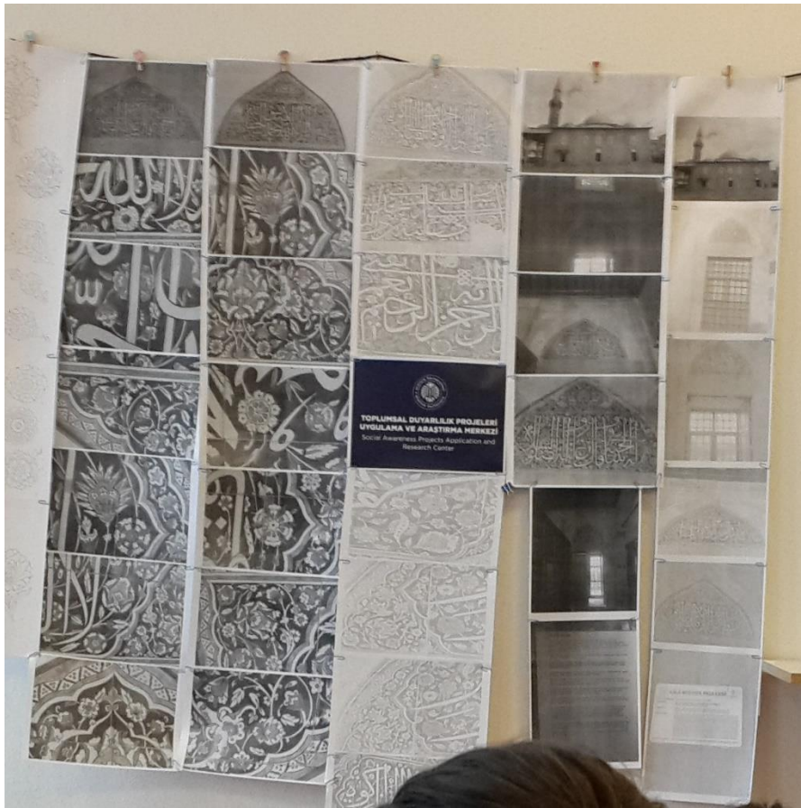
Güzel Sanatlar Fakültesi, Yıldırım Denizli Atölyesi Panosu