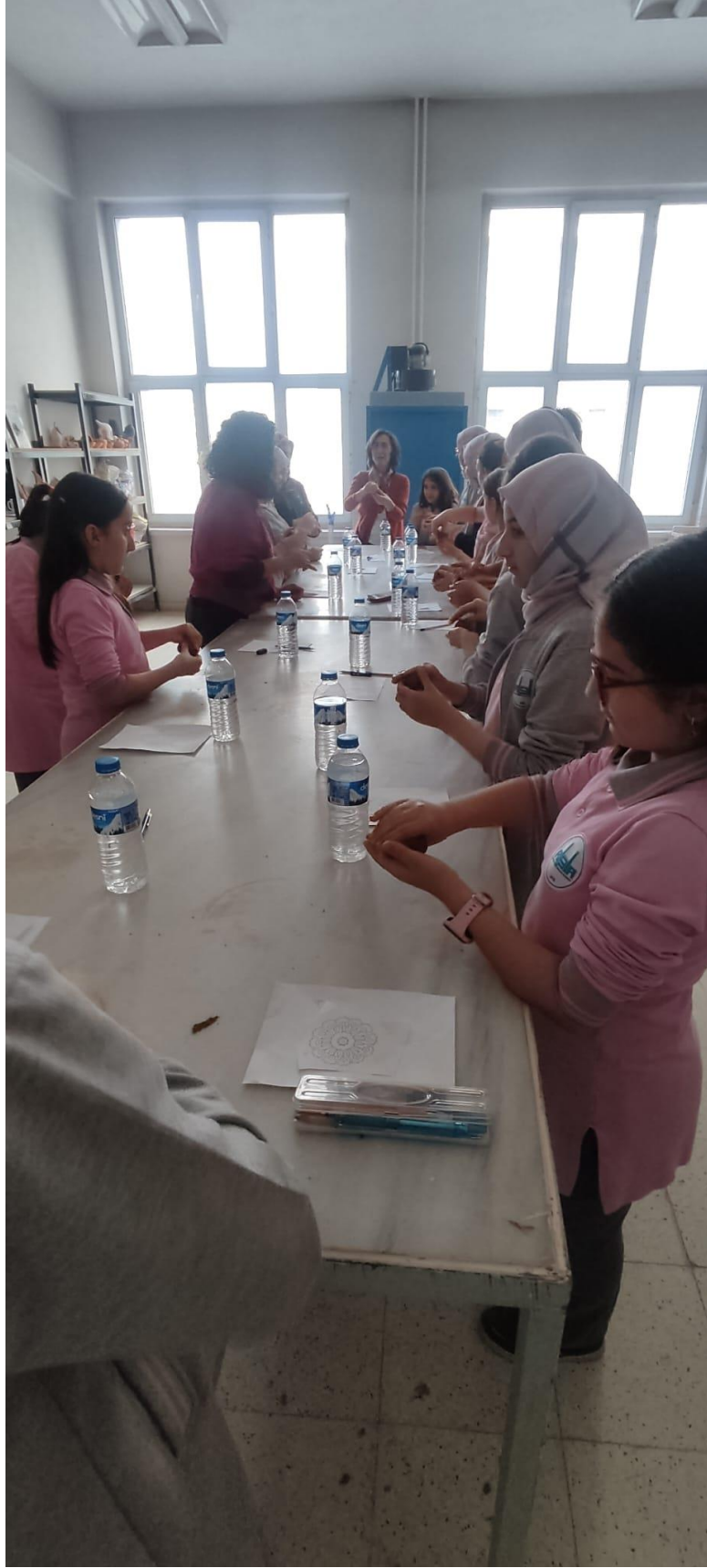
Projenin uygulandığı ortam ve öğrencilerin kili tanıma aşamaları.