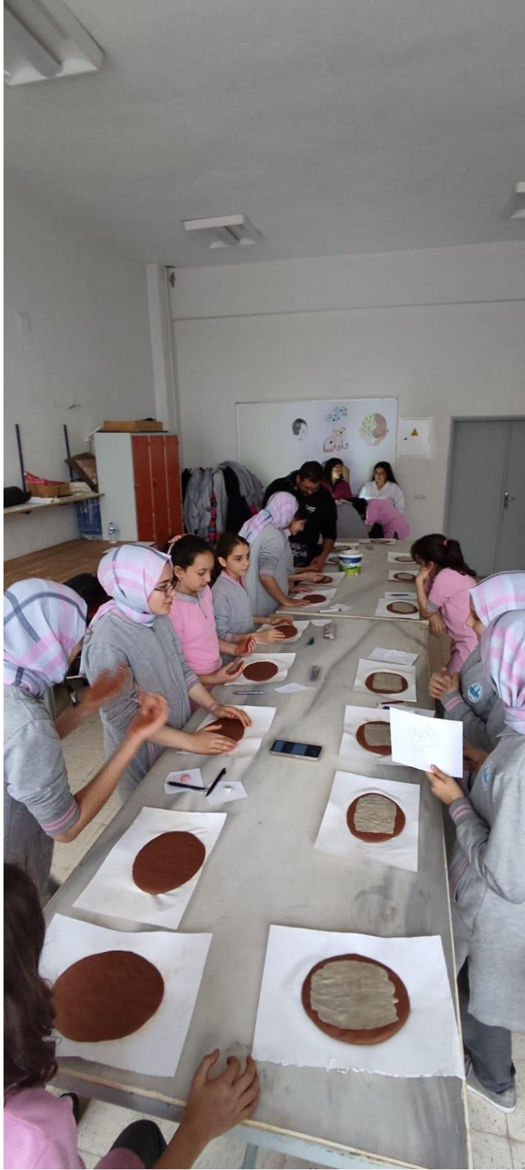
Kil Plakalar Üzerine Farklı Kilden Astarın Uygulanması.