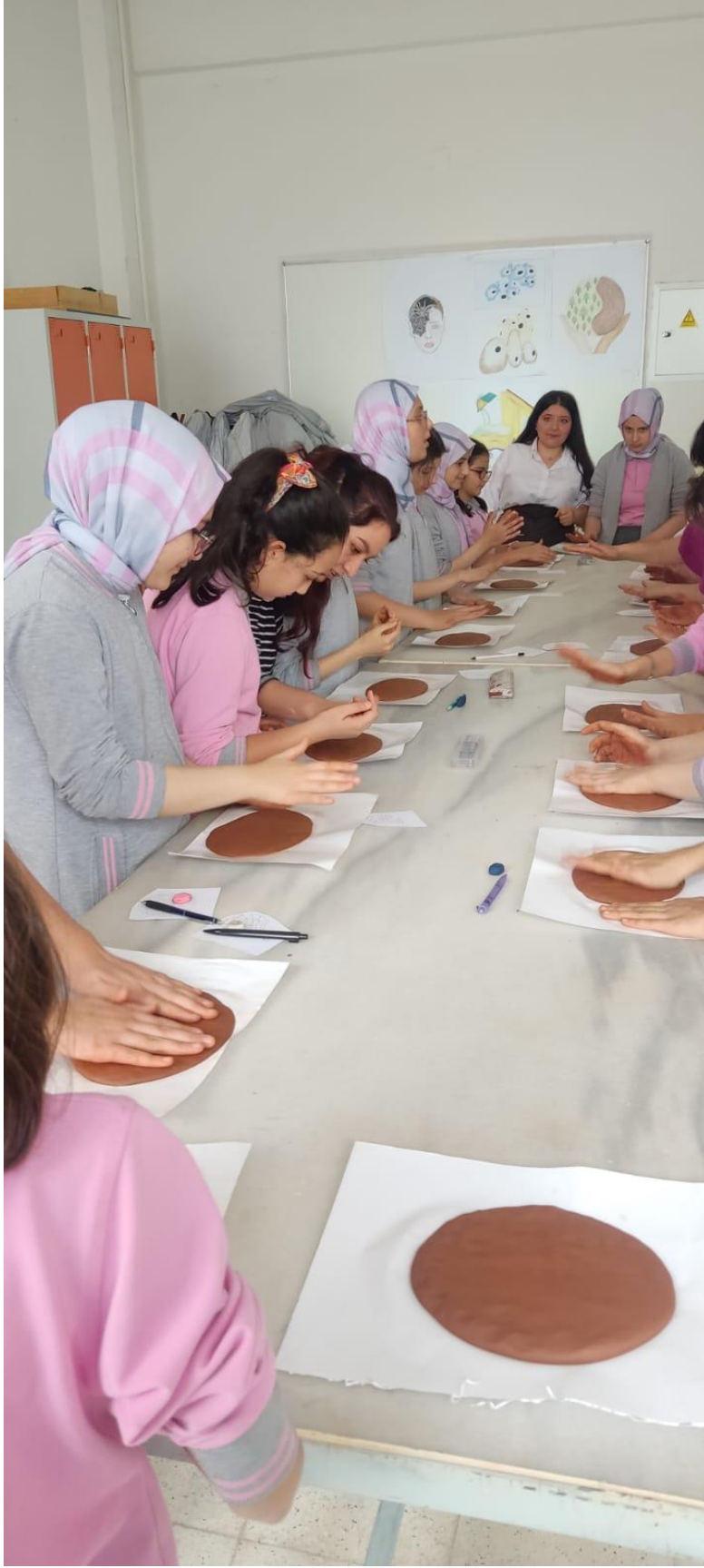
Kil Toplarının Plakaya Dönüştürülmesi.