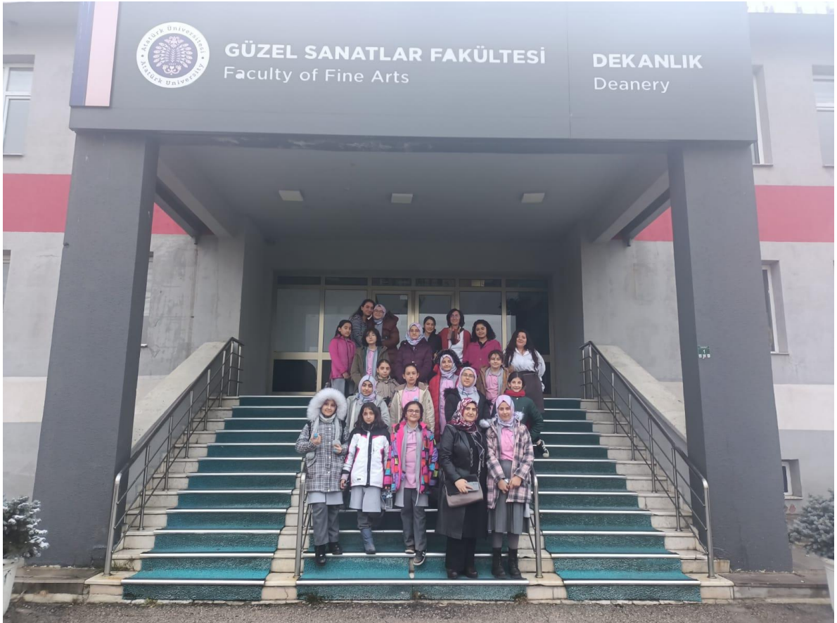
Raif Azak İmam Hatip Ortaokulu öğrencileri ile Toplumsal Duyarlılık Projeleri Anısı.