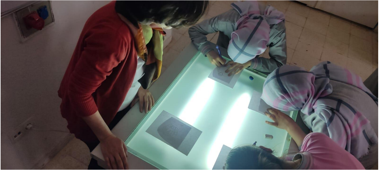
Lala Paşa Camii Çinilerinin Işıklı Masada Kopyalarının Çıkarılması.