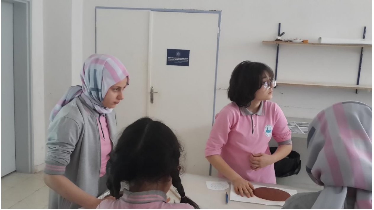
Projenin uygulandığı Atatürk Üniversitesi, Güzel Sanatlar Fakültesi, Yıldırım Denizli Atölyesi.