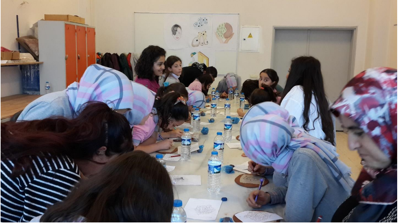
Işıkli Masada Hazırlanan Lala Paşa Camii Çini Desenlerinin Astarlı Kil Plaka Üzerine Geçirilmesi.