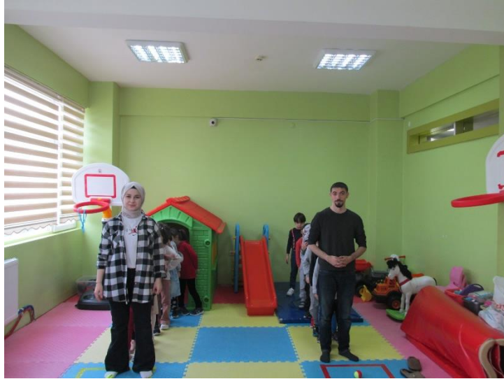
ÇOCUKLARA OYUNUN ANLATILMASI