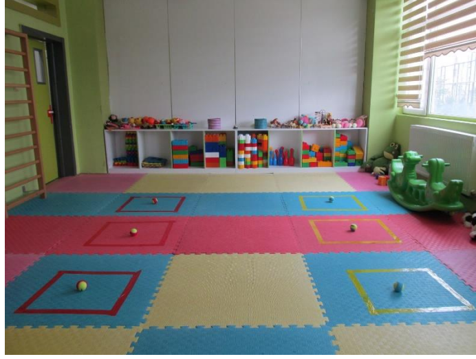
TOP TAŞIMA OYUN PARKURUNUN HAZIRLANMASI