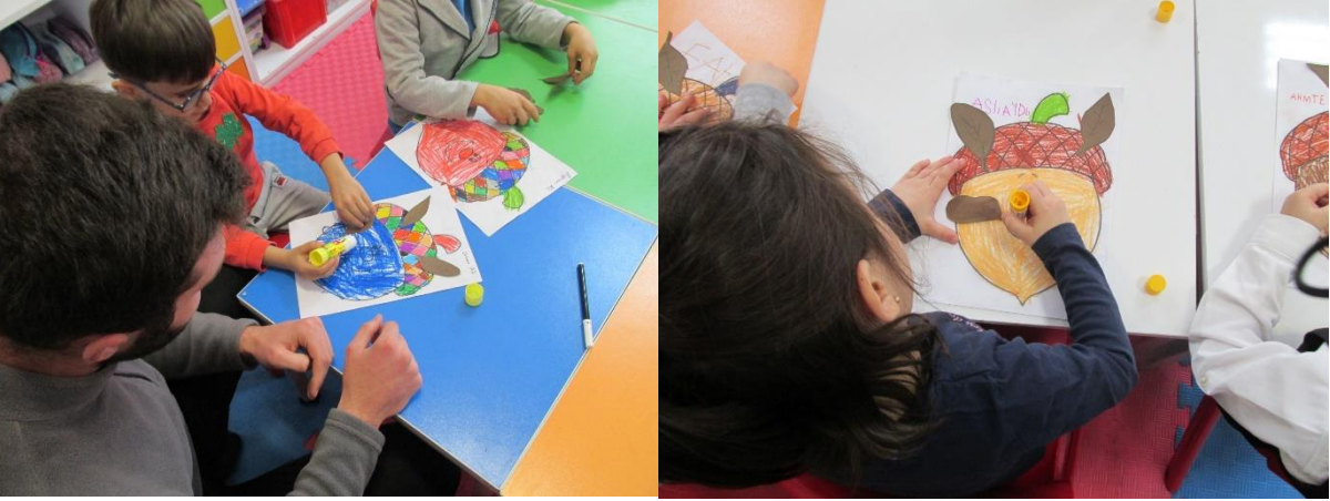
MEŞE PALAMUTLARININ BOYANMASI