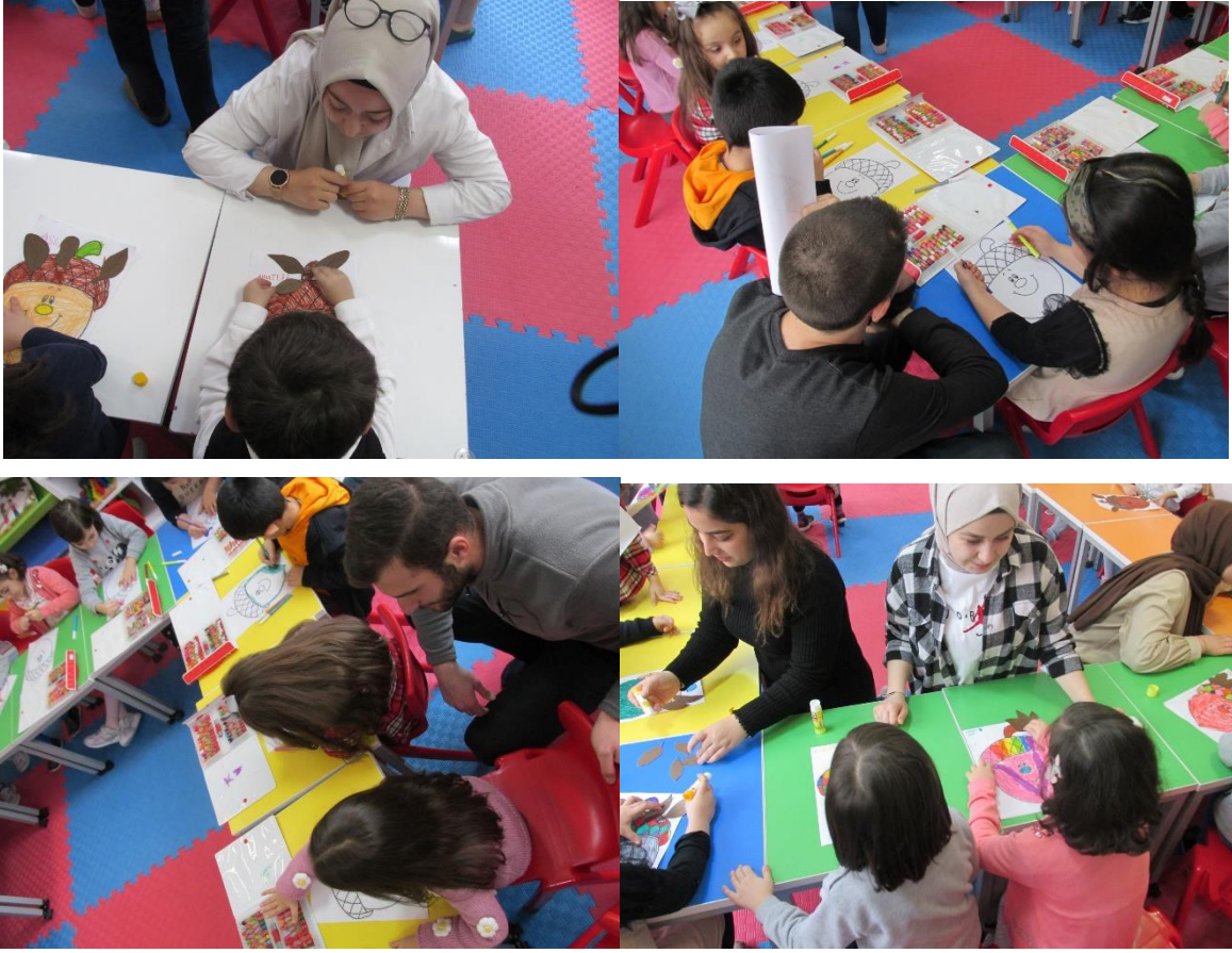
MEŞE PALAMUDU ETKİNLİĞİNİN UYGULANMASI