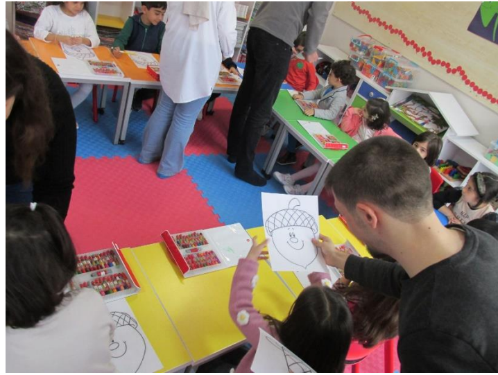
PROJE MATERYALLERİNİN DAĞITILMASI