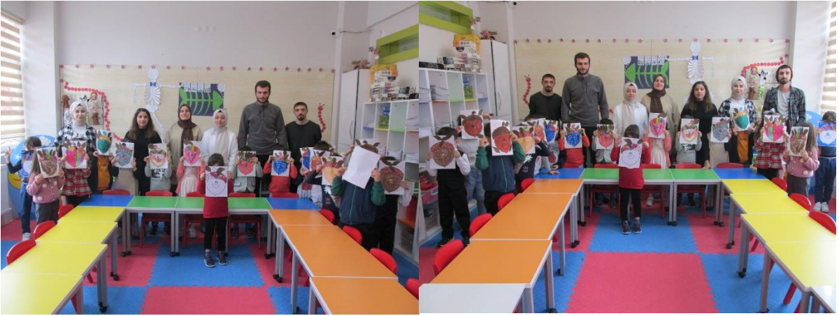
MEŞE PALAMUDU ETKİNLİĞİNİN SONA ERMESİ