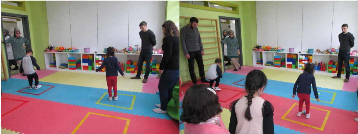
TOP TAŞIMA OYUNUN OYNANMASI