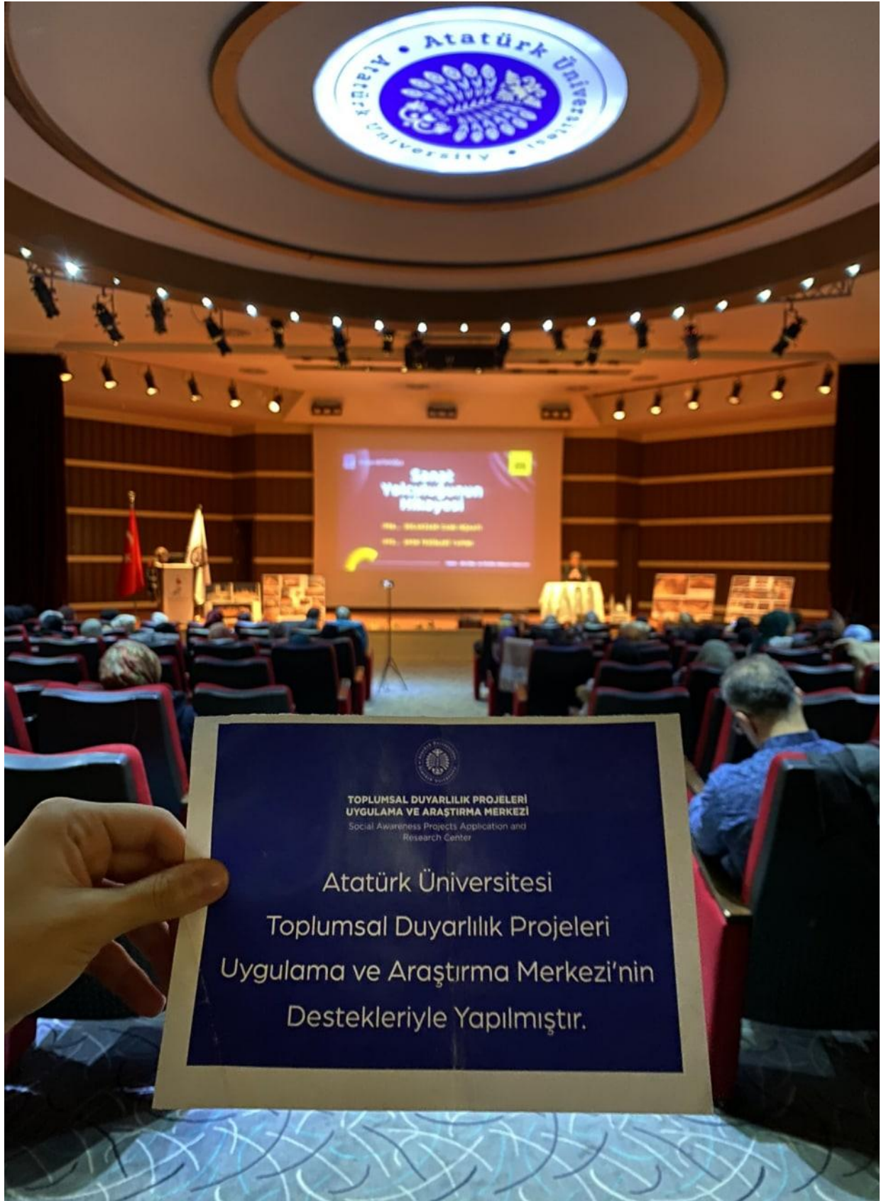
Projenin gerçekleştirildiği Nenehatun Kültür Merkezi