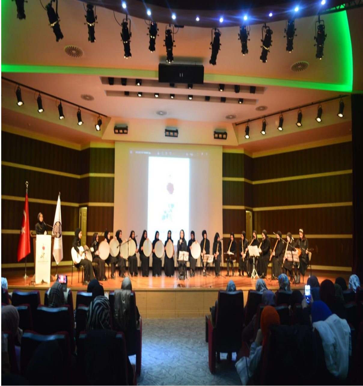
Proje kapsamında “mûsikî dinletisi “ ile programın bitirilmesi