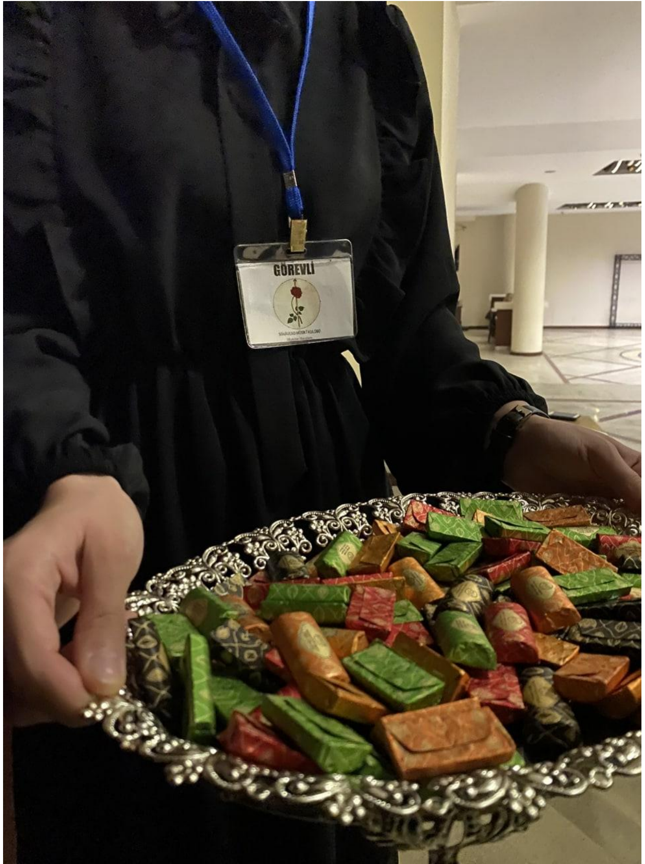
Proje kapsamında ikolata ikramının verilmesi