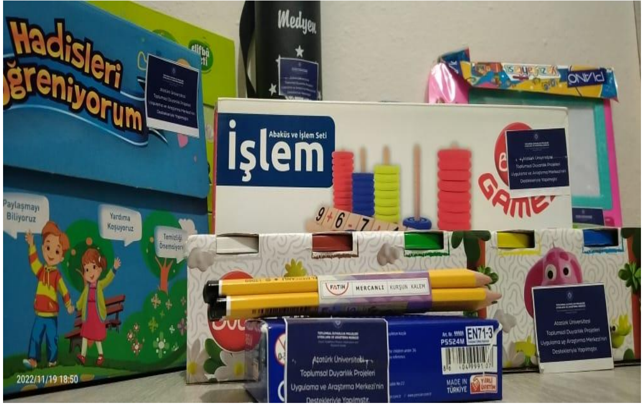
Proje eğitim materyalleri alınması