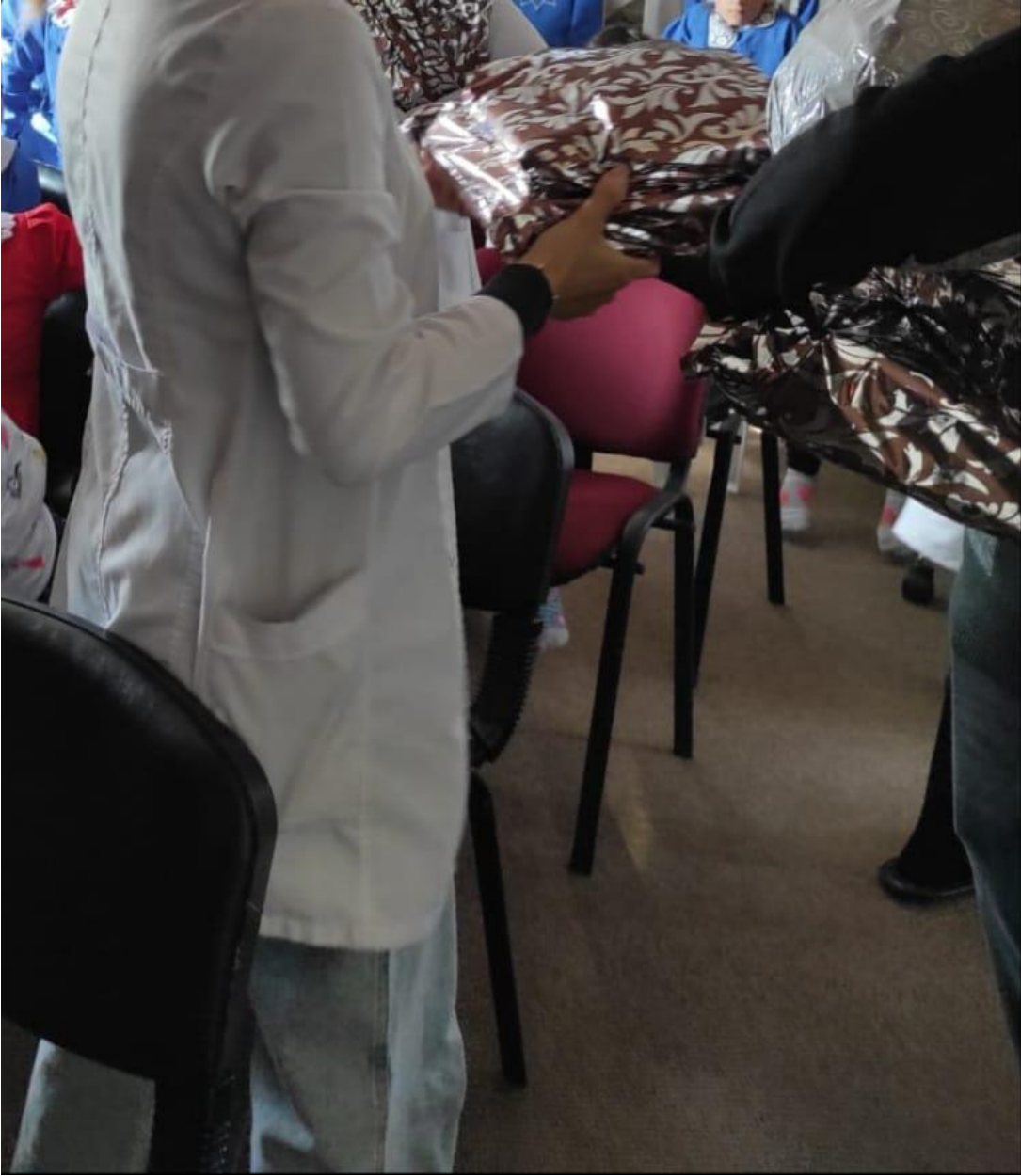
Proje kapsamında temin edilen eğitici materyallerin verilmesi