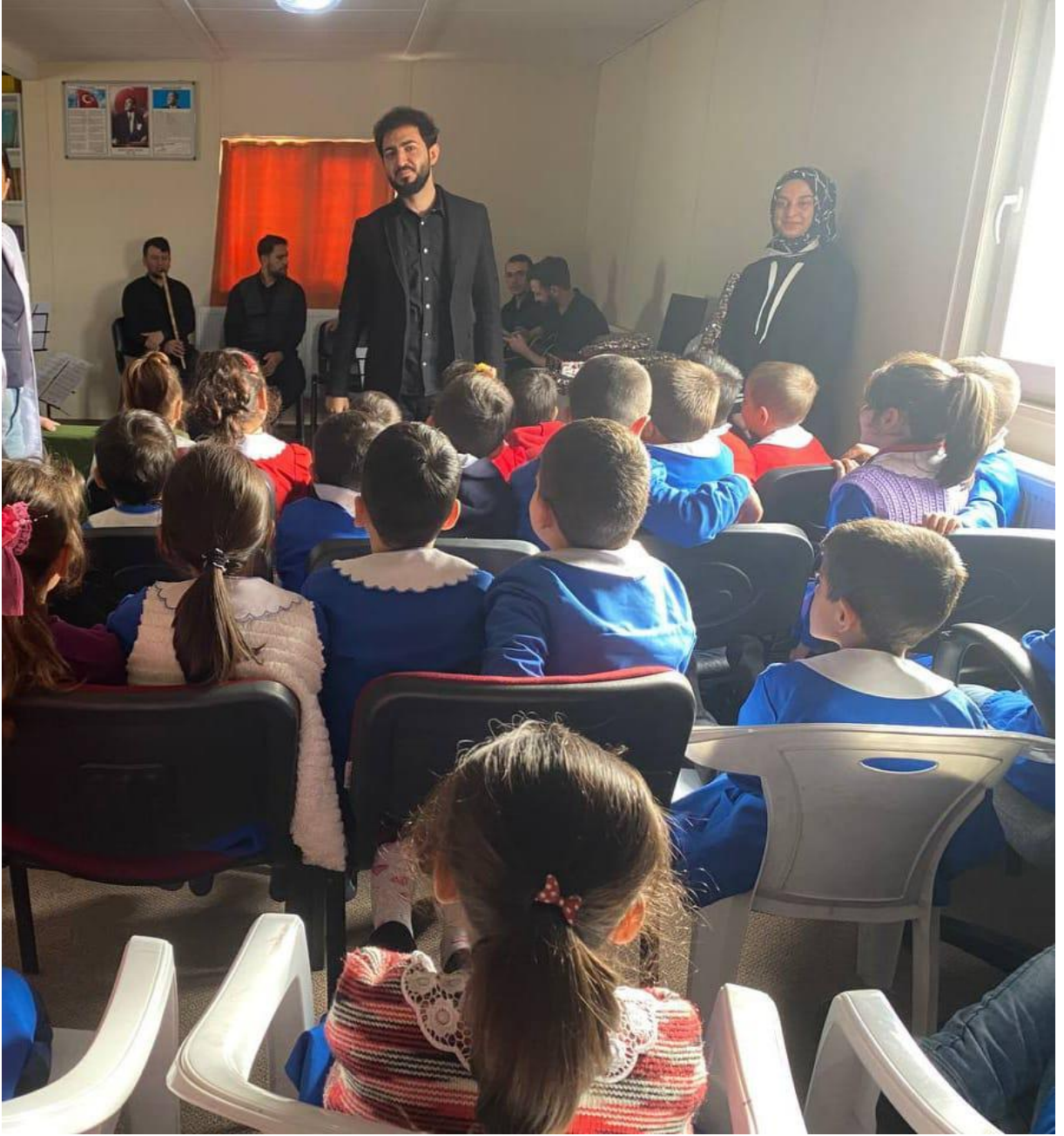
Proje kapsamında Mevlâna ile ilgili seviyeye uygun dinî sohbet yapılması