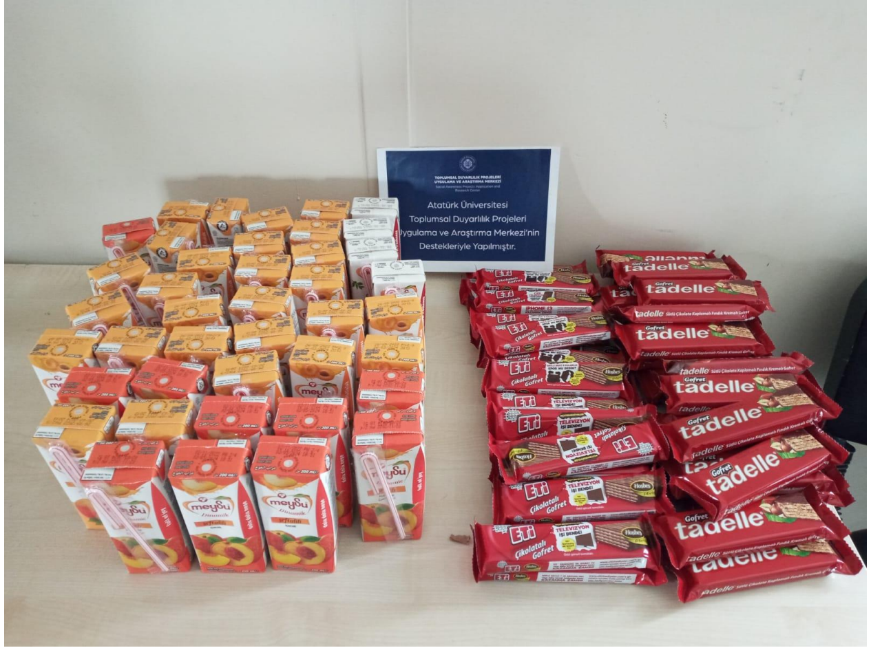
Proje kapsamında ikolata ve meyve suyu ikramları