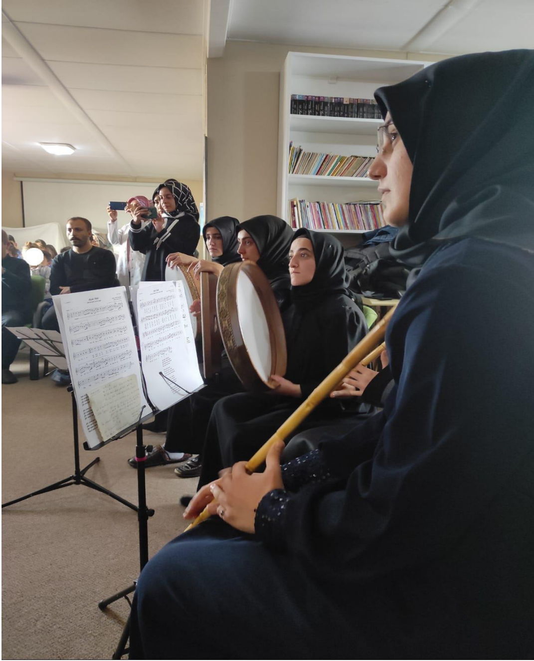
Proje kapsamında dinî mûsikî dinletisinin yapılması