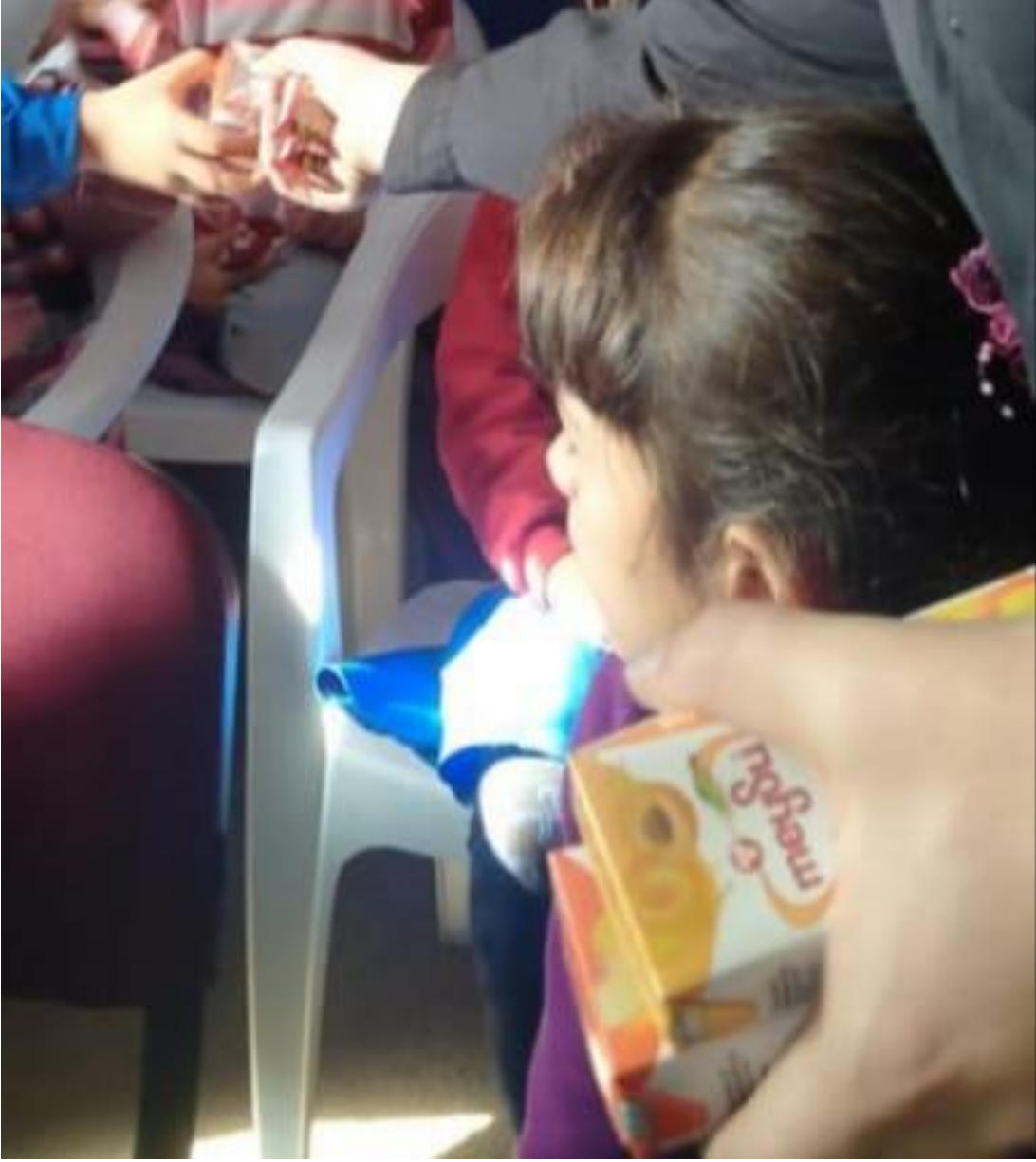
Proje kapsamında ikolata ve meyve suyu ikramlarının verilmesi