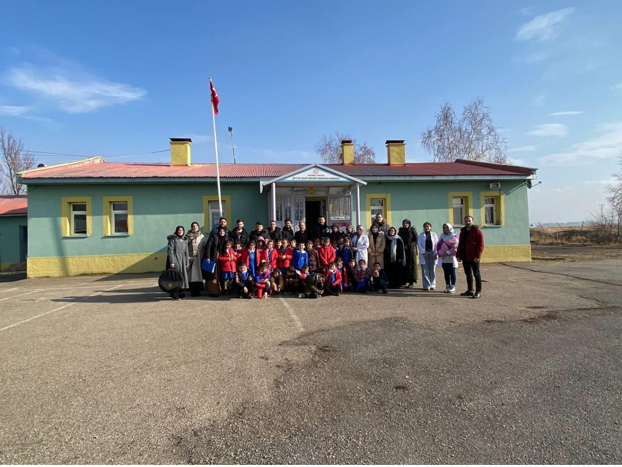
Öğretmen ve öğrencilerin motive edilip projenin sonlandırılması