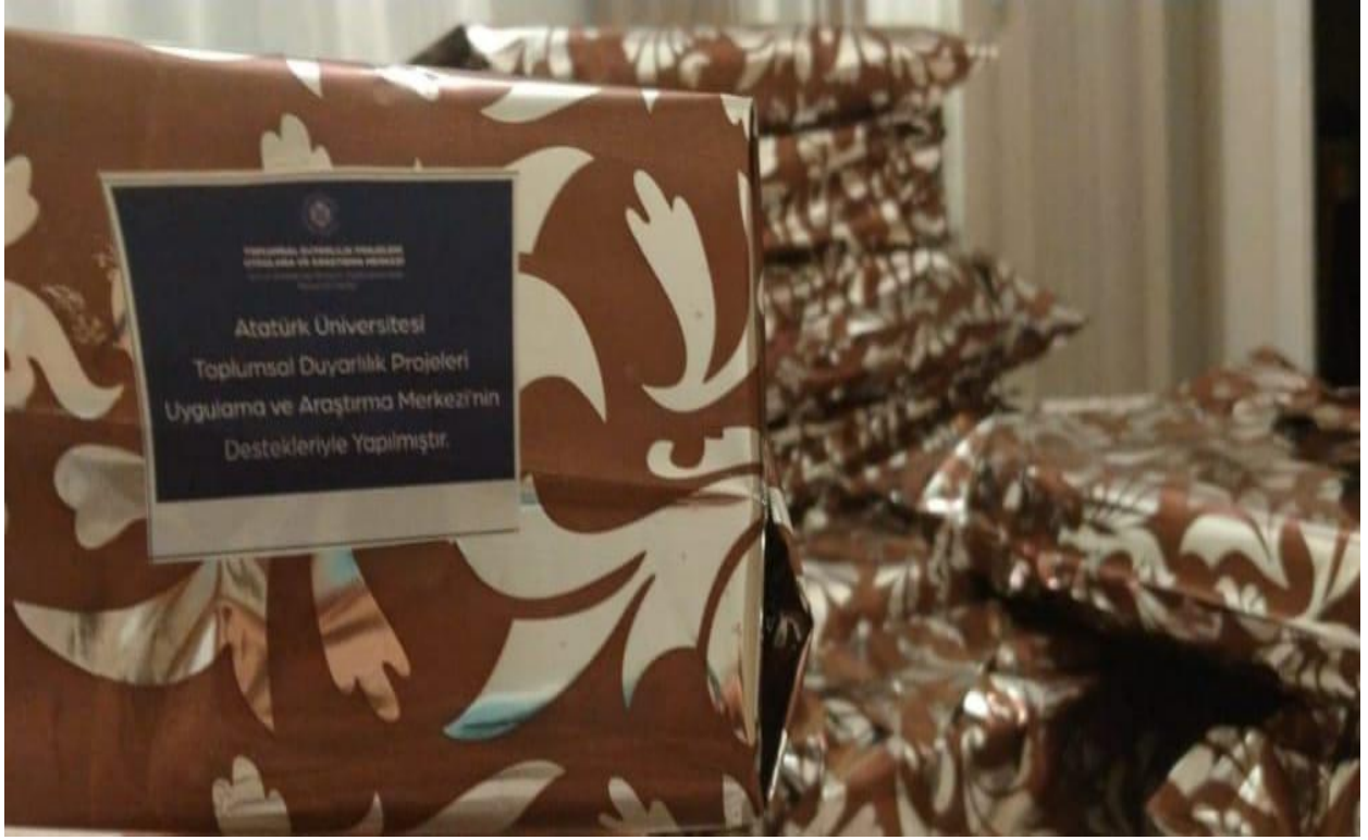
Proje kapsamında eğitimci materyallerin alınması