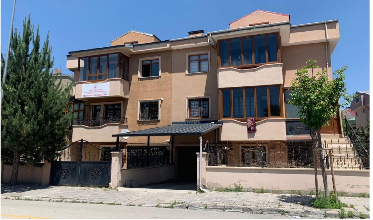
Projenin uygulandığı ve Etkinliğin gerçekleştirildiği yer: Erzurum Darülaceze Evi -Dadaşkent