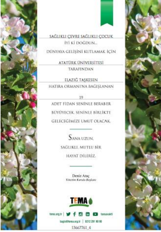
Şekil 1. Proje Etkinliği Kapsamında Dağıtılan Fidan Bağışı Sertifika