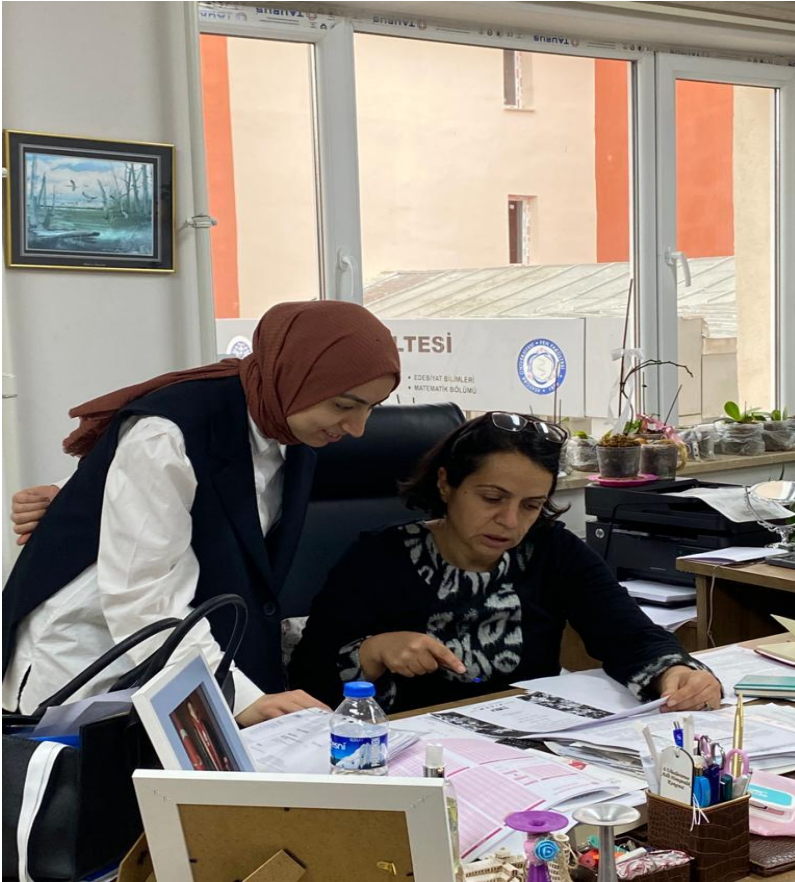
Şekil 2. Projenin Hazırlanış Sürecine Ait Görsel