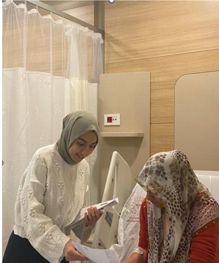
Şekil 3: Proje Kapsamında Alman Fidan Sertifikalarının Annelere Dağıtılması