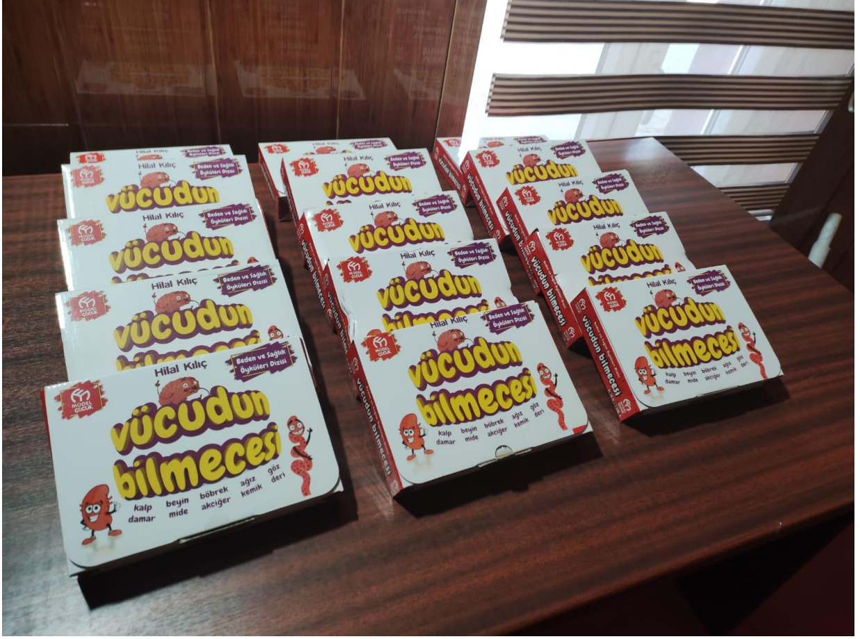
Projede materyallerin teslim alınması