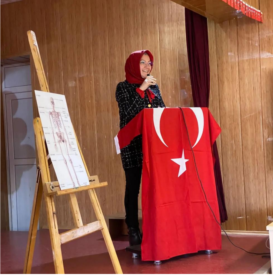
Açılış konuşmasından bir kesit