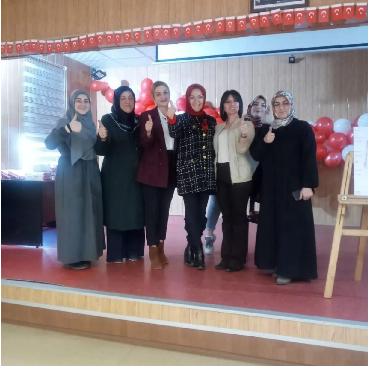
Proje tamamlandıktan sonra