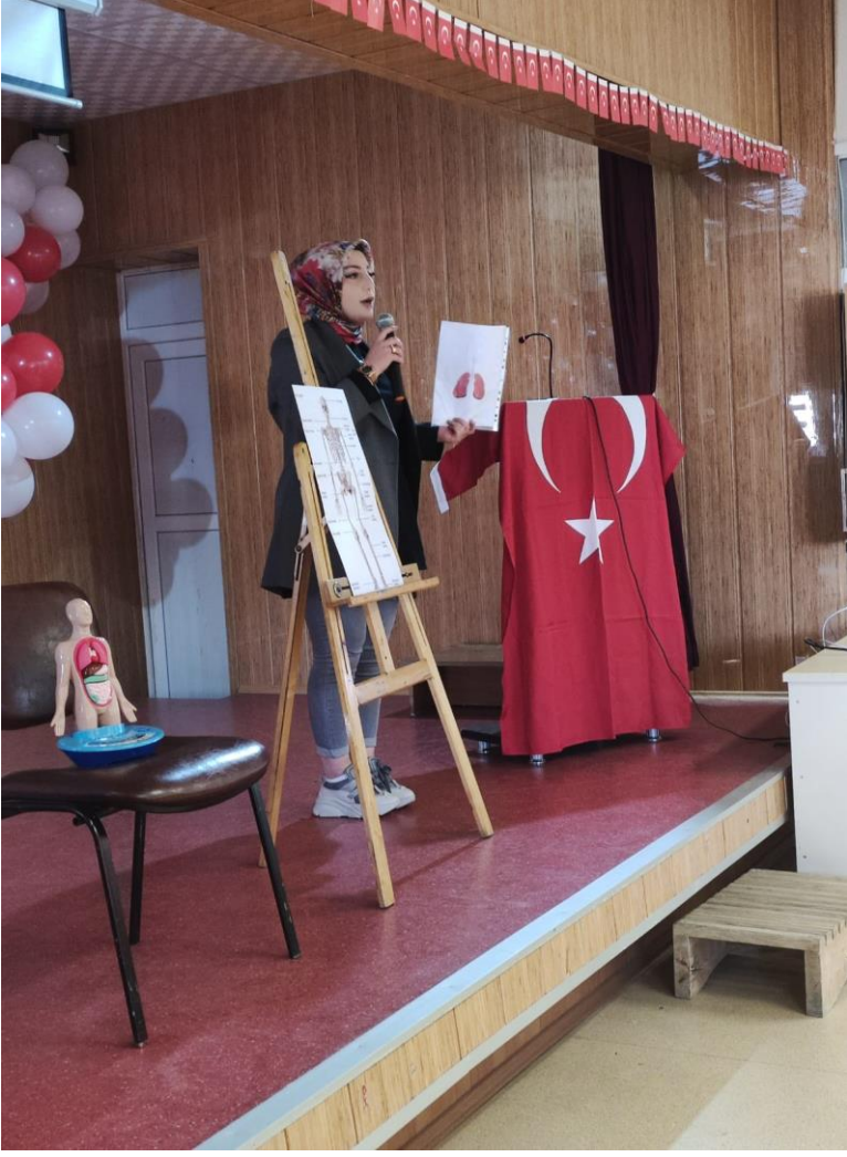
Organ anlatımı yaparken bir arařtırmacı