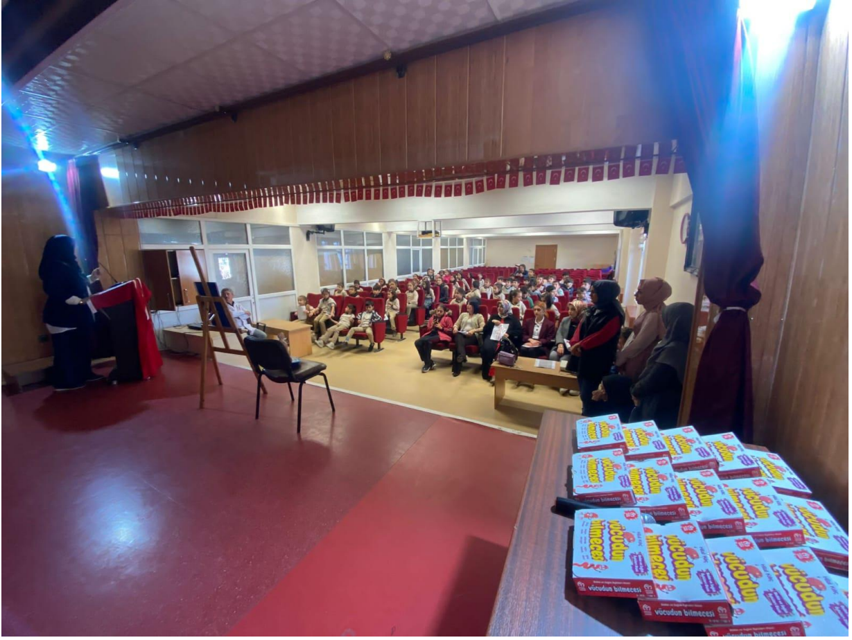
Etkinlik alanından bir kesit