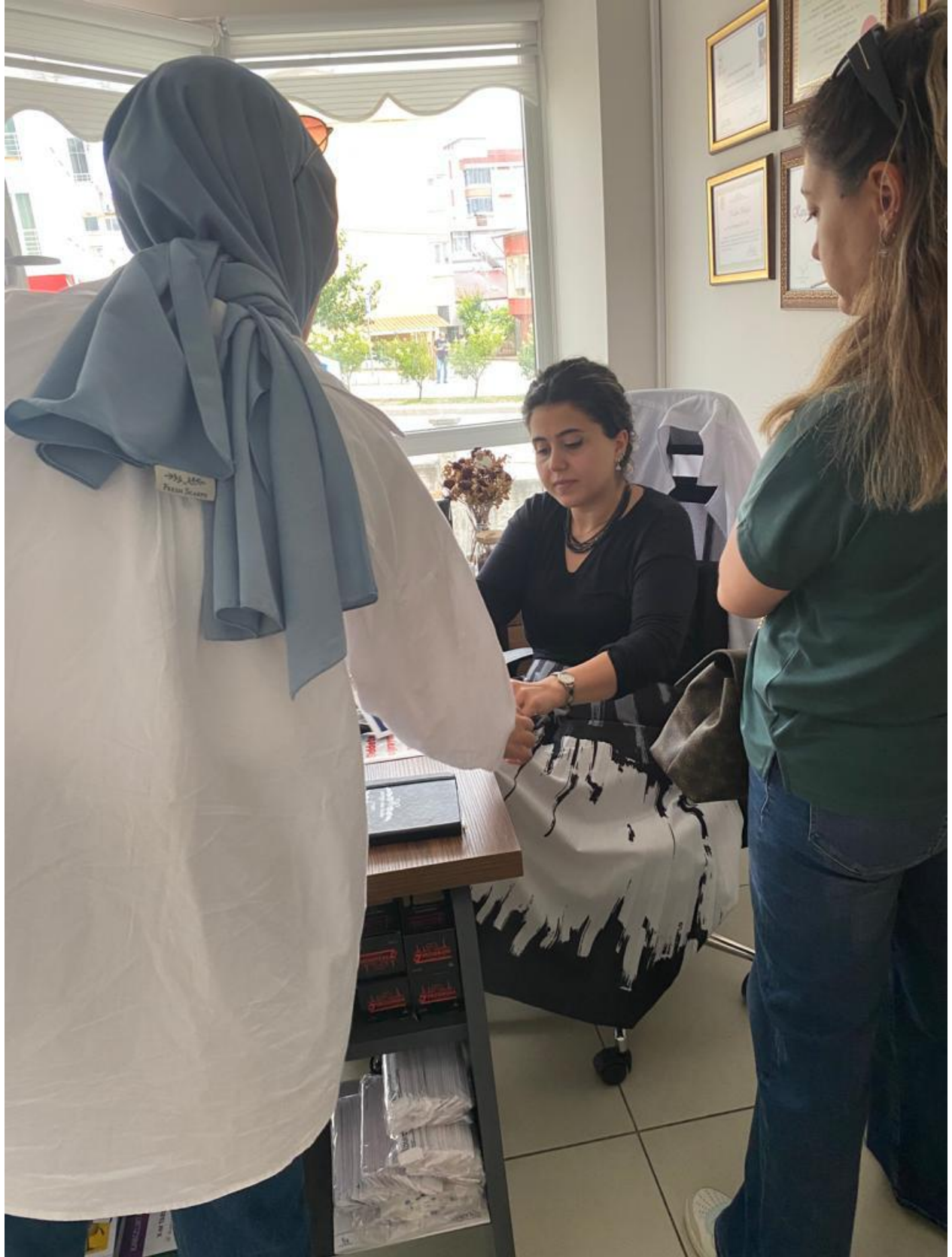
Proje hakkında bilgilendirmelerin yapılması ve sorulan soruların cevaplandırılması