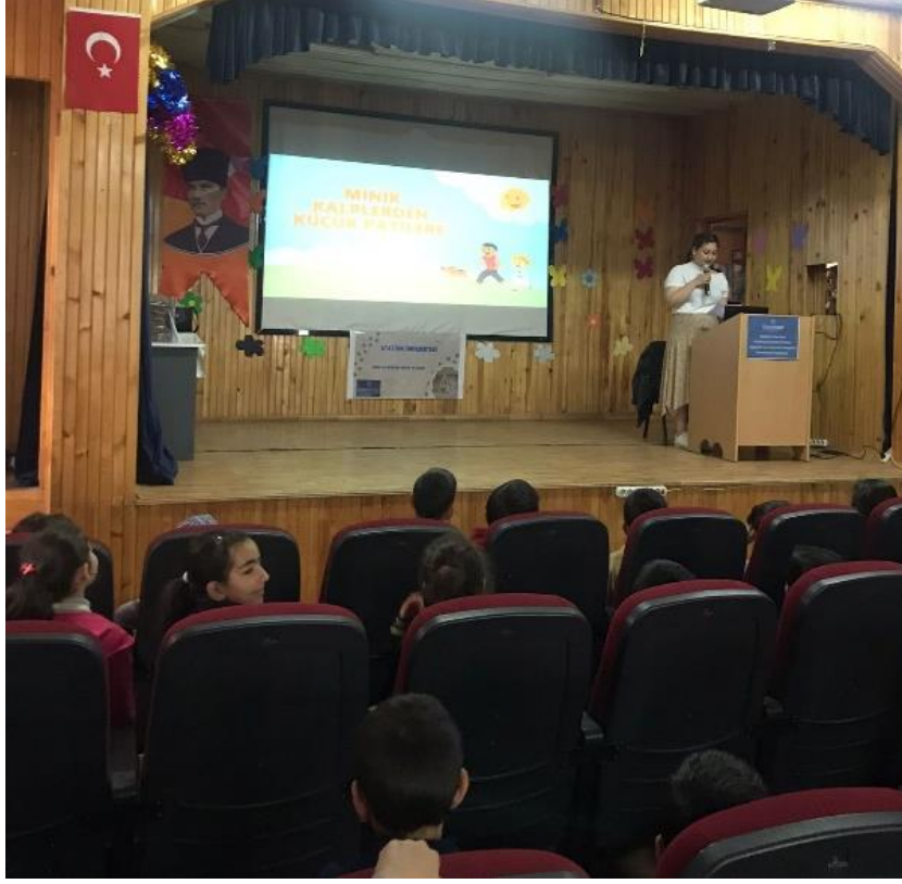
Giriş konuşmasının yapılması