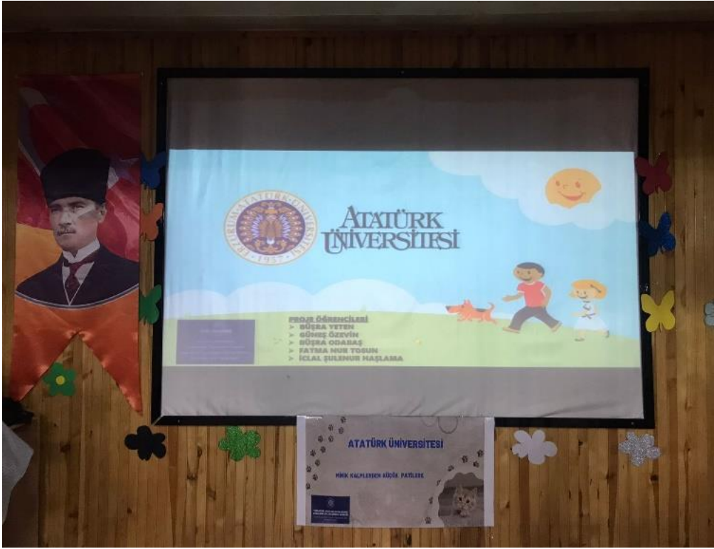
Hayvan konulu sunum