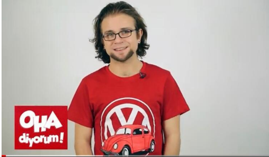
Hayvanlar Aleminden 24 İlginç Bilgi