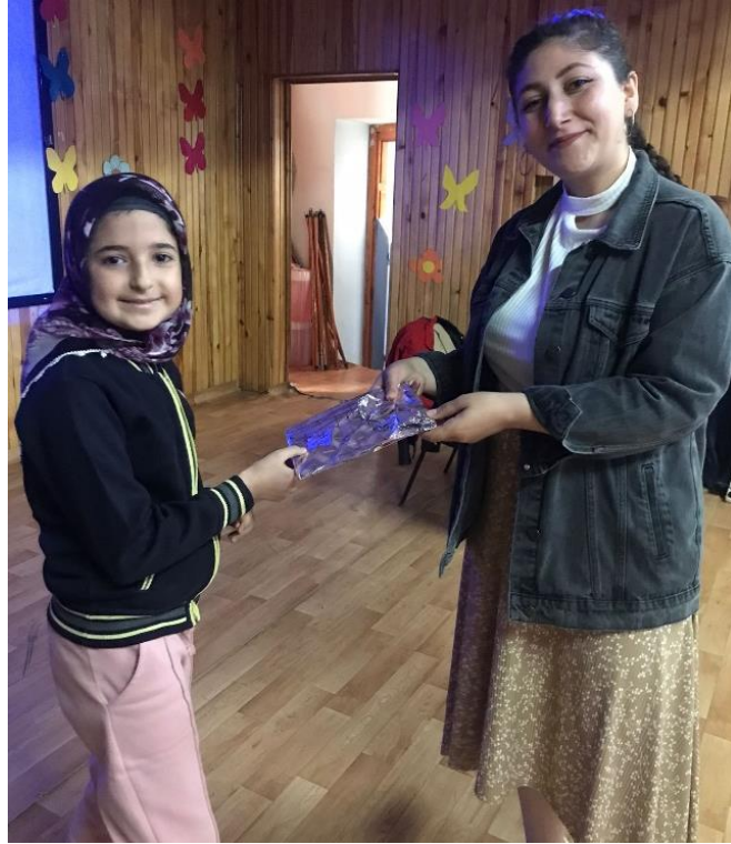
Hediyelerin öğrencilere dağıtılması