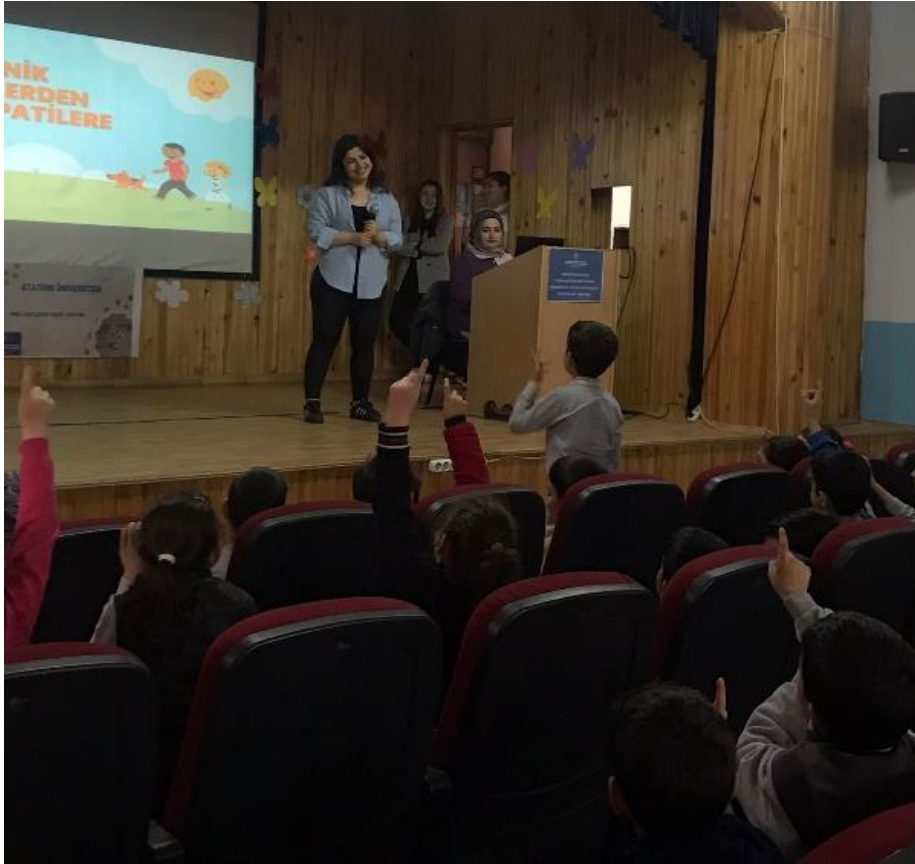
Slaytın öğrencilere sunumu