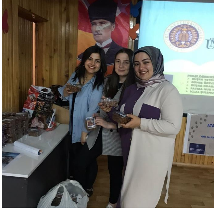
Paketlerin dağıtım için hazırlanması