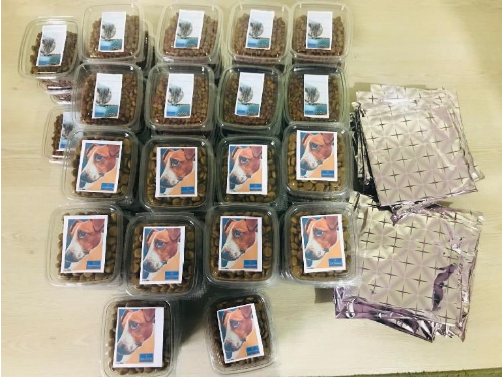
Mamaların paketlenmesi, kitap ve kalemin hediye paketi yapılması