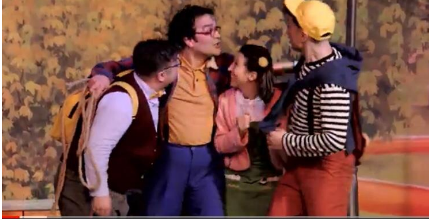
Eti Çocuk Tiyatrosu - Mutluluk Denince Akla 5. Bölüm / Hayvan Sevgisi