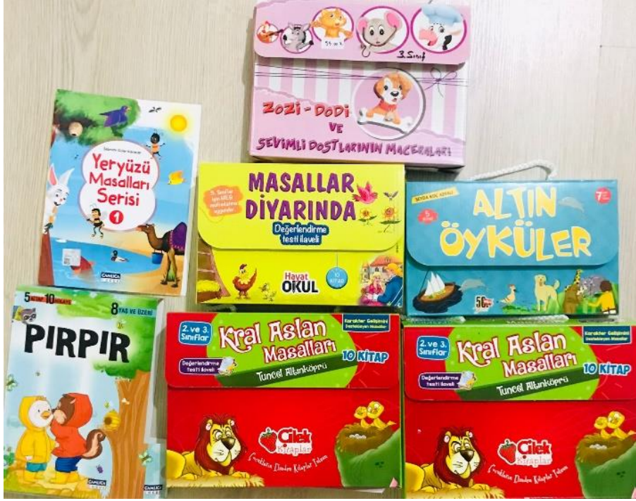
Okuma kitaplarının alınması