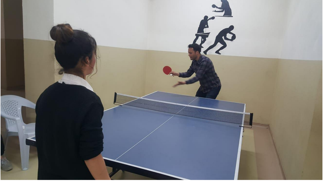
Öğrenci arkadaşlarla masa tenisi maçından görüntüler