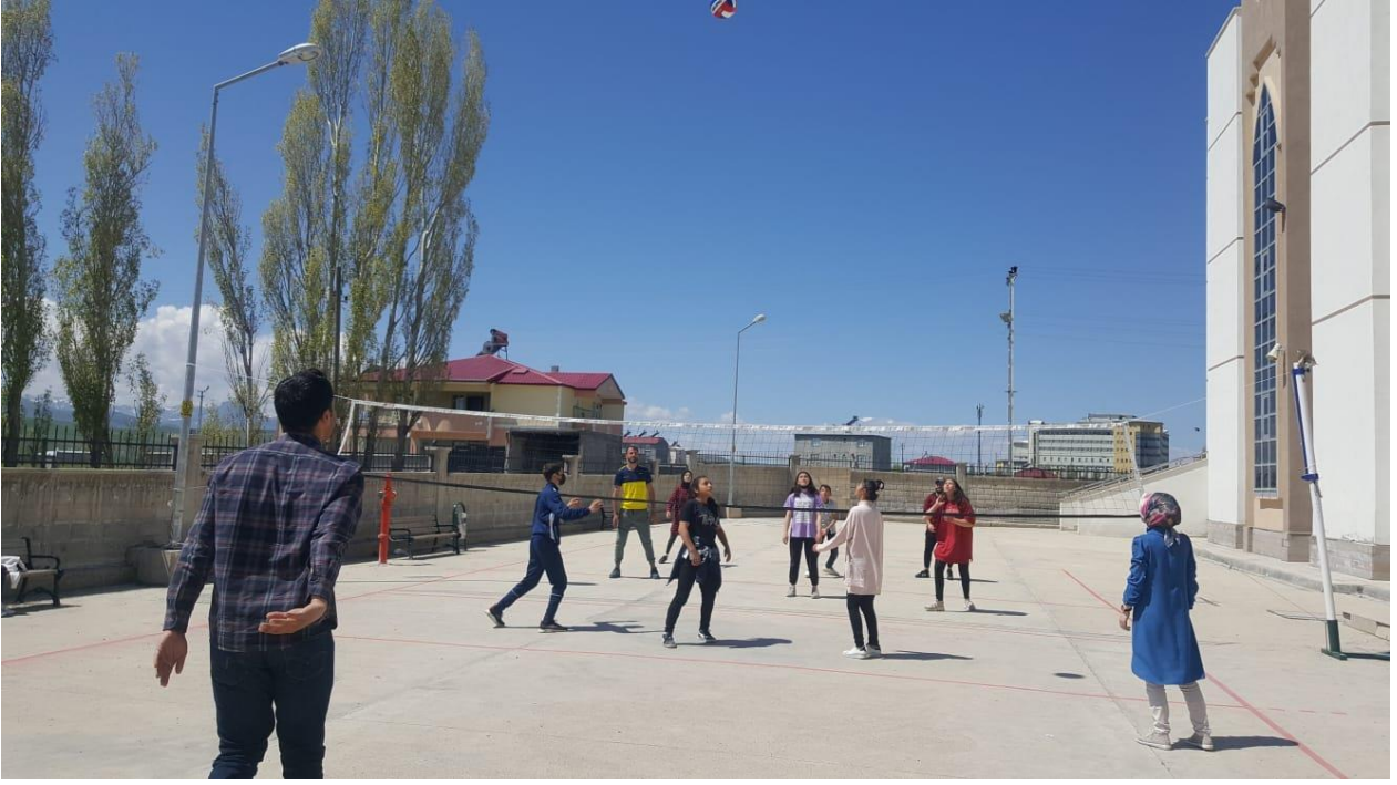
Çeşitli aktivitelerin olduğu görüntüler