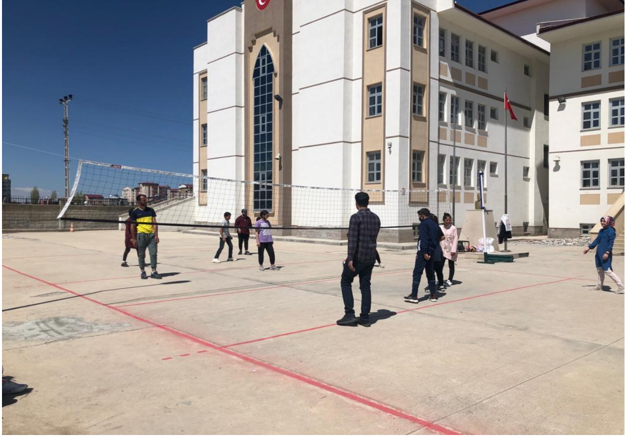
Projenin uygulandığı ortamda öğretmen ve öğrenci arkadaşlarla voleybol maçı