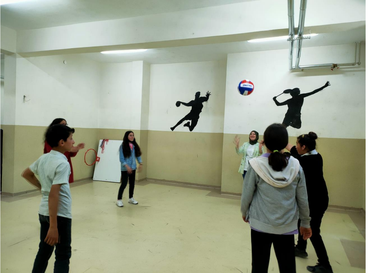
Öğrencilerle birlikte spor salonunda voleybol oynanmasından bir görüntü