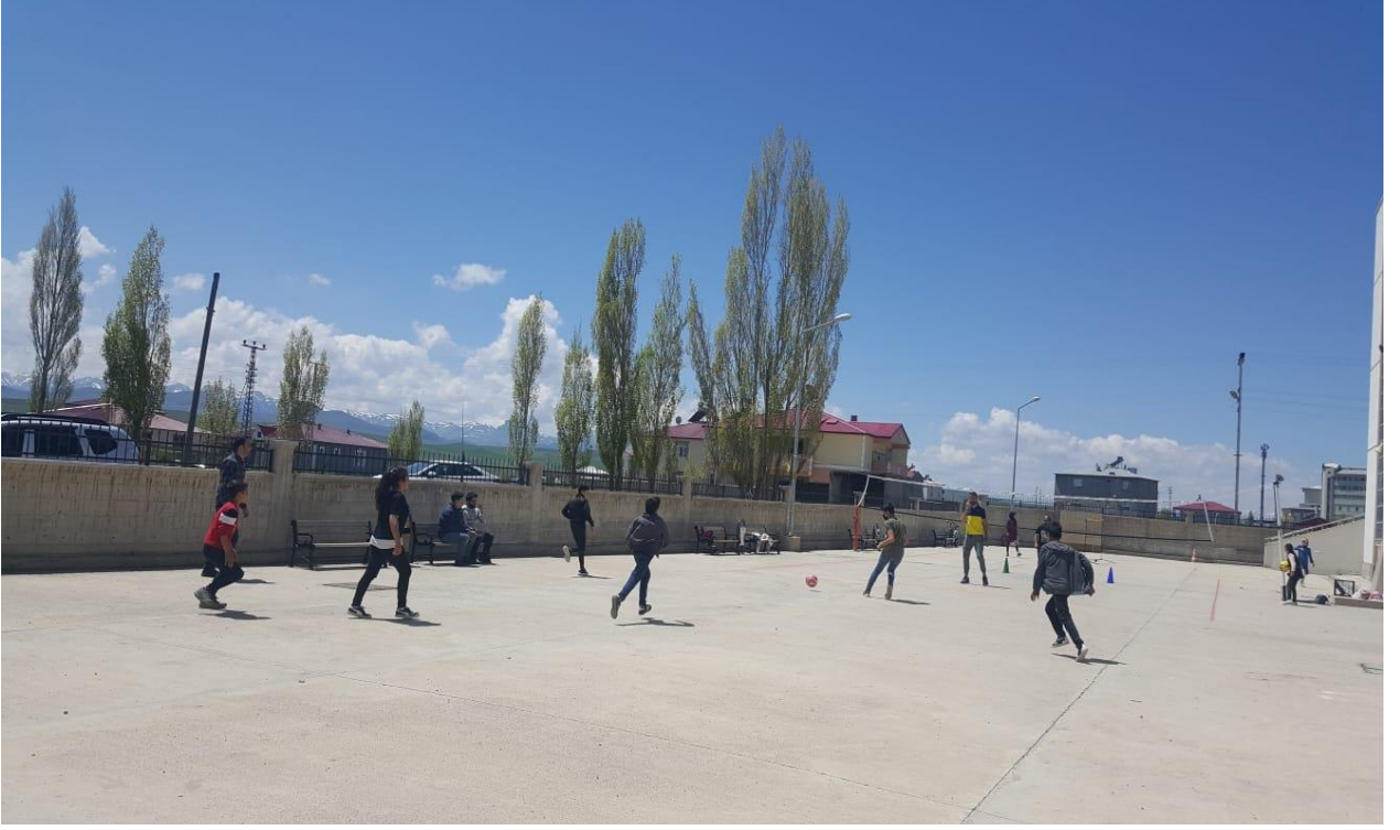
Öğrencilerle birlikte futbol maçından bir görüntü