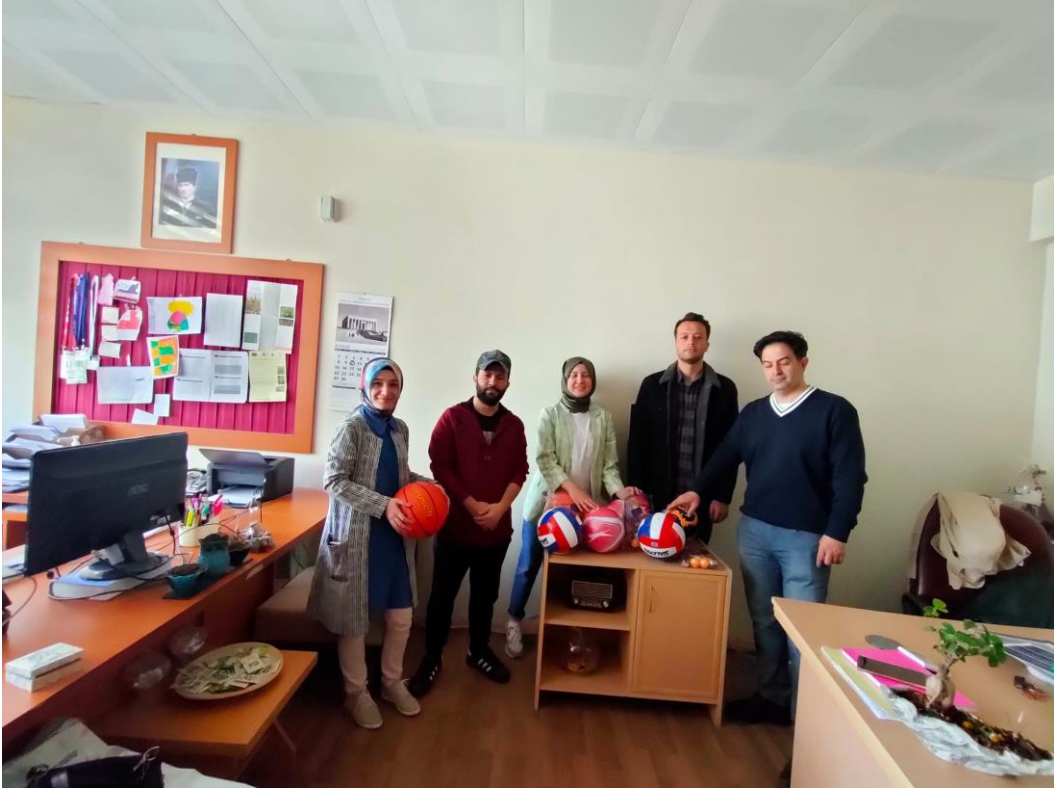
Proje materyallerinin teslim alınması