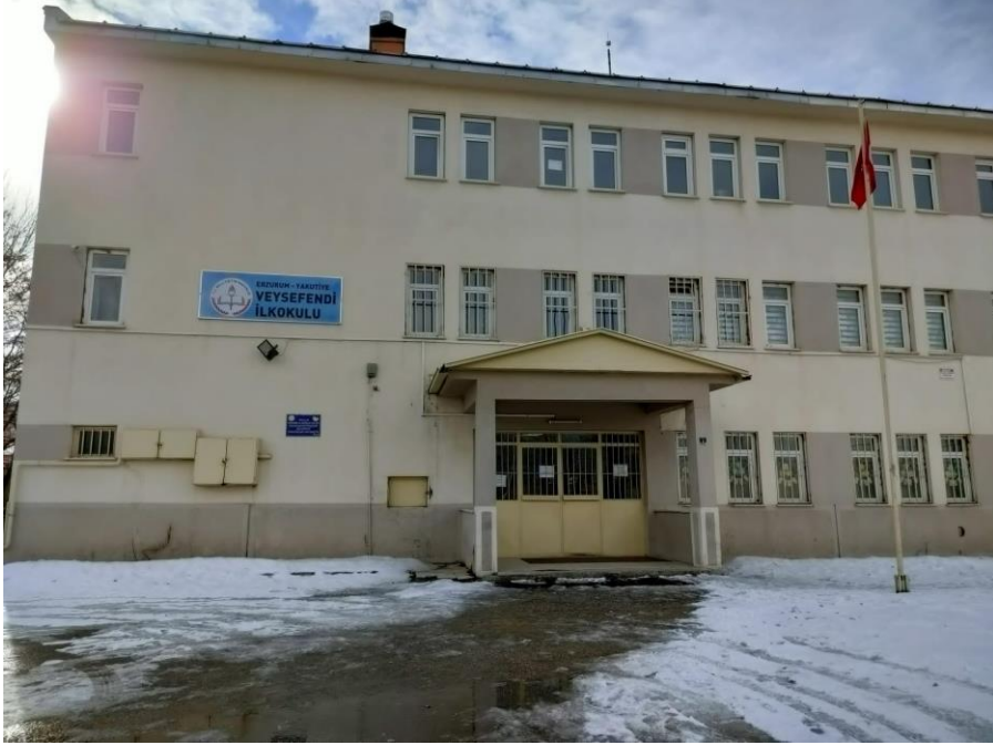
Projenin uygulandığı ilkokul