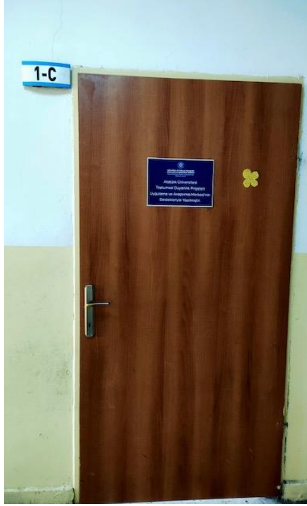
Projenin uygulandığı sınıf