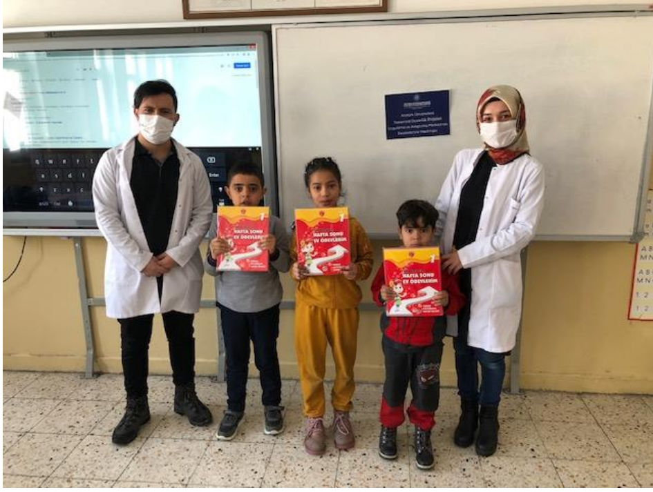
Bilgi yarışmasına katılan 3. grup