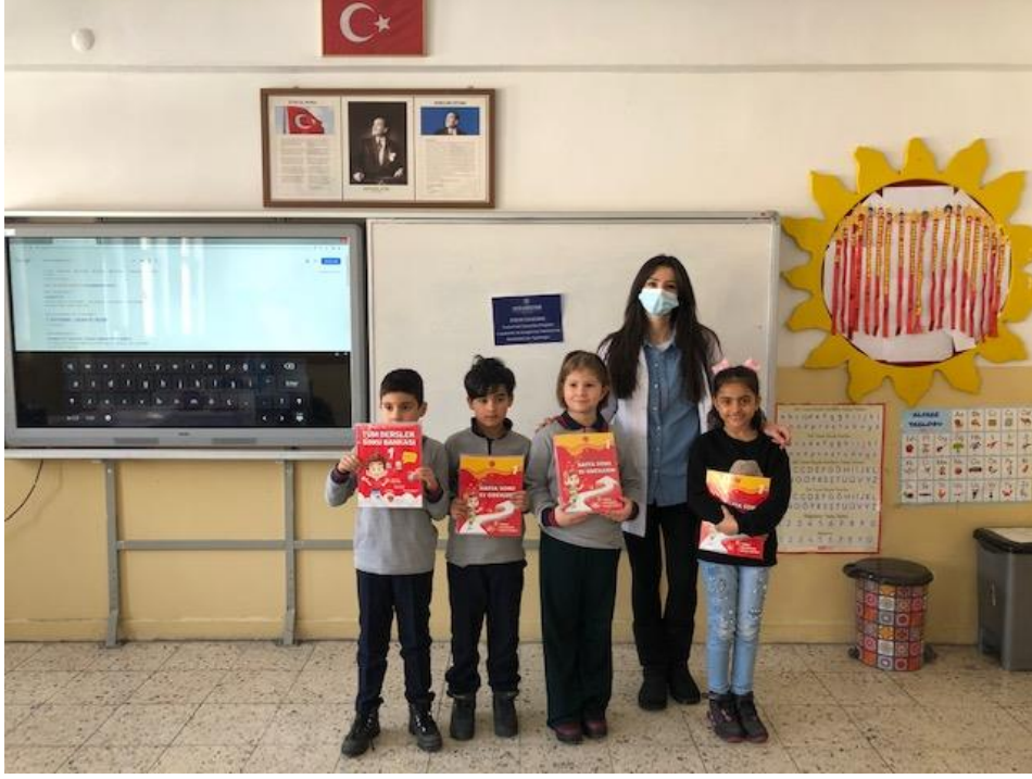
Bilgi yarışmasını kazanan öğrenciler