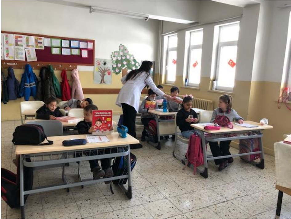
Tüm öğrencilere kitap setinin dağıtımı