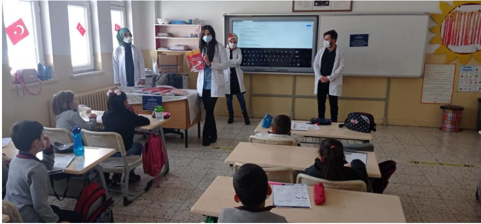
Bilgilendirici ön konuşma