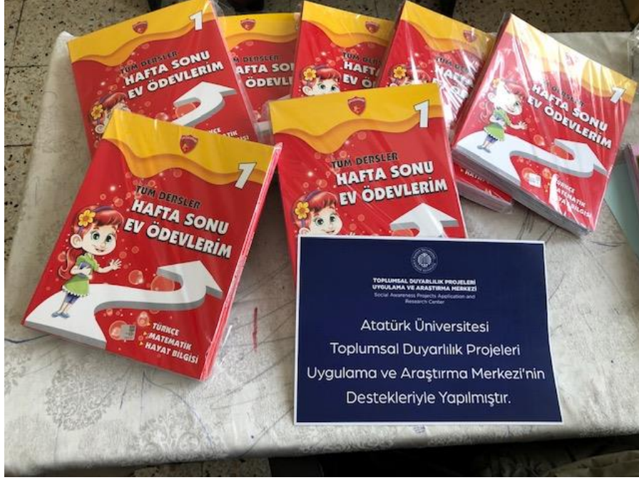
Proje için dağıtılacak materyal