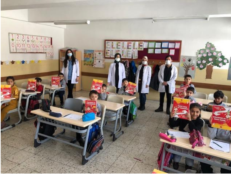
Projenin uygulandıđı sınıfa ait görsel