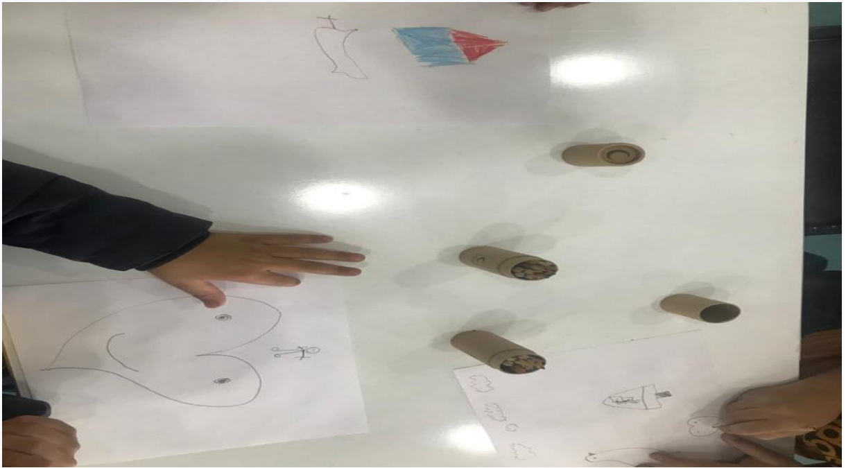
Resim2. ocuklar resimlerini iziyor