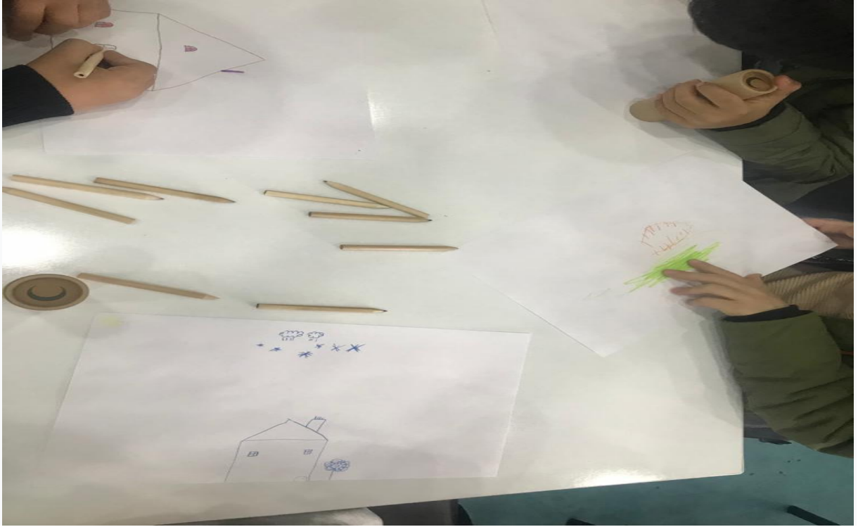
Resim 1. ocuklar resimlerini iziyor