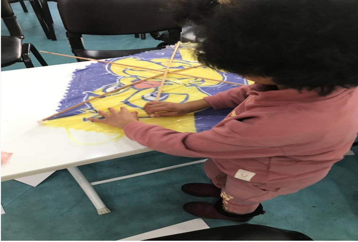
Resim3. Uçurtmalar monte ediliyor