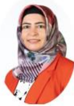
GİRİŞİMCİ GENÇLİK VE KARIYER KULÜBÜ