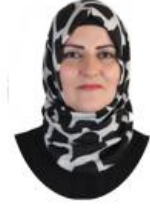
ATA ÇEVRE VE TASARIM TOPLULUĞU