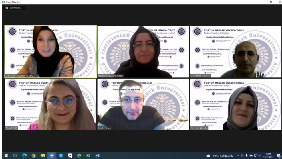
Şekil 1. Yarışmaya Katılan Projeler