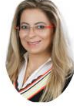
DOĞA, SPOR VE FOTOĞRAFÇILIK TOPLULUĞU