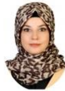
SANAT VE MEDYA KULÜBÜ