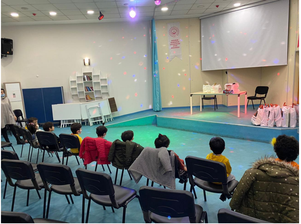
Projenin uygulandıđı Nene Hatun Kız Yetiřtirme Toplantı ve Eđlence Odası