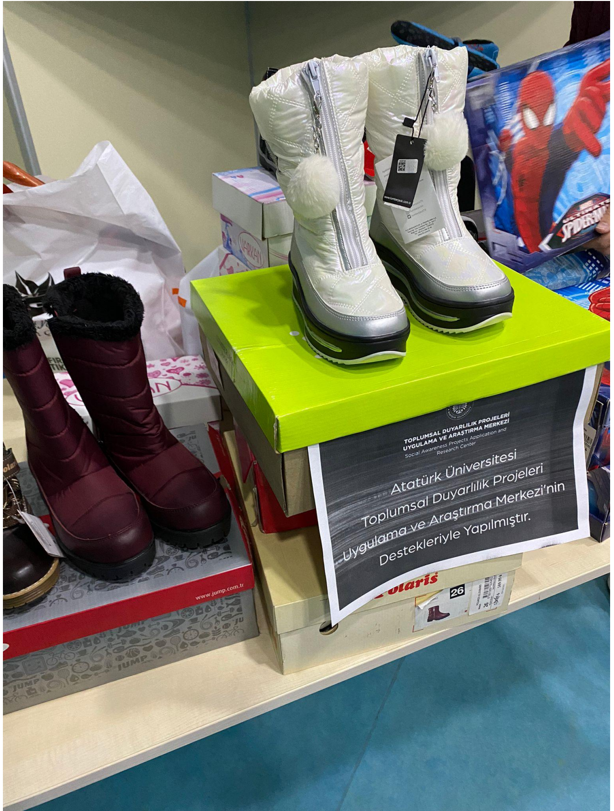
Proje kapsamında temin edilen botlar