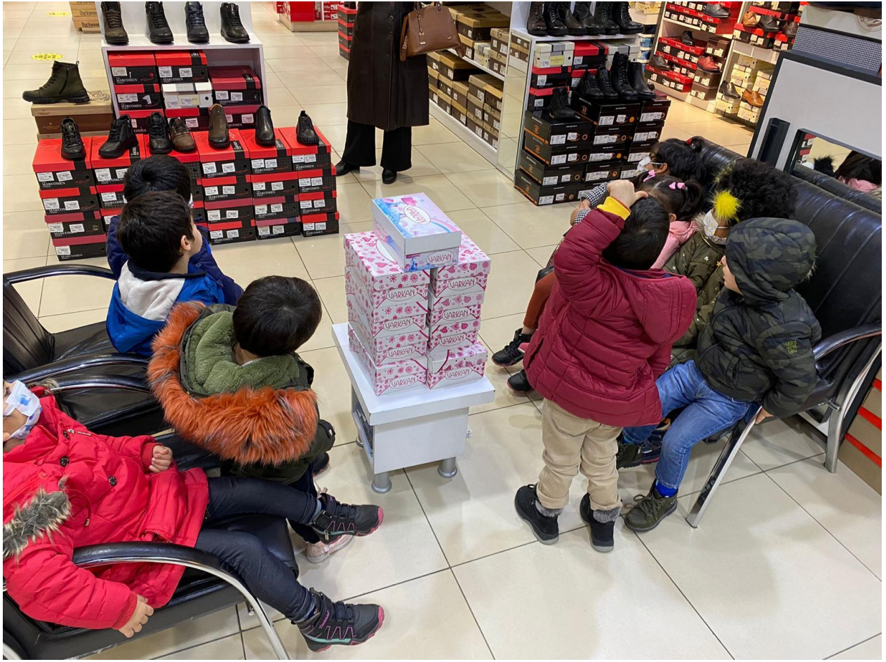
Proje konusu olan botların küçük kardeşlerimiz tarafından teslim alınması