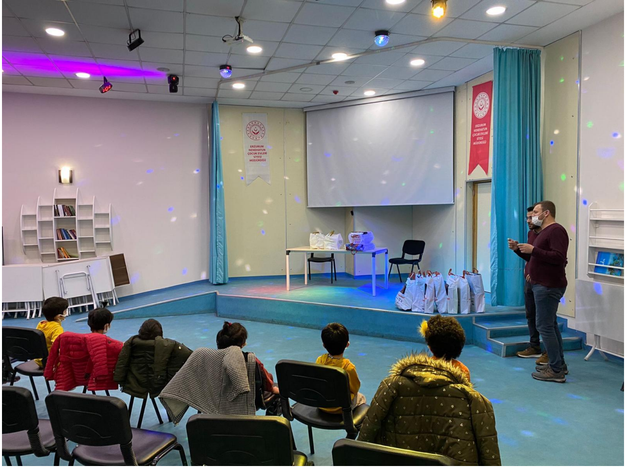
Proje kapsamında tedarik edilen botların küçük kardeşlerimize teslim edilmesi