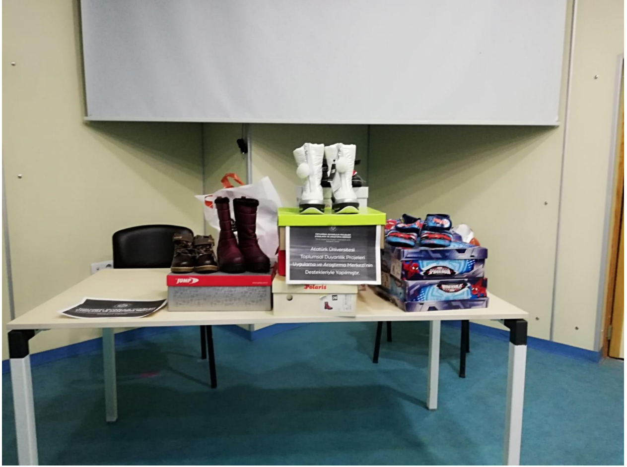
Proje kapsamında alınan botlar