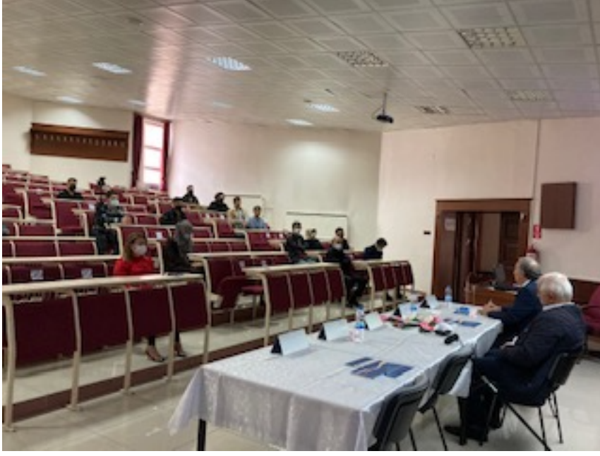
Konuřmacılar, plaketlerini alırken...