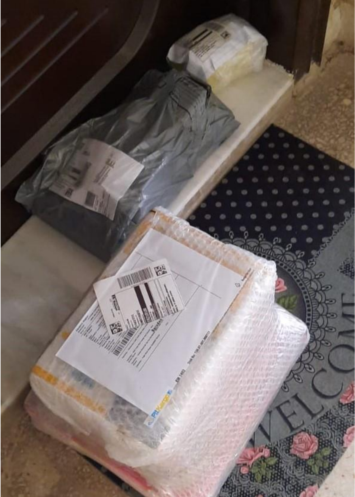
Proje materyallerinin teslim alınması