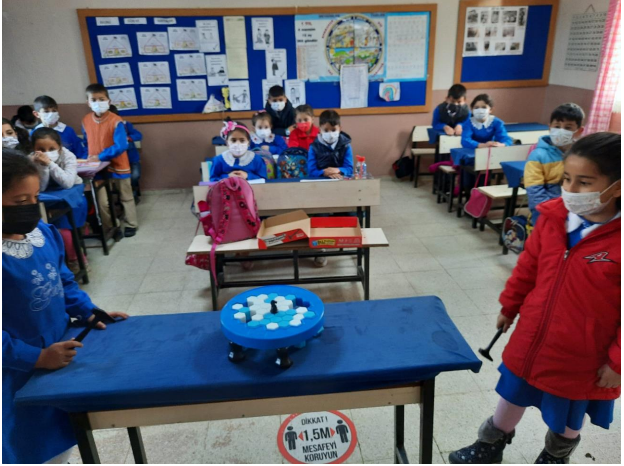
Etkinlik Oyunlarının Oynanması