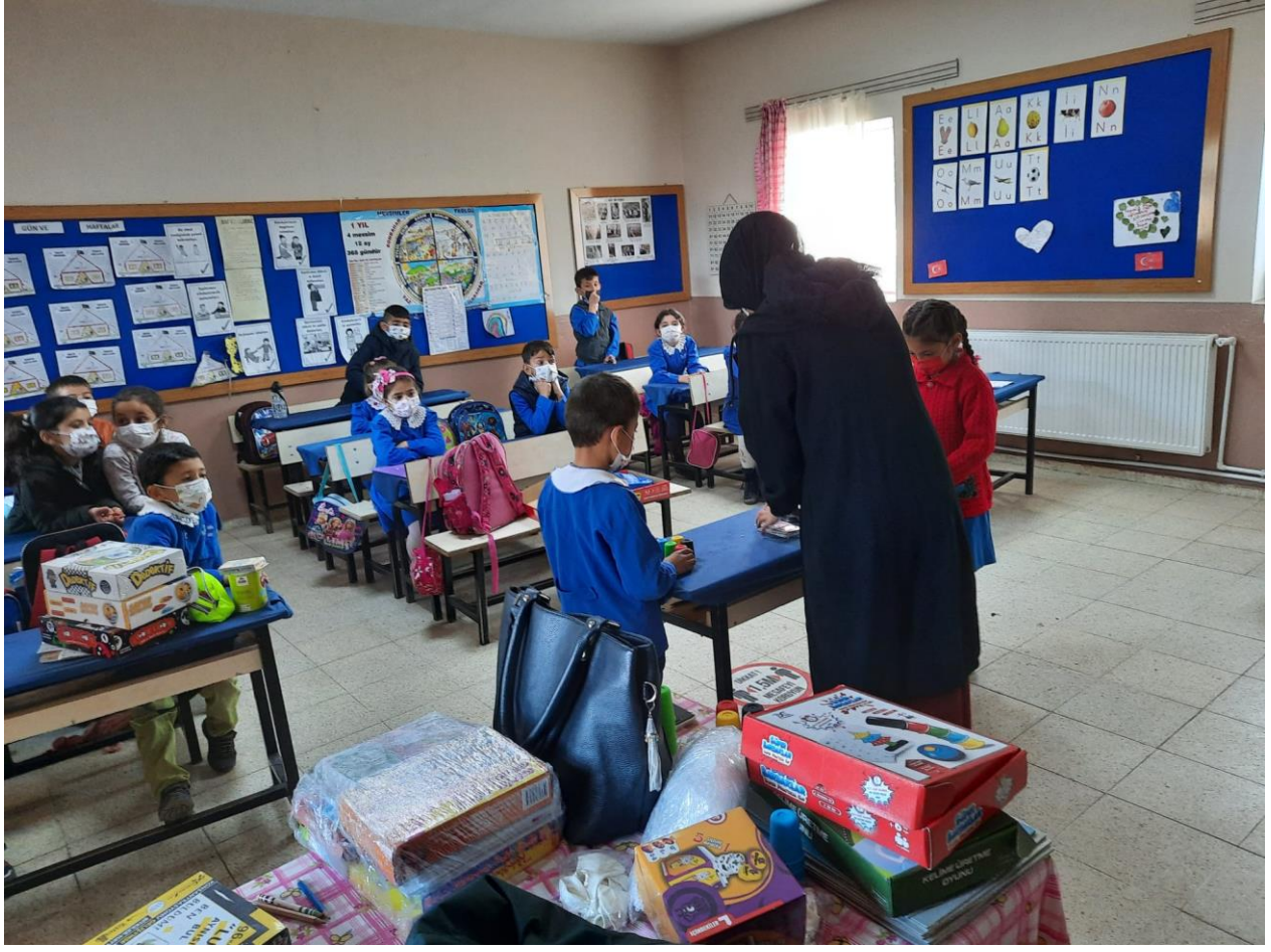
Etkinlik Oyunlarının Oynanması