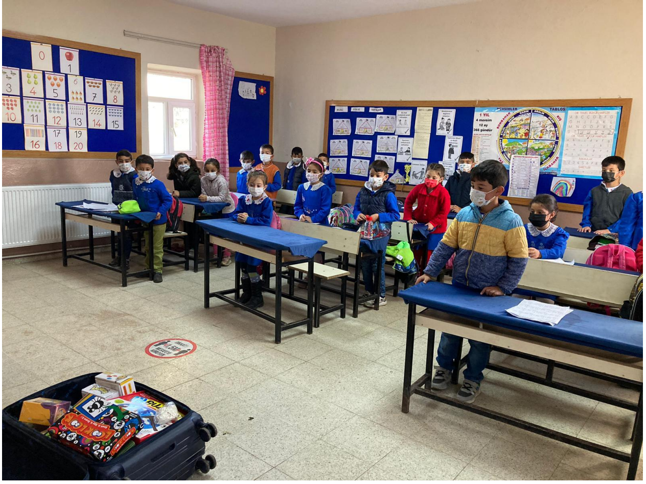
Proje Etkinliđinin Yapıldıđı Sınıf