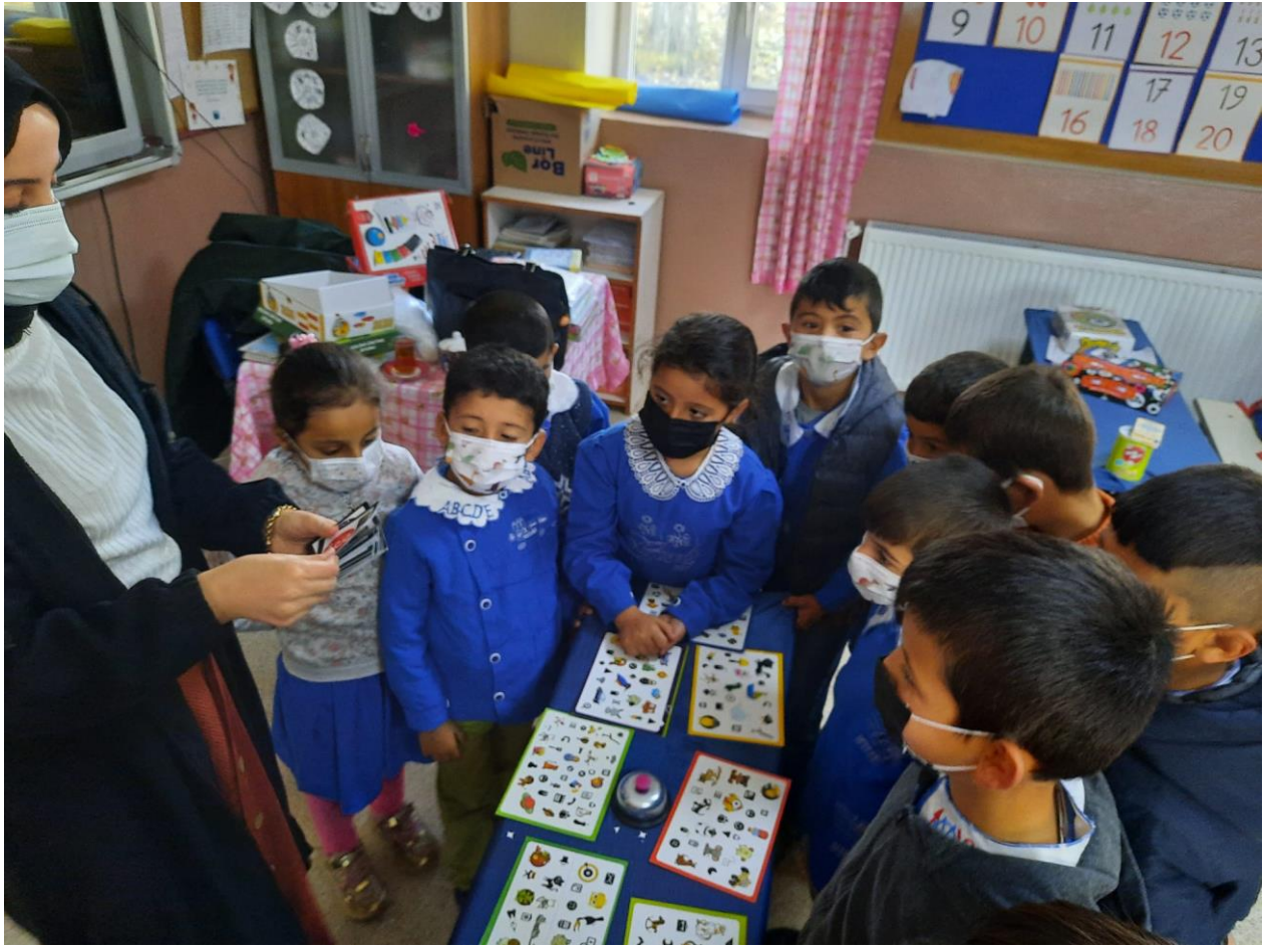
Etkinlik Oyunlarının Oynanması