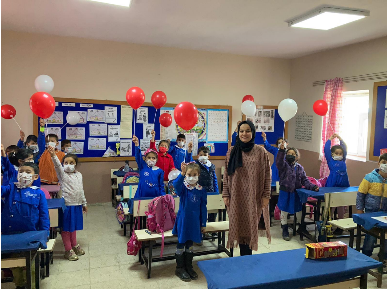
Öğrencilere Balon Dağıtımı