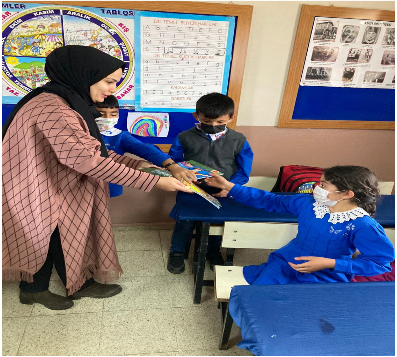
Proje Kapsamında Alınan Kitapların Yürütücü Tarafından Dağıtımı