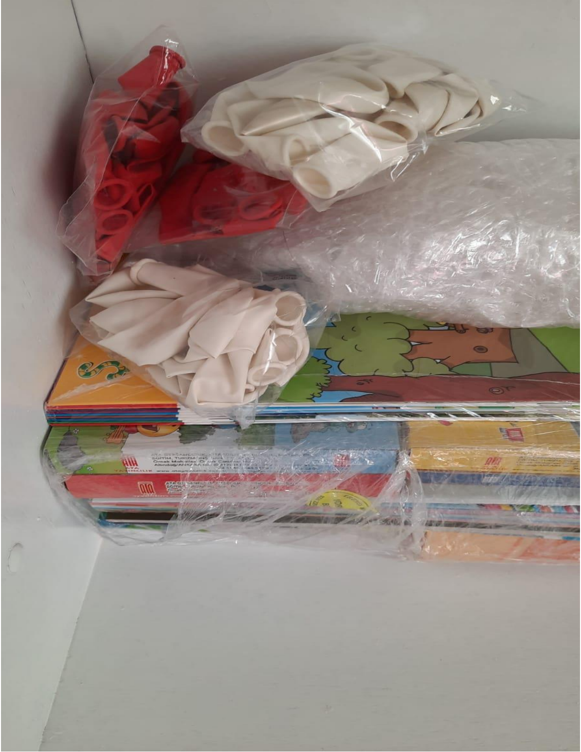
Proje materyallerinin teslim alınması