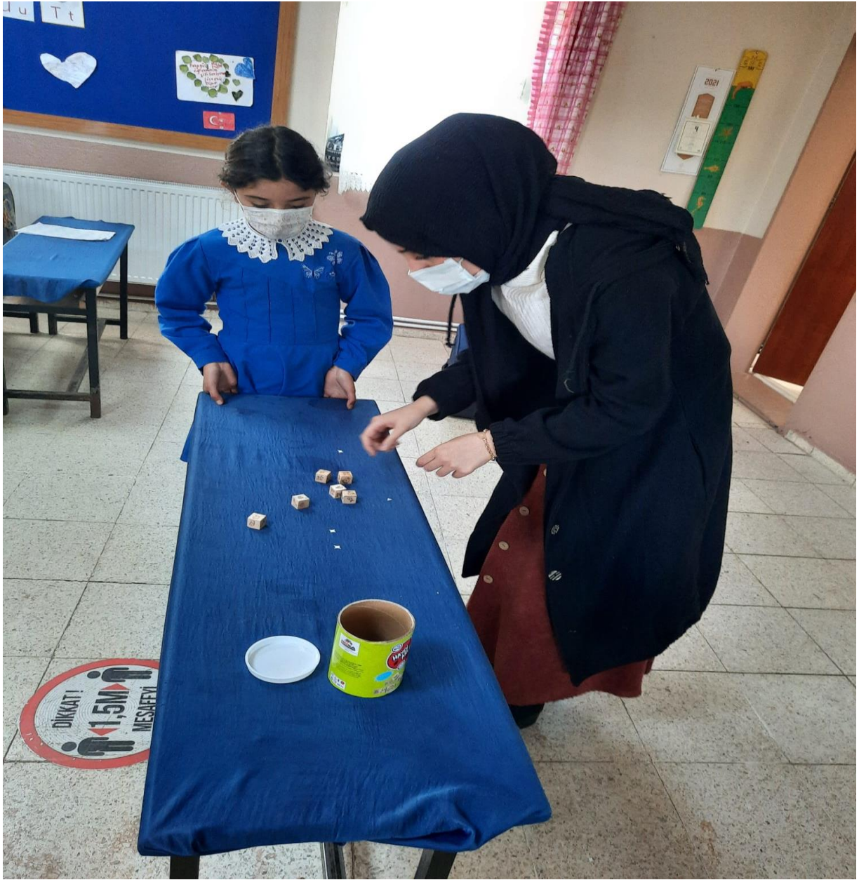
Etkinlik Oyunlarının Oynanması