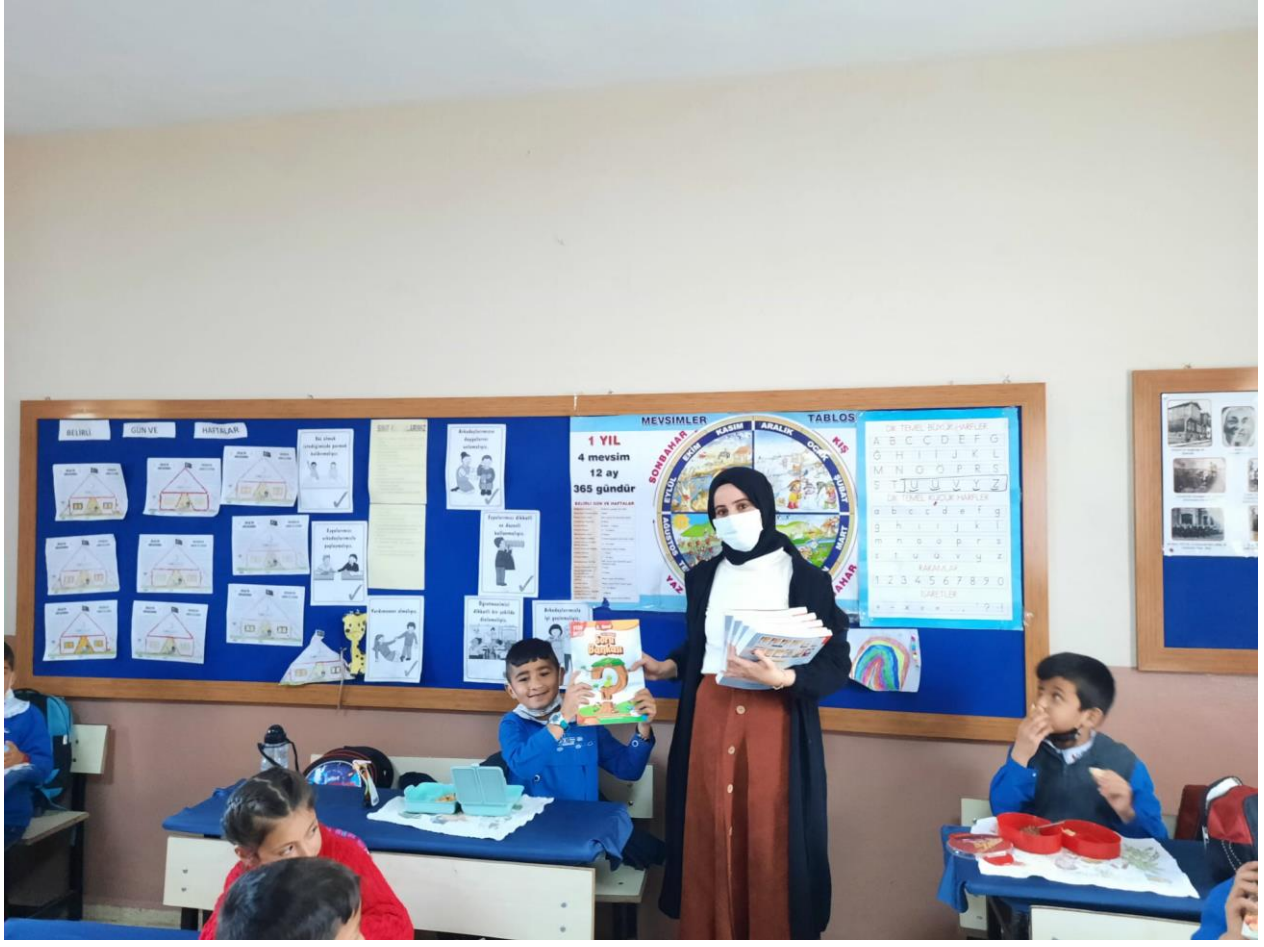
Proje Kapsamında Alınan Kitapların Öğretmen Tarafından Dağıtımı