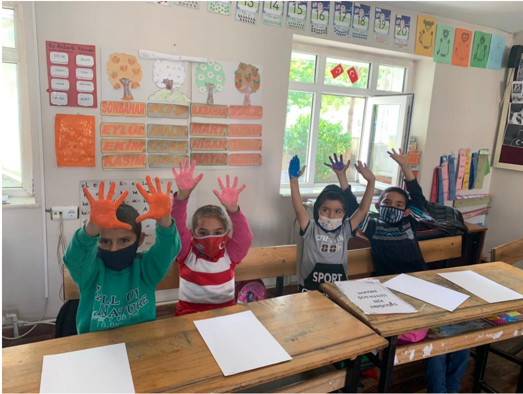
Parmak boyama uygulama