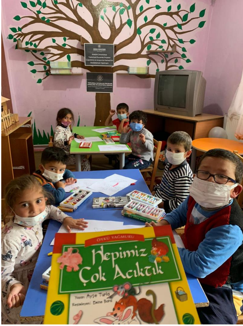
Kitap okuma farkındalığı kazandırma