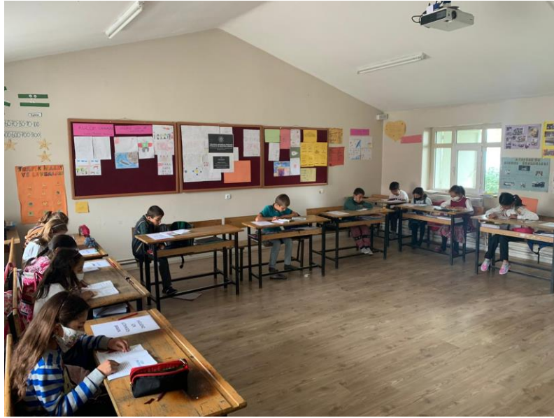
Afişlerin sınıflara asılması