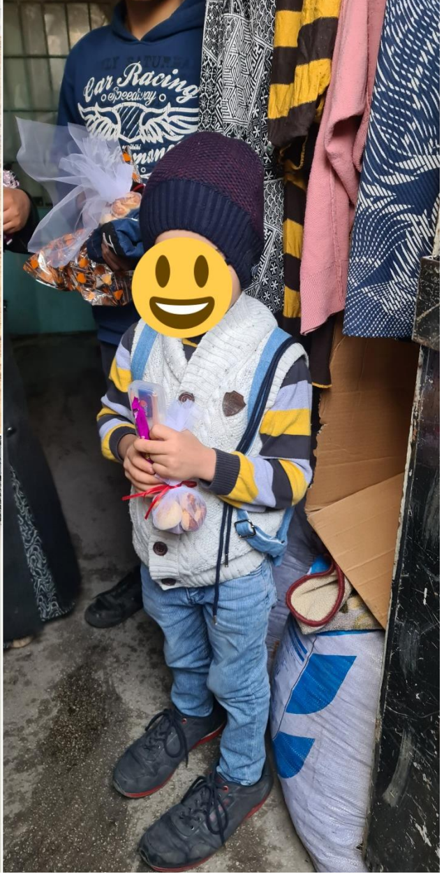
Proje Uygulama Çalışmaları (Bere Örneği)