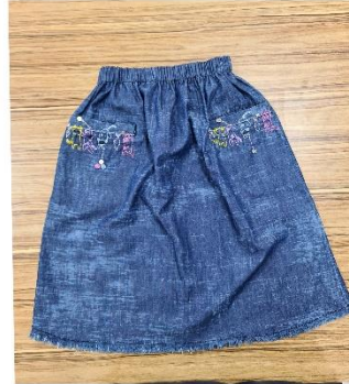
Etek ve etek-bluz alıřmalarına rnekler