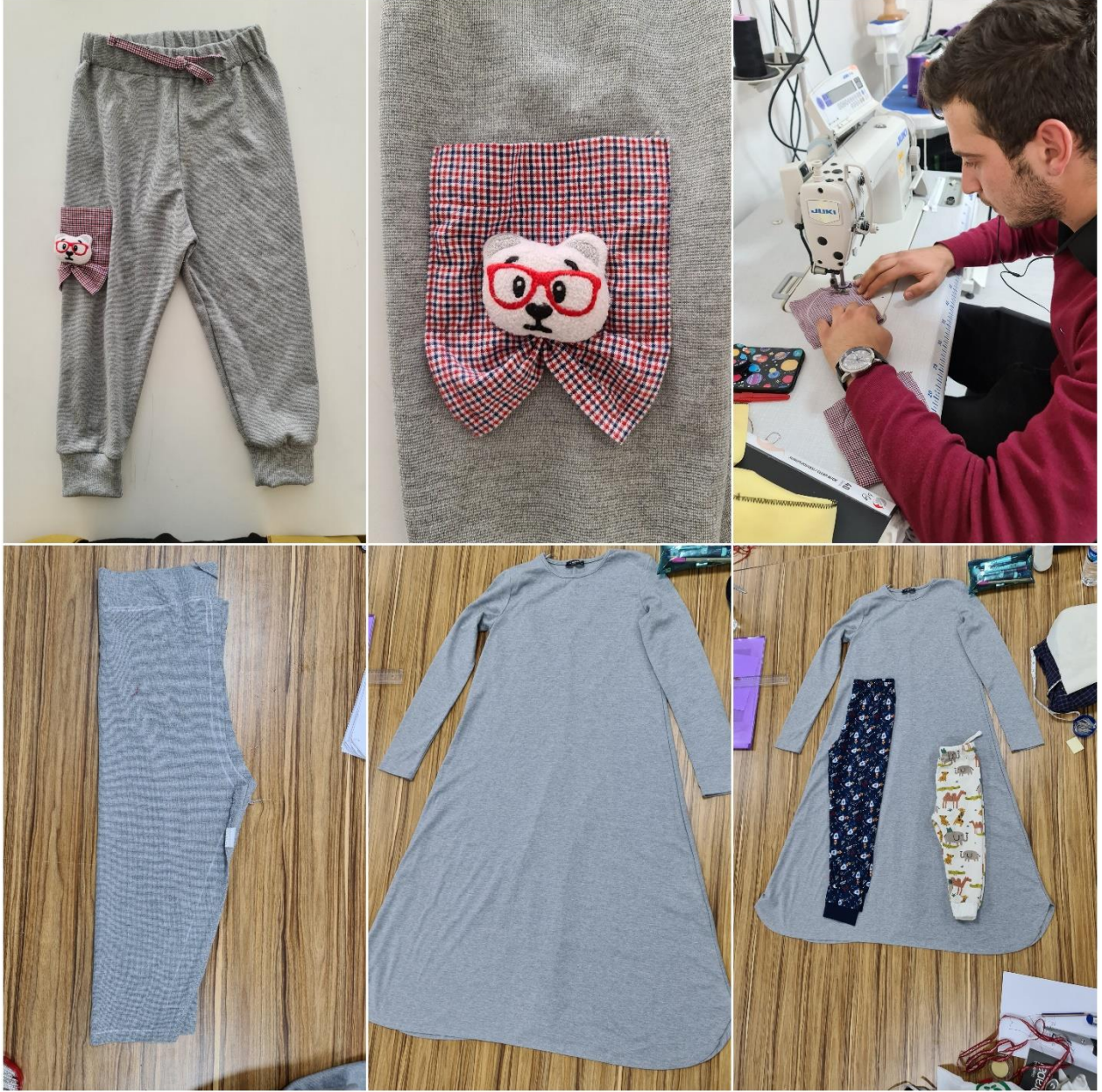
Proje Uygulama Çalışmaları (Pijama Örneği)