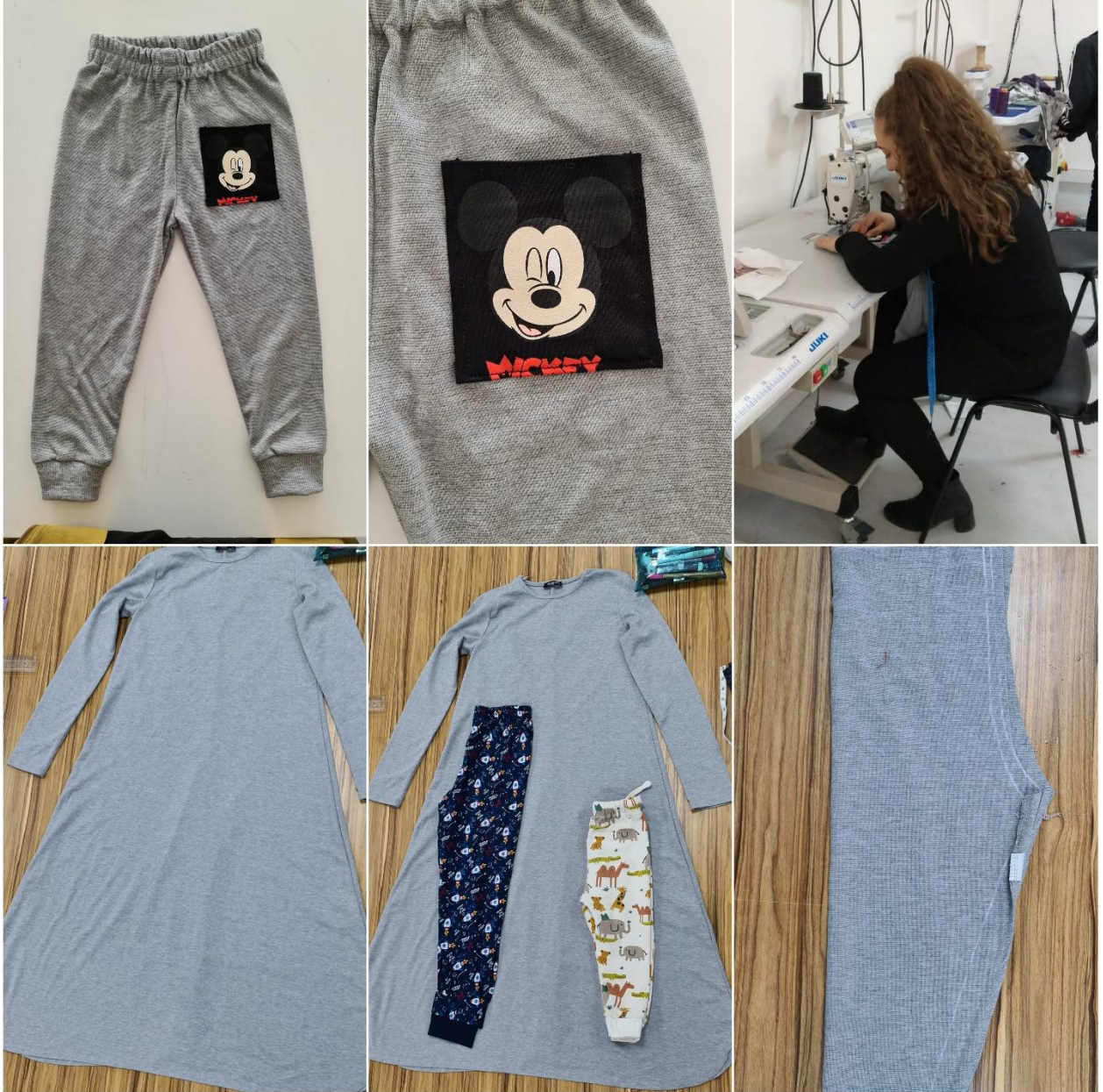
Proje Uygulama Çalışmaları (Pijama Örneği)