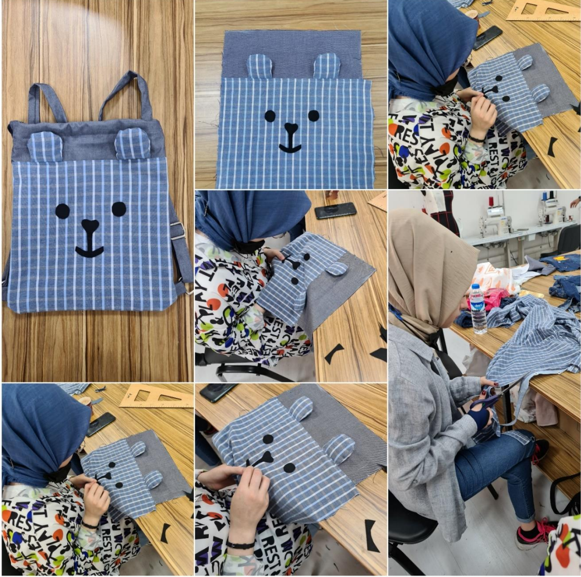
Proje Uygulama Çalışmalar (Çanta Örneği)