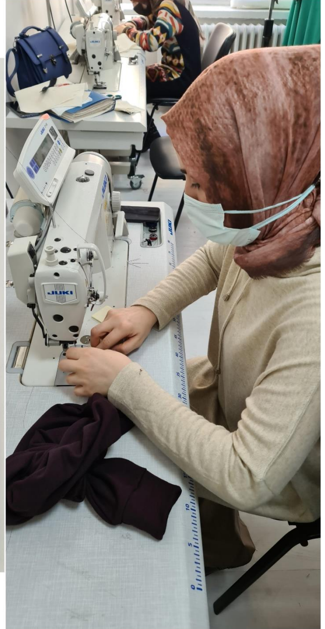
Proje Uygulama Çalışmaları (Pijama Örneği)