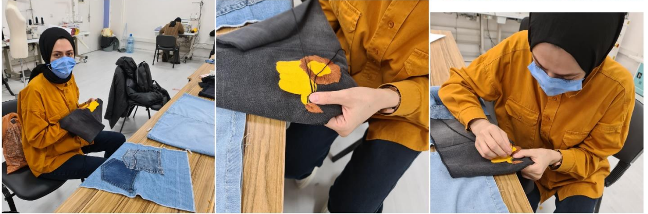
Proje Uygulama Çalışmalar (Çanta Örneği)