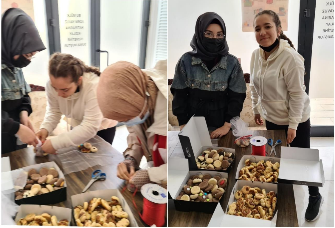
Hediye paketi içine eklenen kurabiyelerin hazırlanması