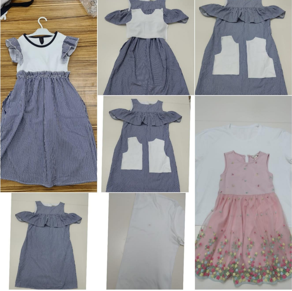
Proje Uygulama alıřmaları (Elbise rneęi)