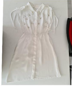
Elbise alıřmalarına rnekler