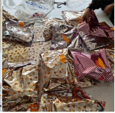
Dağıtım hazırlık ve dağıtım