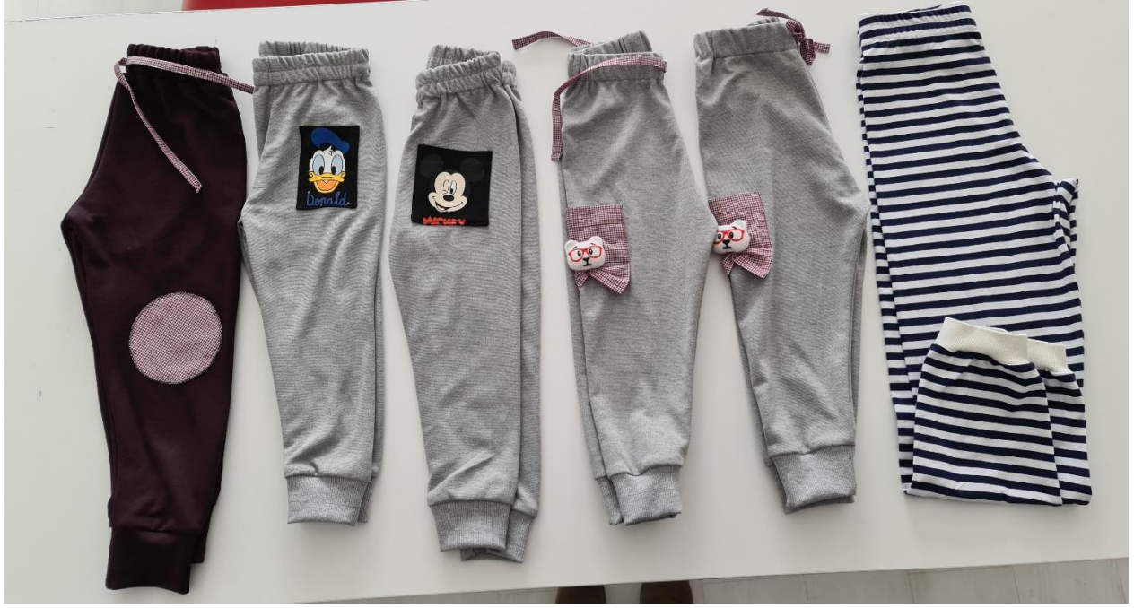
Pijama alıřmaları rnekler