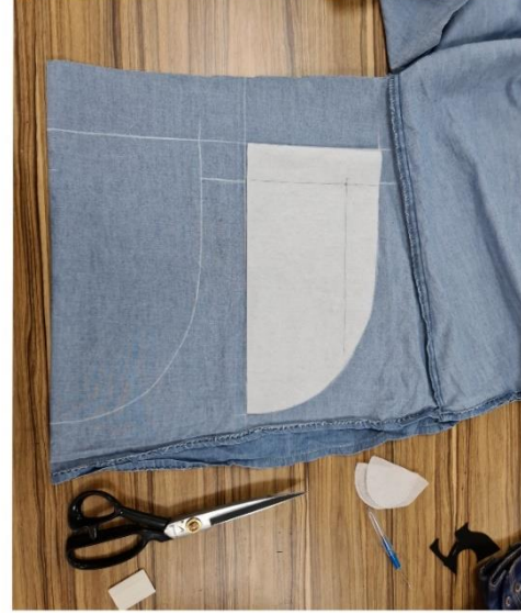
Proje Uygulama Çalışmaları (Çanta Örneği)