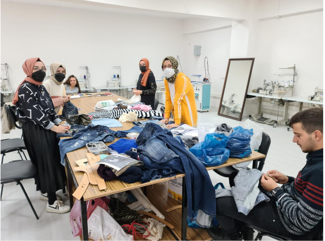
Projenin uygulandıđı ortam