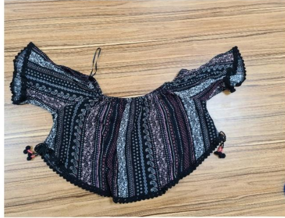
Proje Uygulama Çalışmaları (Etek Örneği)