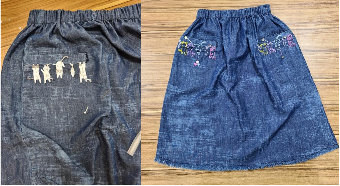
Proje Uygulama Çalışmaları (Etek Örneği)