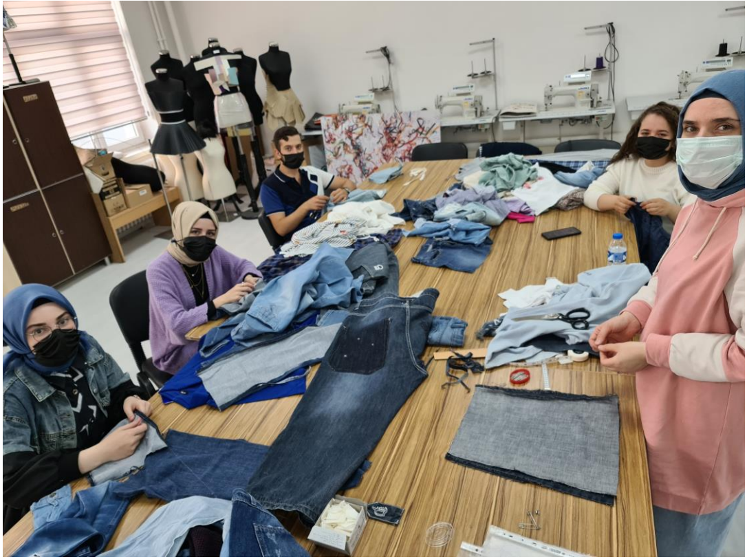
Projenin uygulandığı ortam