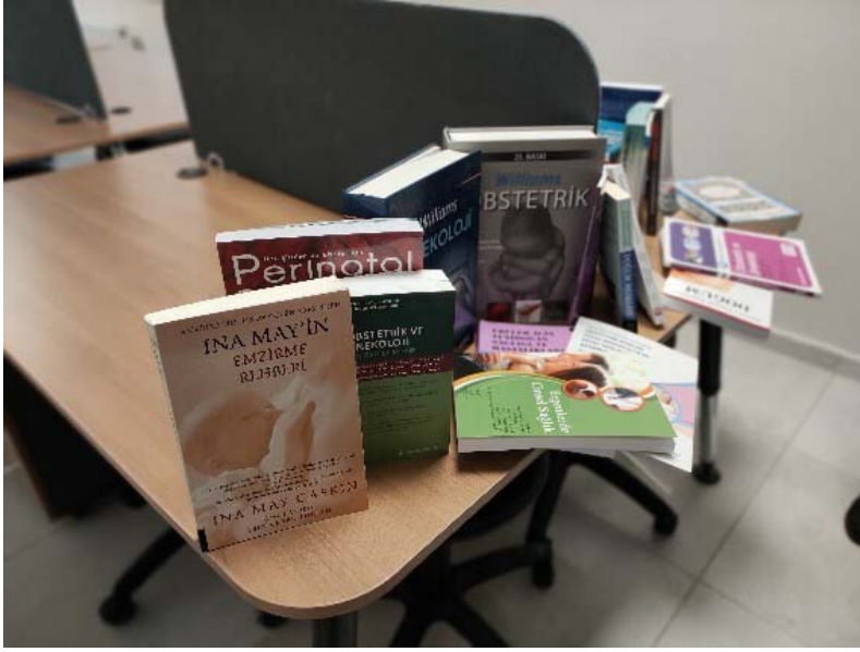
Kitaplara Atatürk Üniversitesi Toplumsal Duyarlılık Projeleri Uygulama ve Araştırma Merkezi etiketlerinin yapıştırılmasına ait görseller