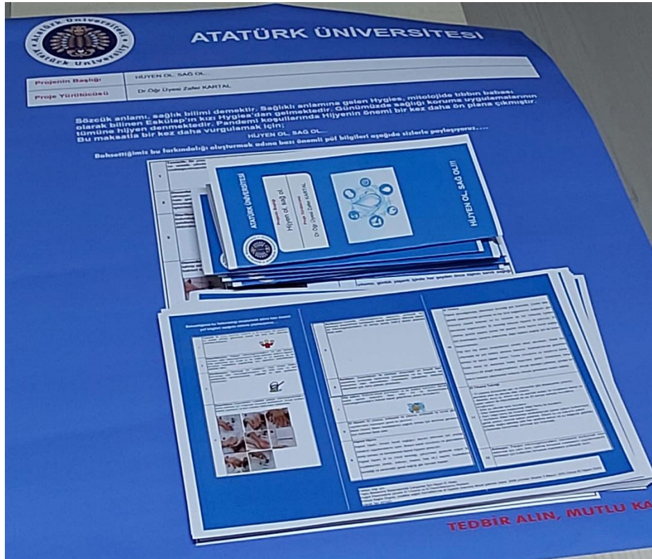
Resim 8: Afiş ve broşürler