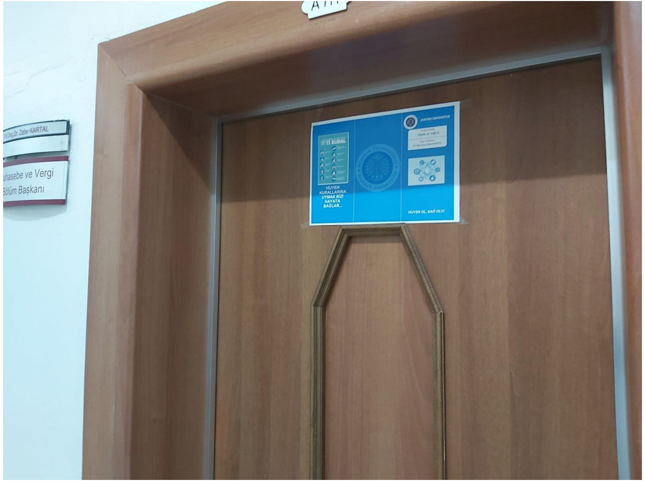
Resim 7: Öğrenci ve çalışanlara dağıtılan “Hijyen Ol Sağ Ol” proje broşür görseli