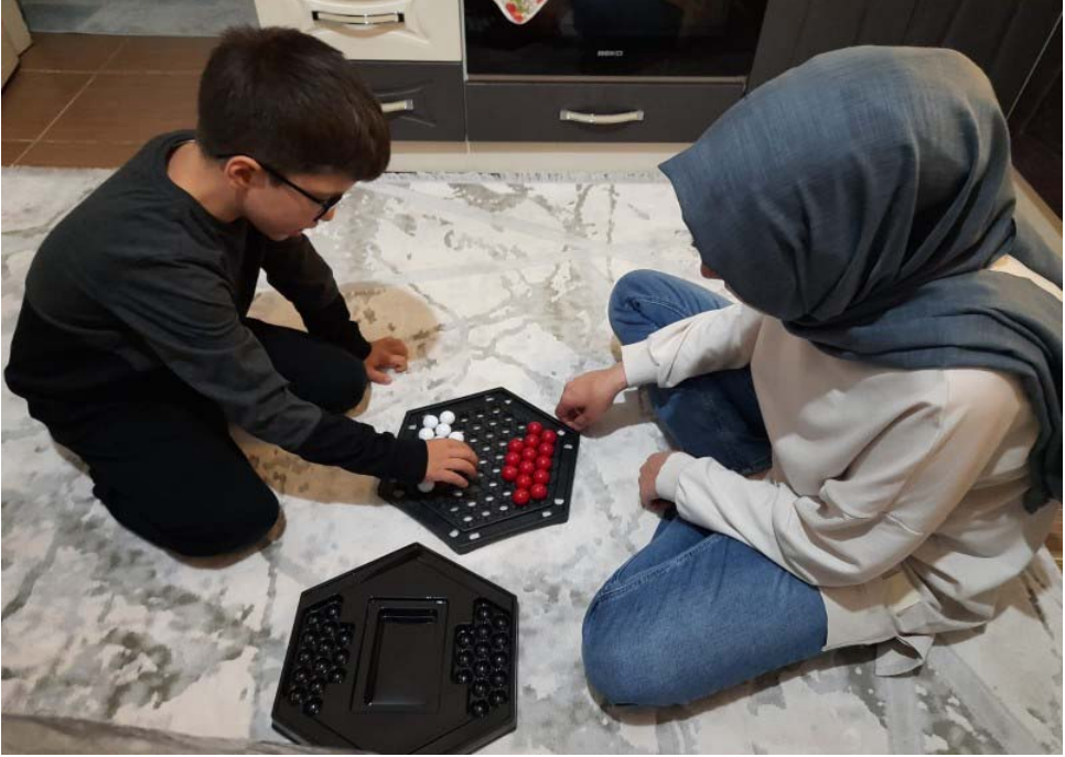
Çocukların zeka oyunları oynarken çekilmiş fotoğrafları