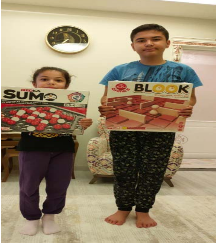
Çocukların zeka oyunları oynarken çekilmiş fotoğrafları