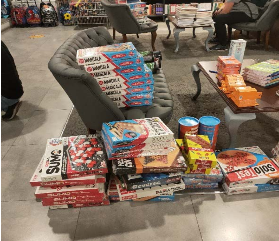
Proje materyallerinin teslim alınması