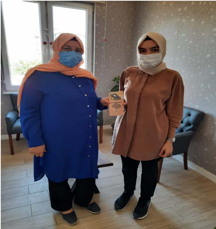
Eđitime ait gorseller