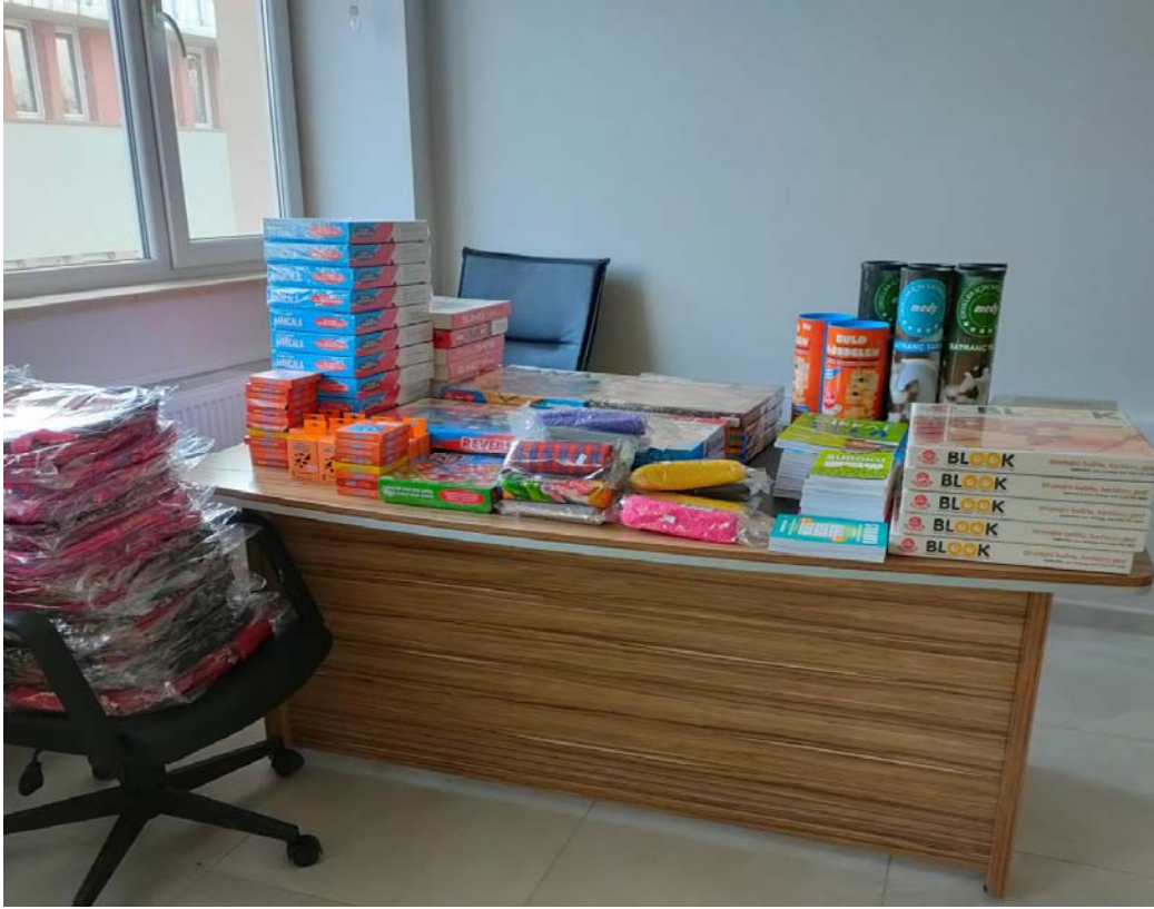
Malzemelere ait resimler