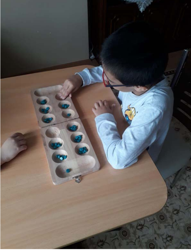
Çocukların zeka oyunları oynarken çekilmiş fotoğrafları