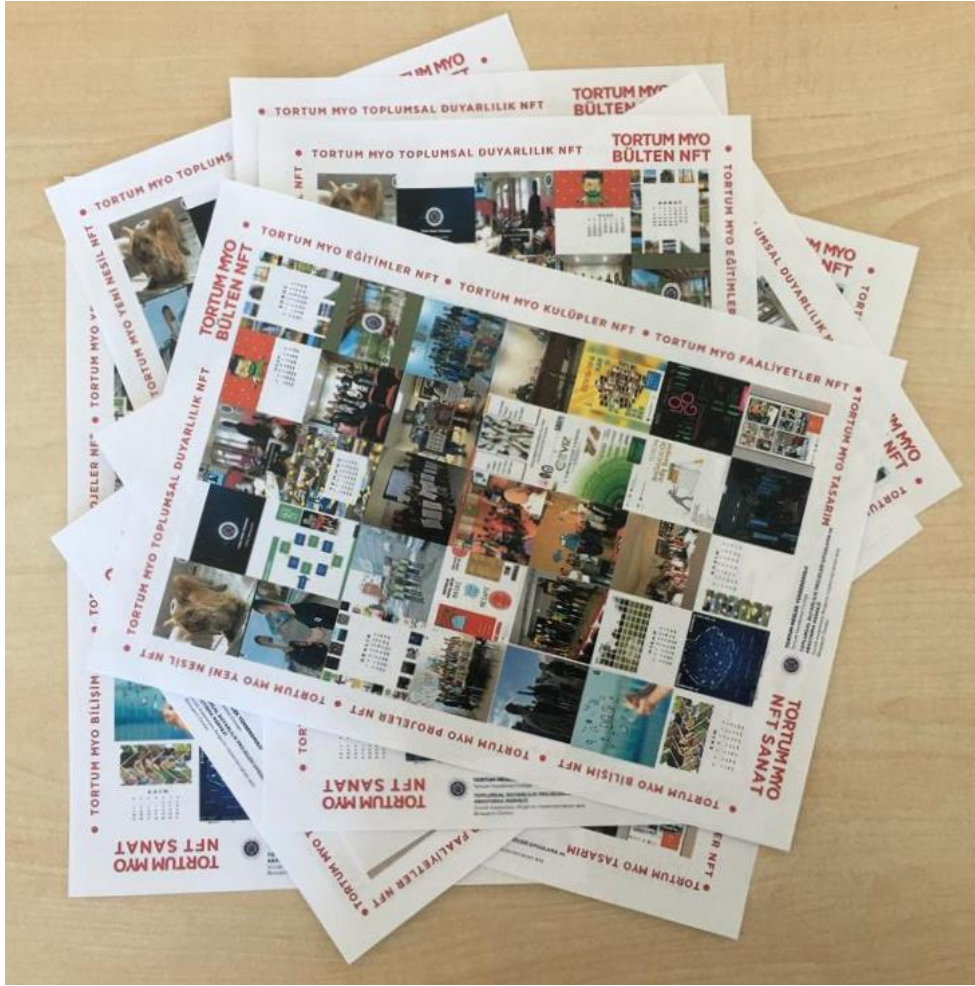
Şekil 3. Broşür Baskısı