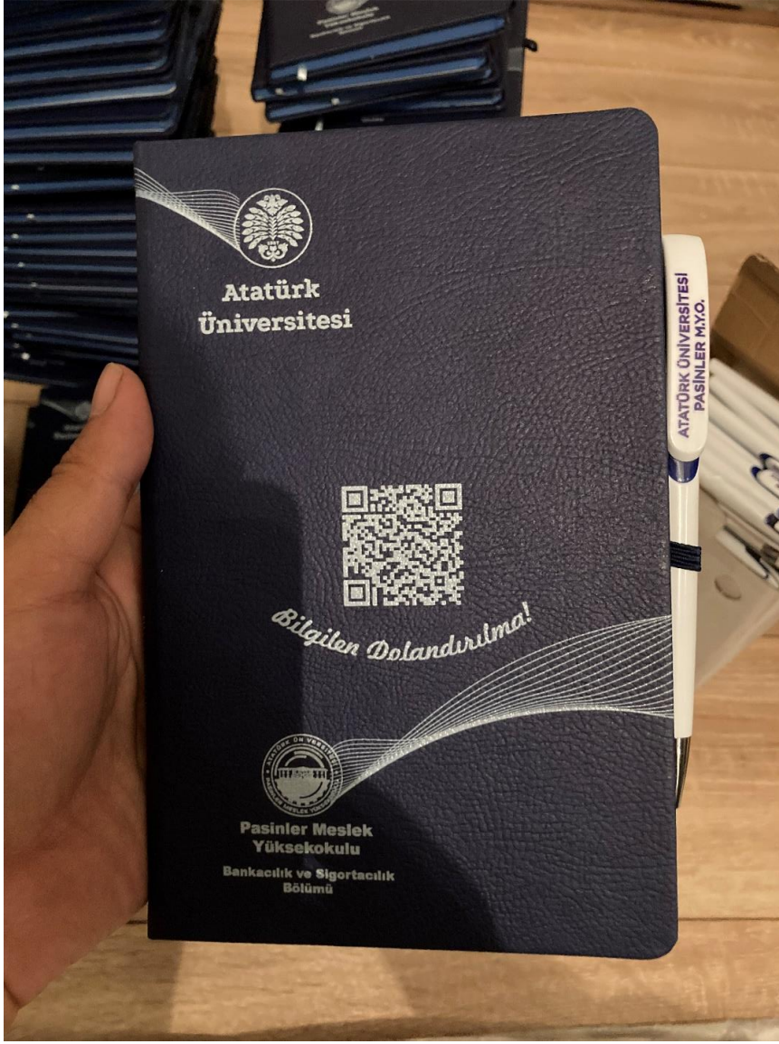
Proje materyali görseli