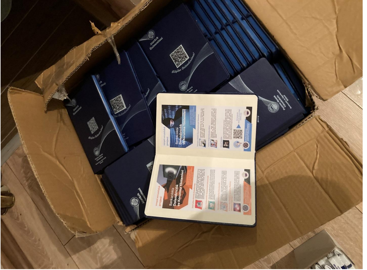
Proje materyallerinin teslim alınması