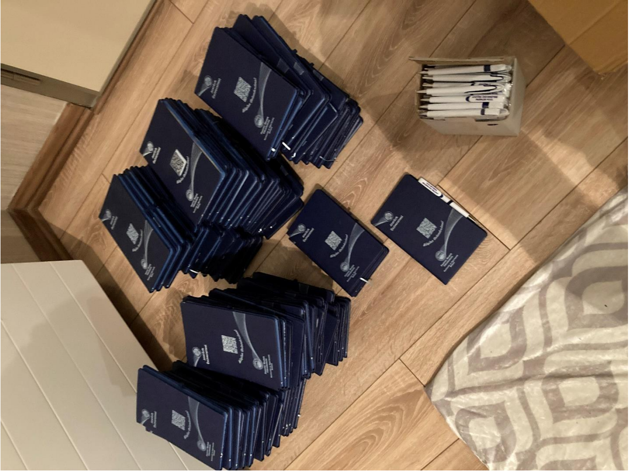
Proje materyali görseli