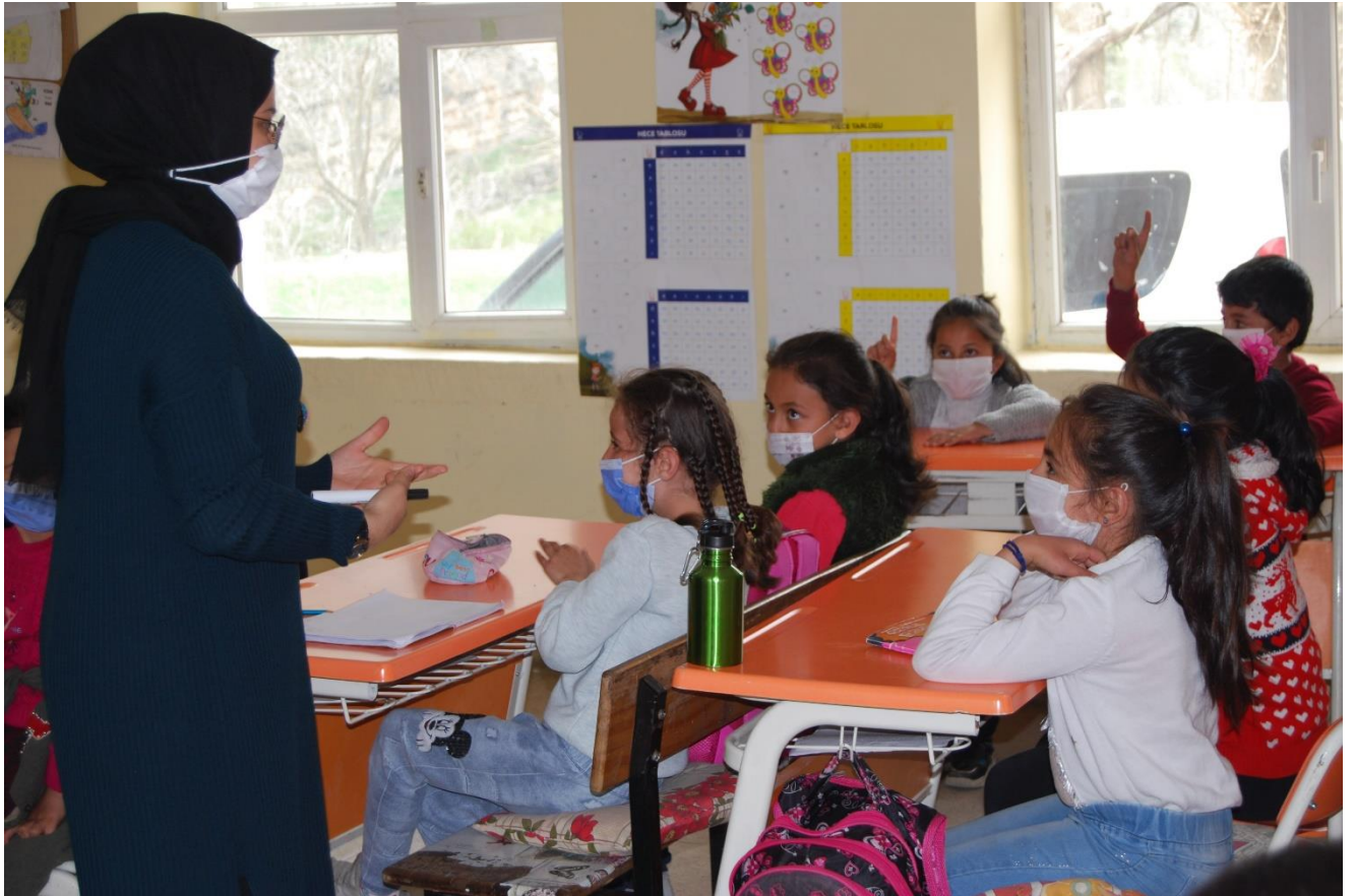
Üzümcü Köyü İlkokulu ilk etkinlik.