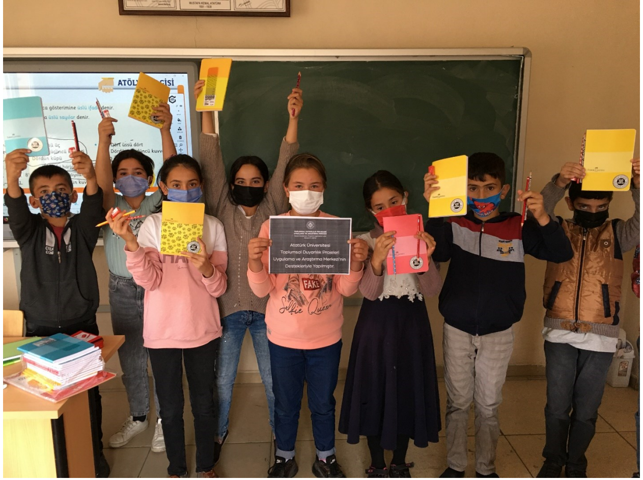
Projenin uygulandıđı ortam