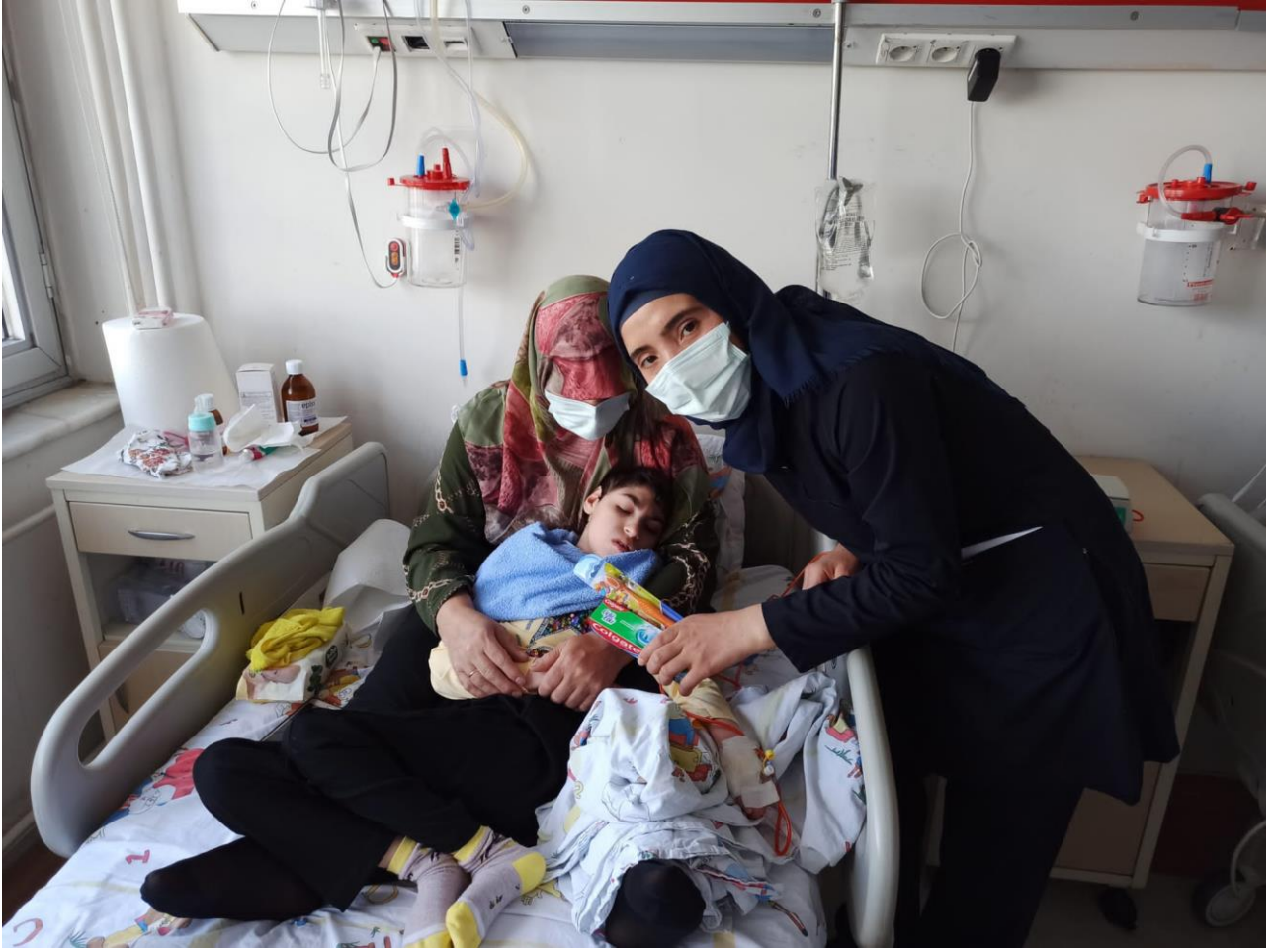
Projenin uygulandıđı ortam