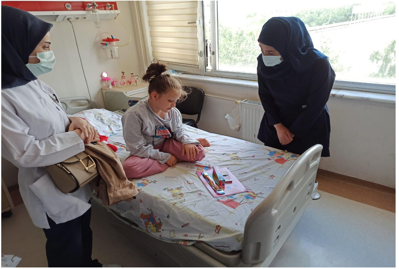
Projenin uygulandığı ortam