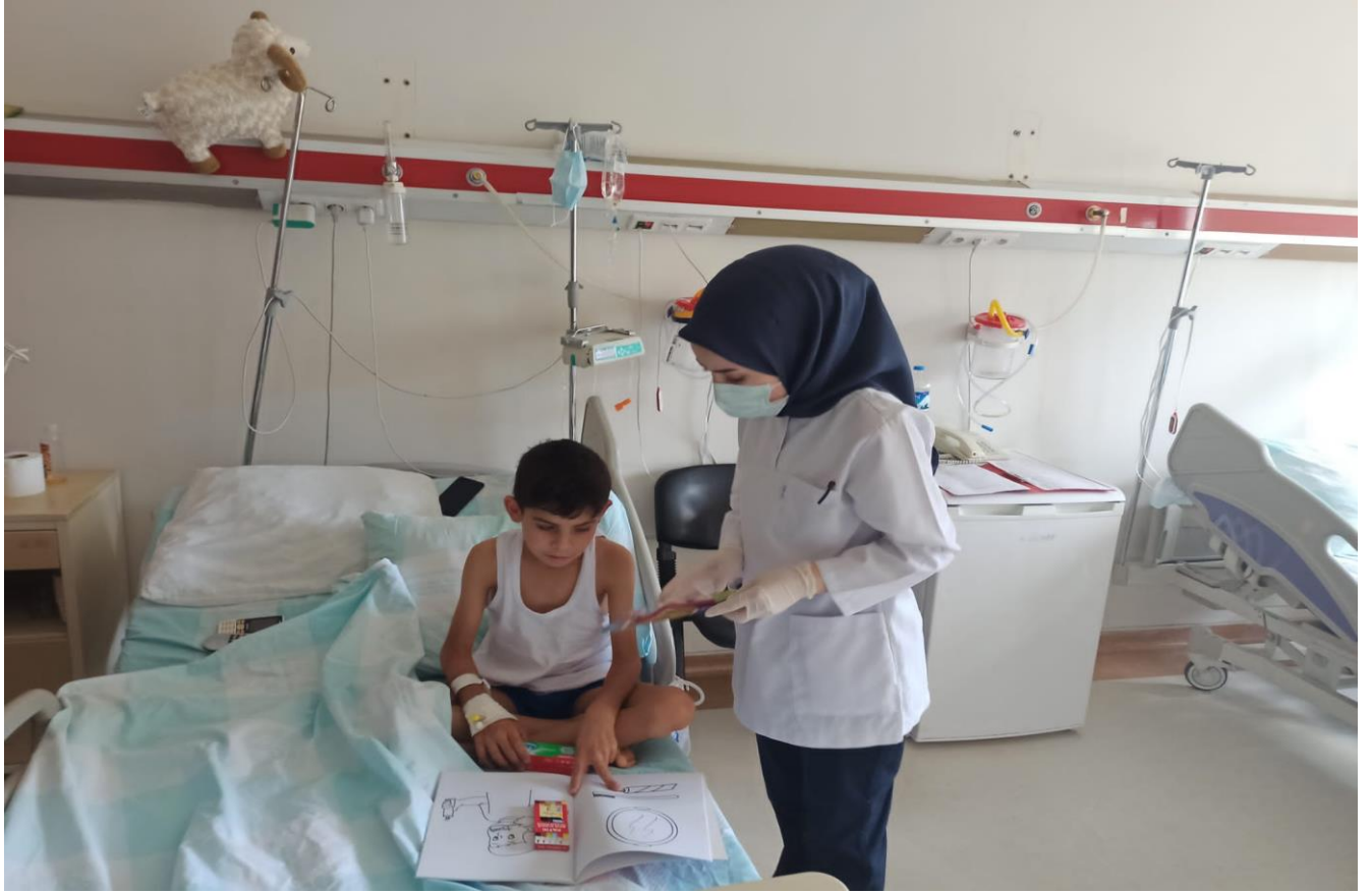
Projenin uygulandıđı ortam