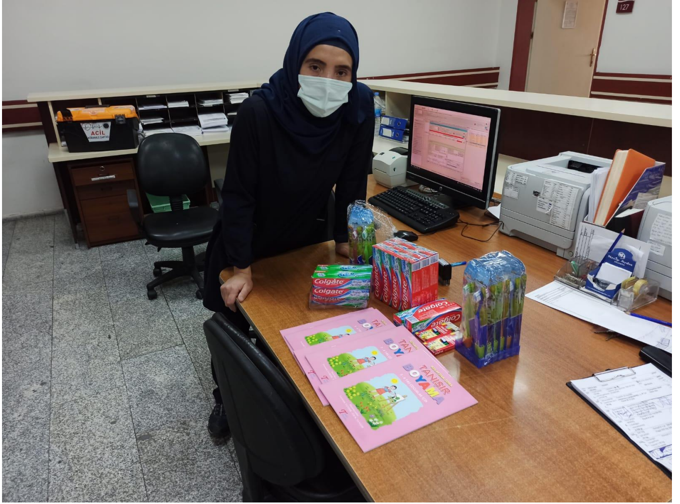
Proje materyallerinin teslim alınması