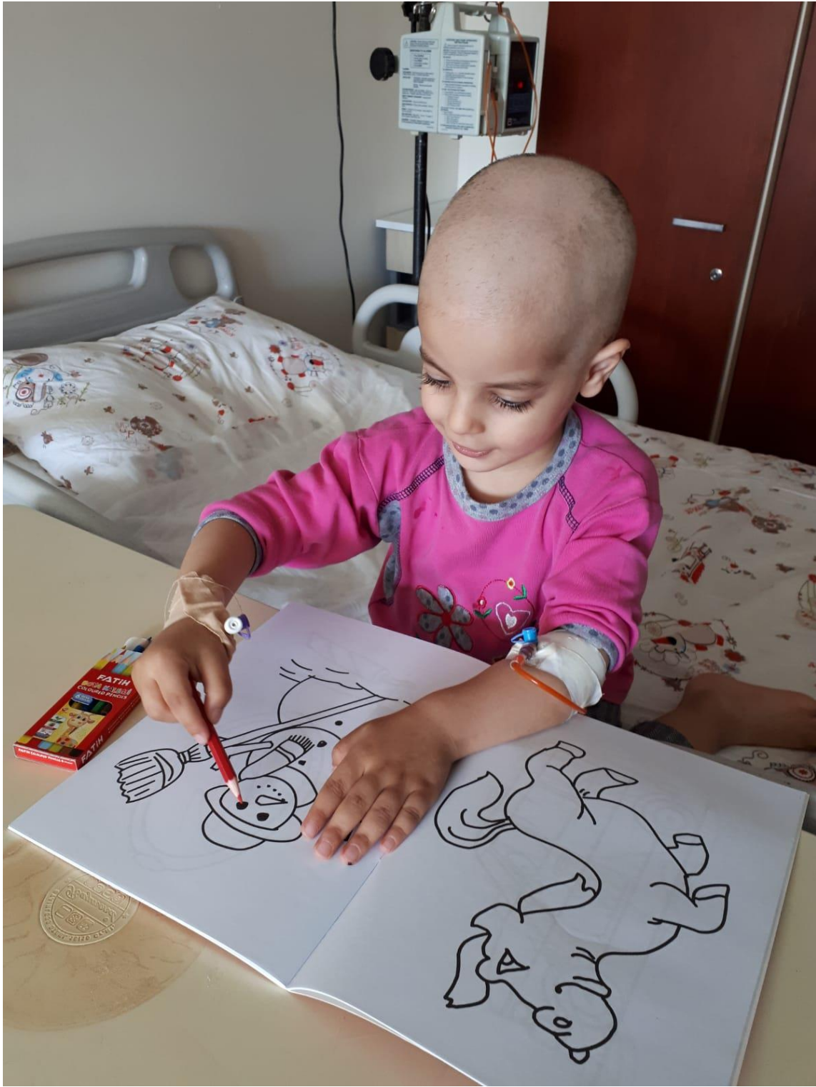
Projenin uygulandığı ortam