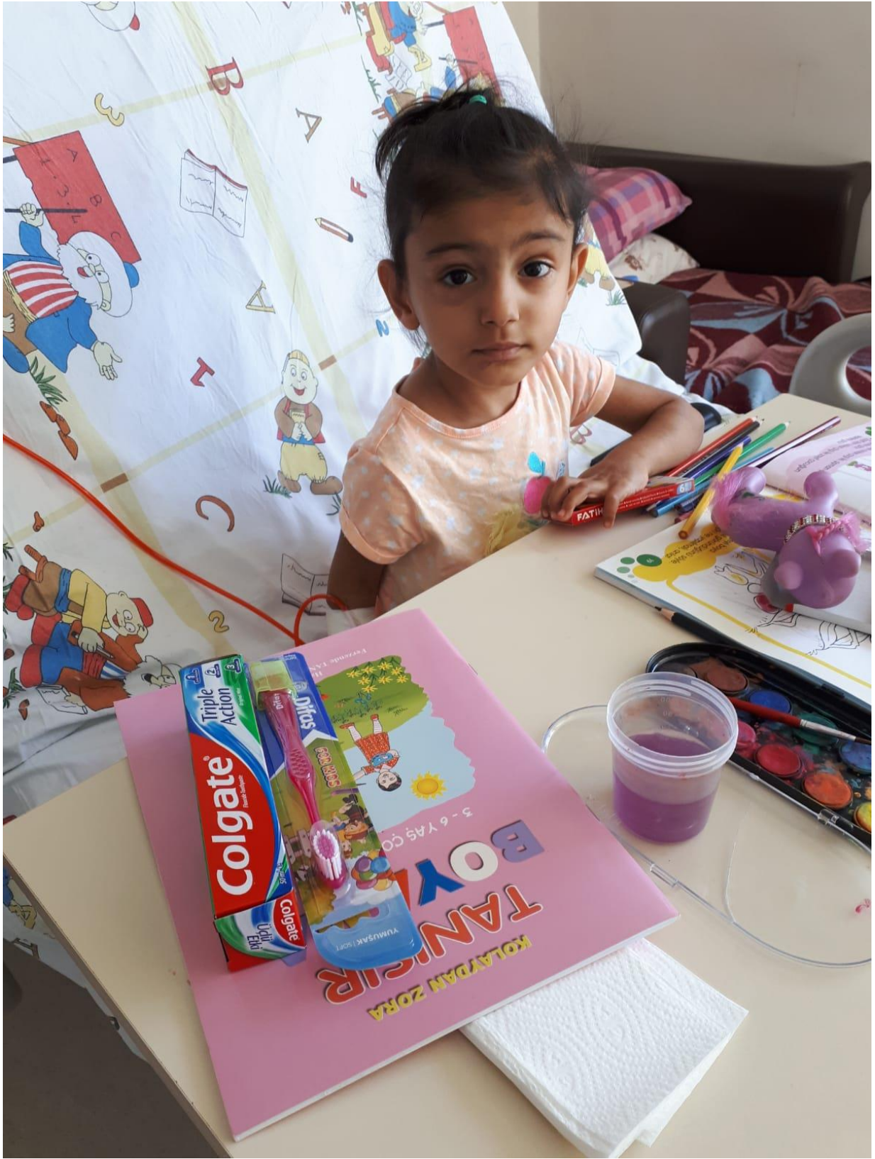
Projenin uygulandığı ortam