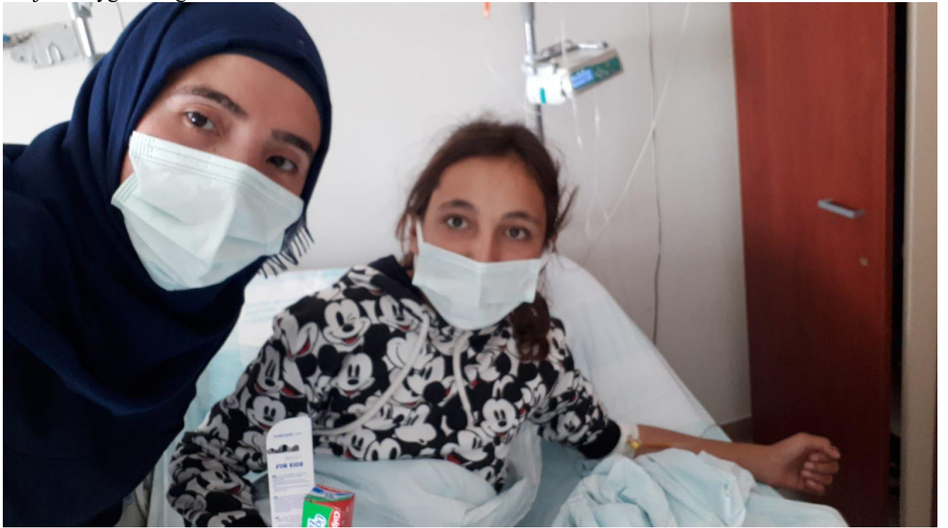
Projenin uygulandıđı ortam