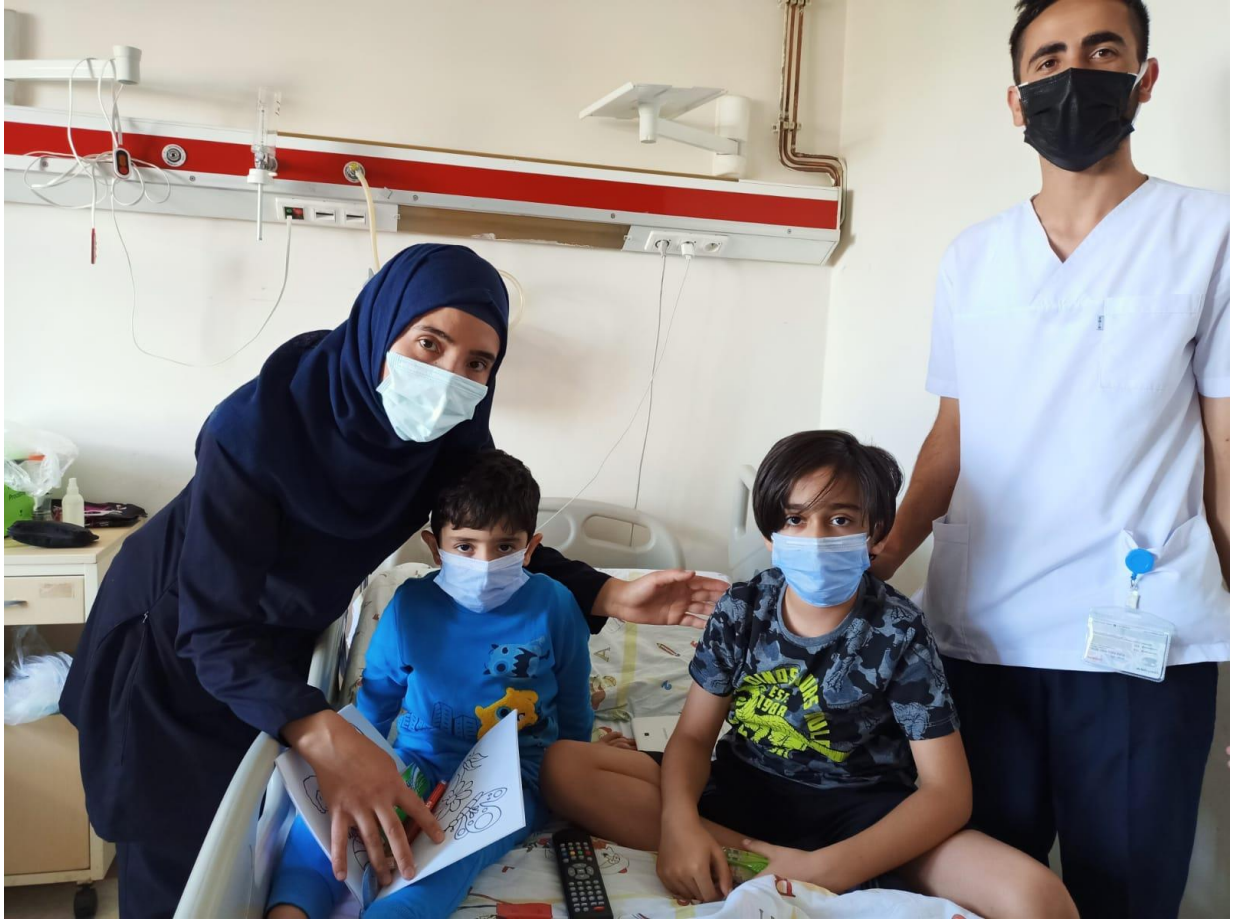
Projenin uygulandıđı ortam