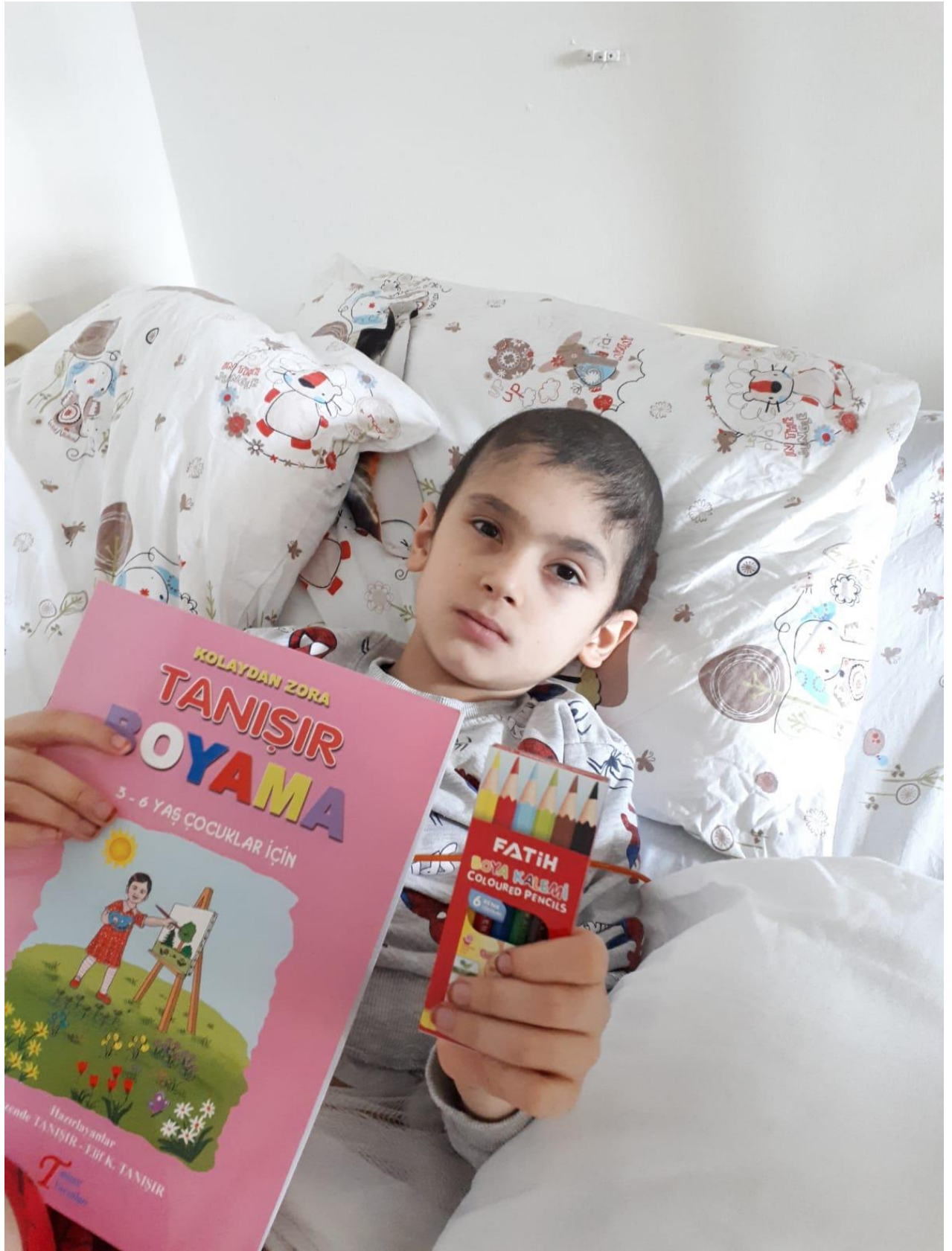
Projenin uygulandıđı ortam