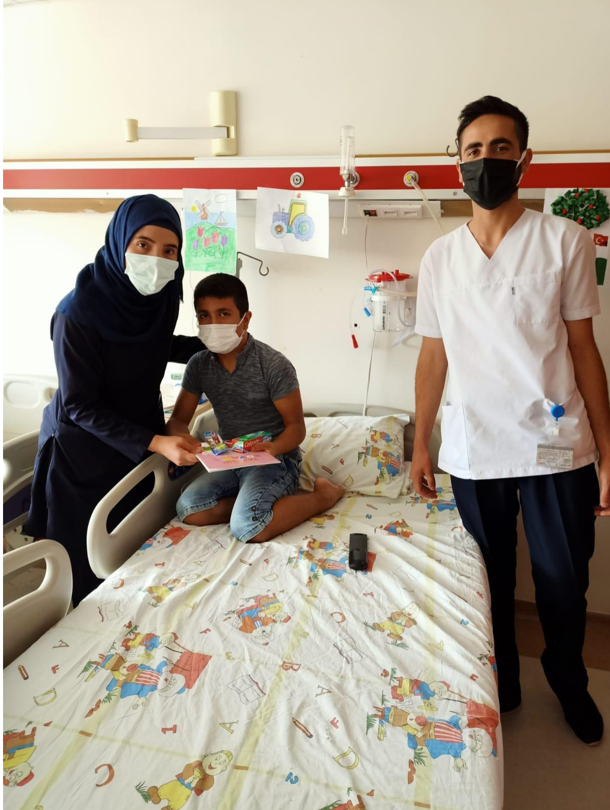
Projenin uygulandığı ortam