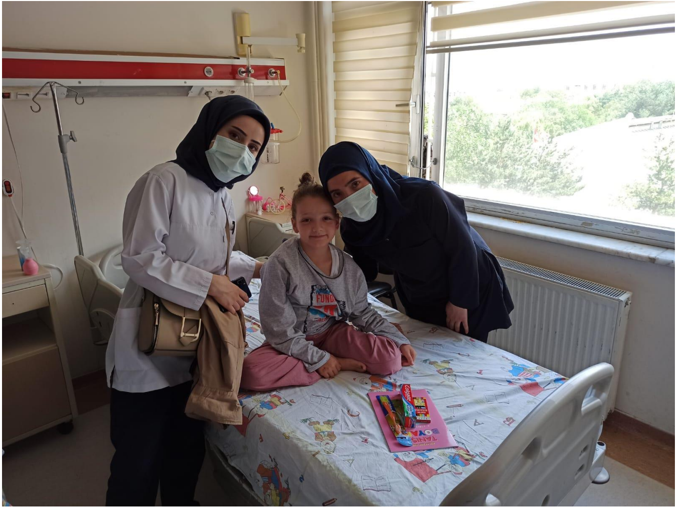
Projenin uygulandıđı ortam