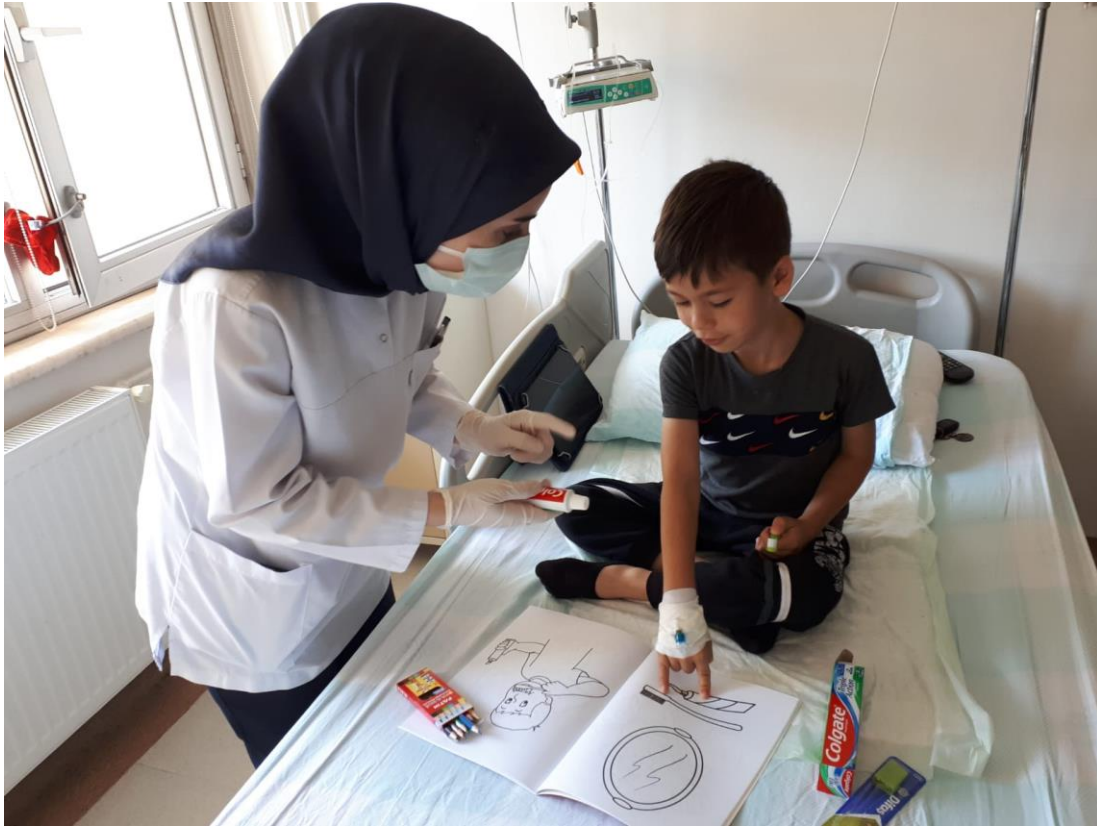
Projenin uygulandığı ortam