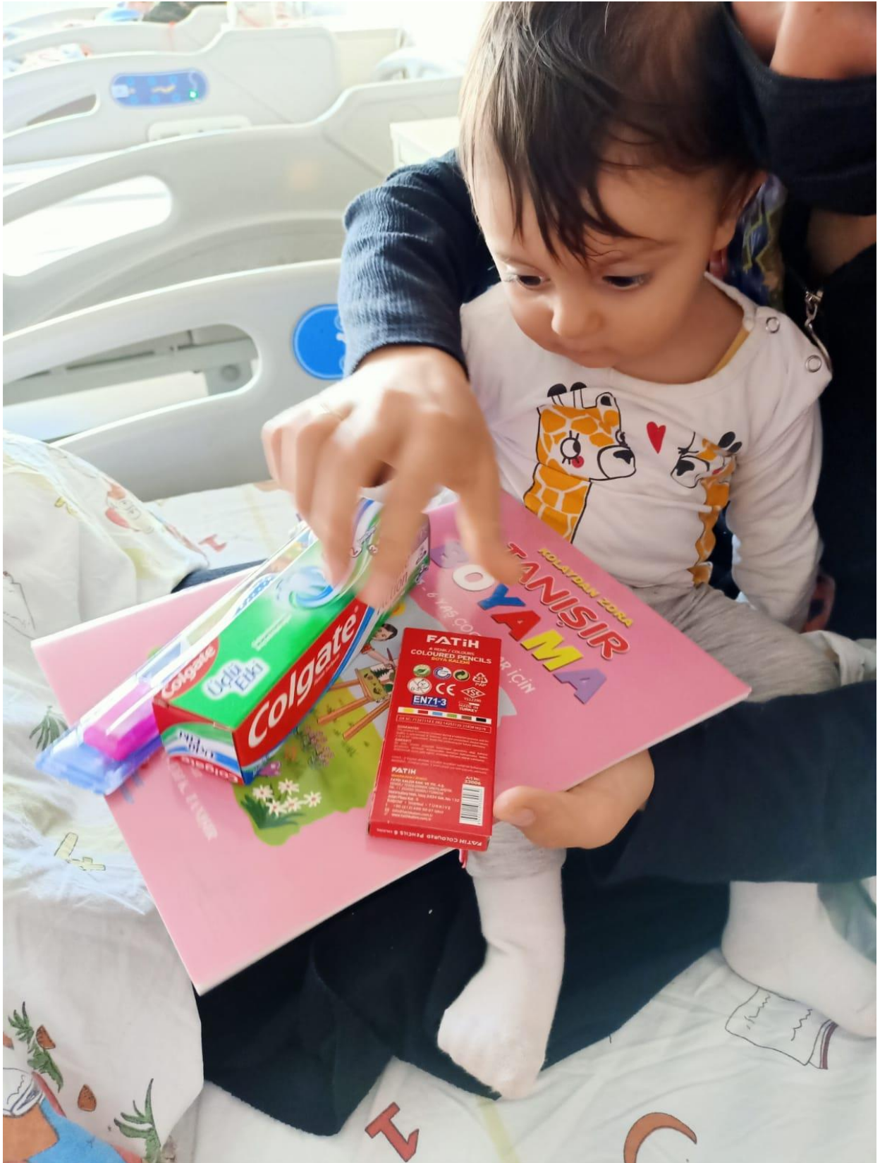
Projenin uygulandıđı ortam