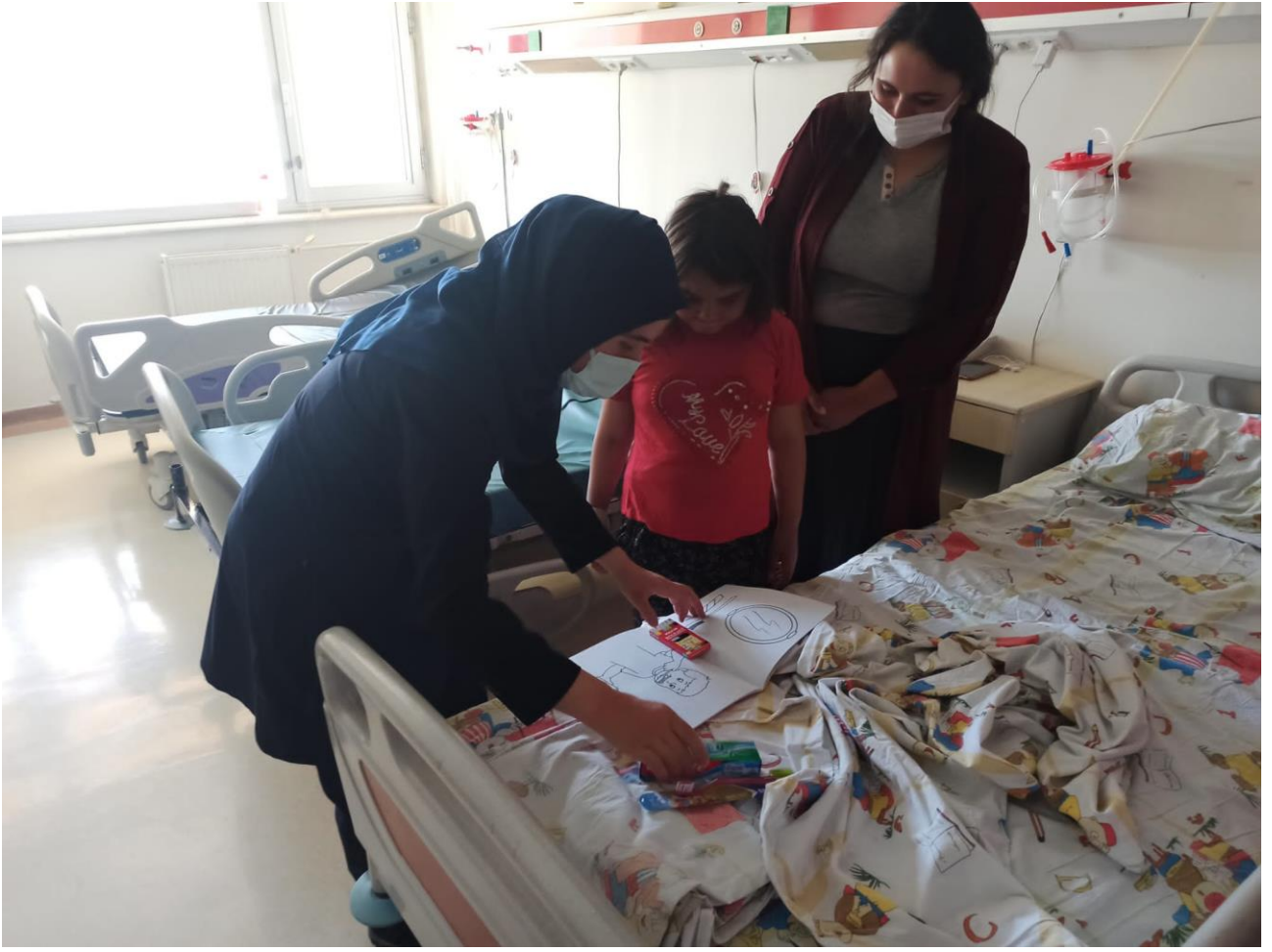
Projenin uygulandığı ortam