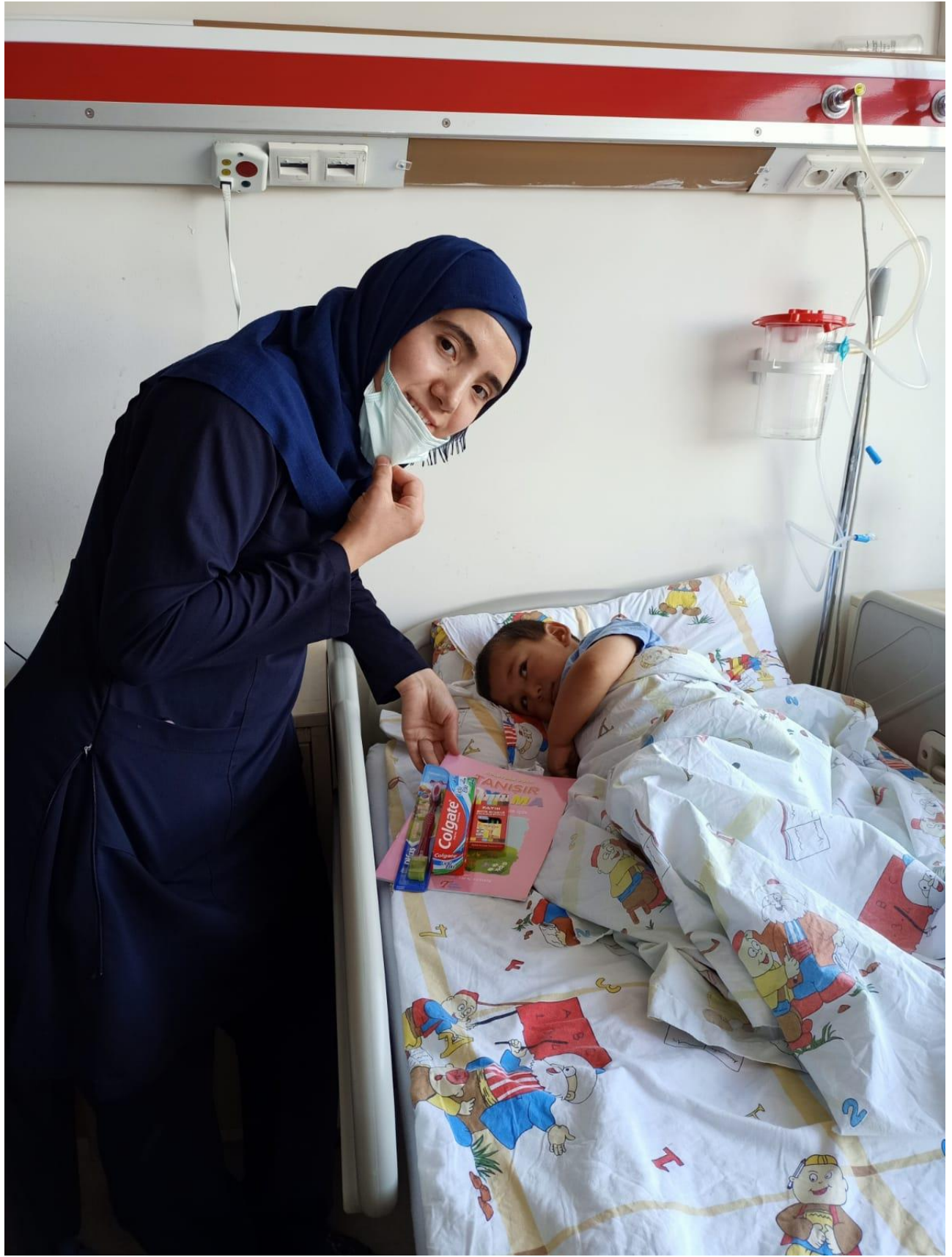
Projenin uygulandıđı ortam