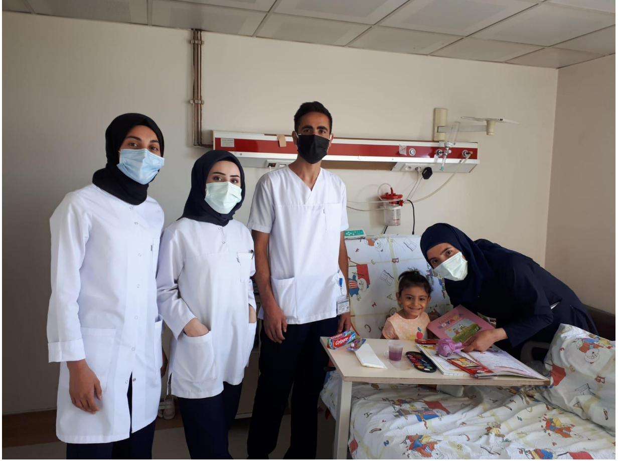
Projenin uygulandıđı ortam