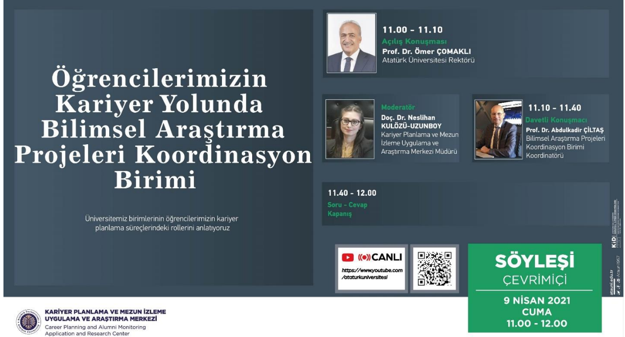
Şekil 1. Öğrencilerimizin Kariyer Yolunda Bilimsel Araştırma Projeleri Koordinasyon Birimi Afişi.