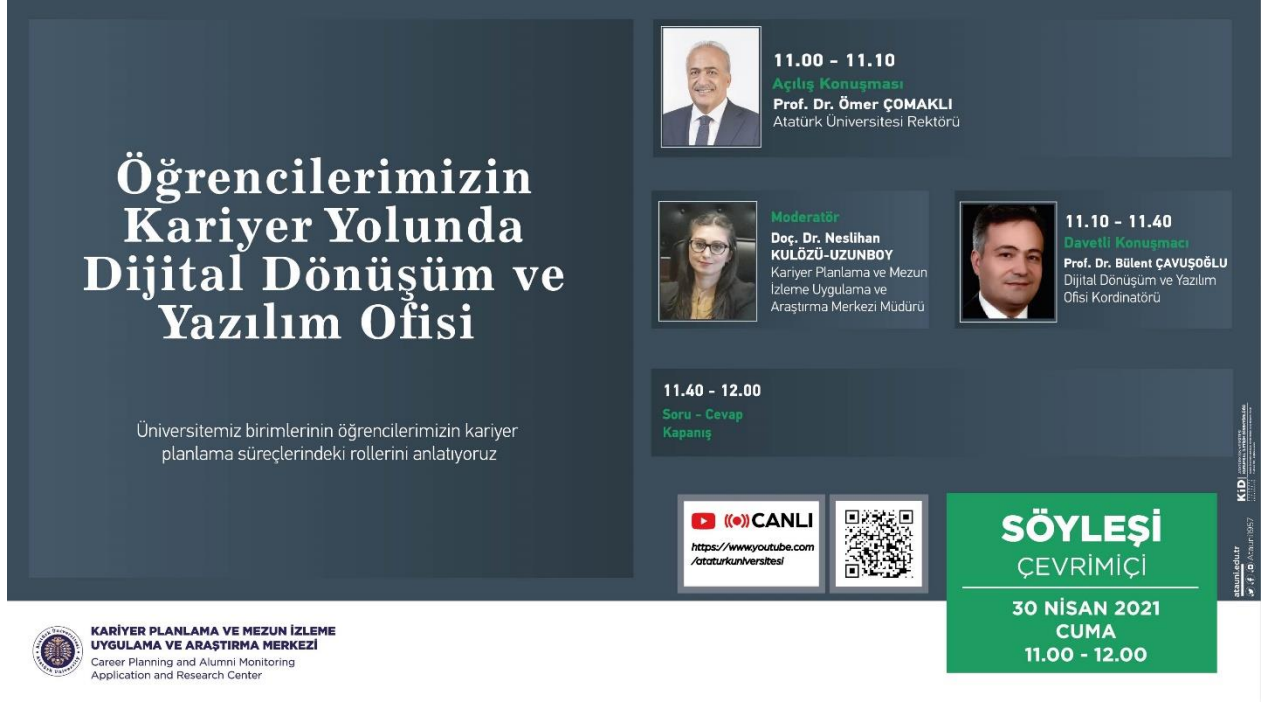
Şekil 1. Öğrencilerimizin Kariyer Yolunda Dijital Dönüşüm ve Yazılım Ofisi Afifi.