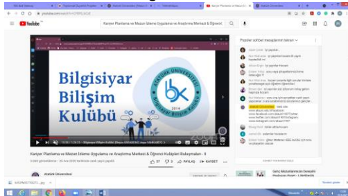
Şekil 3. Atatürk Üniversitesi Bilişim Sistemleri Kulüplerinin Öğrencilere Tanıtımı Etkinliğinden bir görüntü.