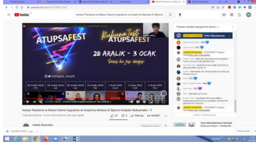
Şekil 6. Atatürk Üniversitesi Bilişim Sistemleri Kulüplerinin Öğrencilere Tanıtımı Etkinliğinden bir görüntü.