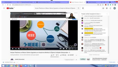
Şekil 4. Atatürk Üniversitesi Bilişim Sistemleri Kulüplerinin Öğrencilere Tanıtımı Etkinliğinden bir görüntü.