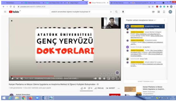
Şekil 3. Atatürk Üniversitesi Tıp ve Hukuk Fakültesi Öğrenci Kulüplerinin Tanıtımı Etkinliğinden bir görüntü.