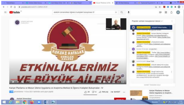
Şekil 4. Atatürk Üniversitesi Tıp ve Hukuk Fakültesi Öğrenci Kulüplerinin Tanıtımı Etkinliğinden bir görüntü.