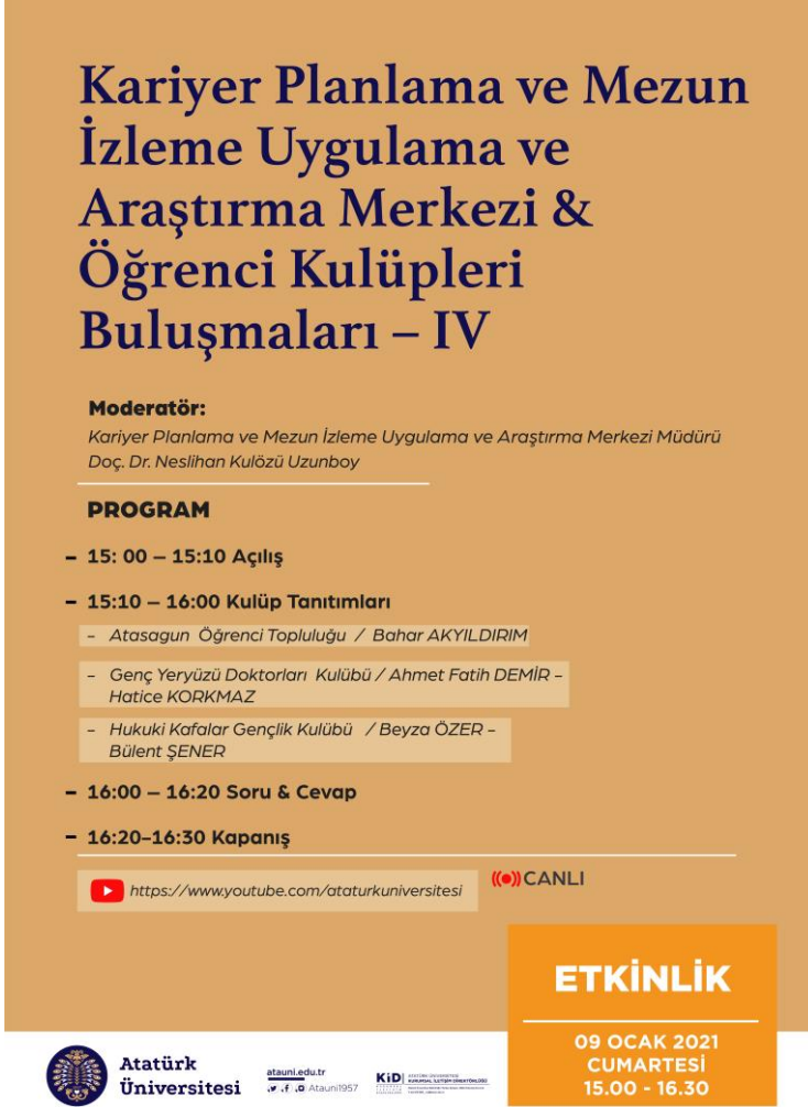
Şekil 1. Atatürk Üniversitesi Tıp ve Hukuk Fakültesi Öğrenci Kulüplerinin Tanıtımı Afifi.