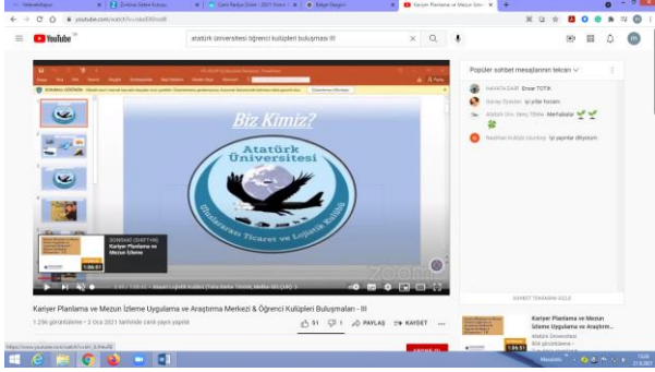
Şekil 2. Atatürk Üniversitesi Transplantasyon, Lojistik ve Çevre Konulu Kulüplerinin Öğrencilere Tanıtımı Etkinliğinden bir görüntü.