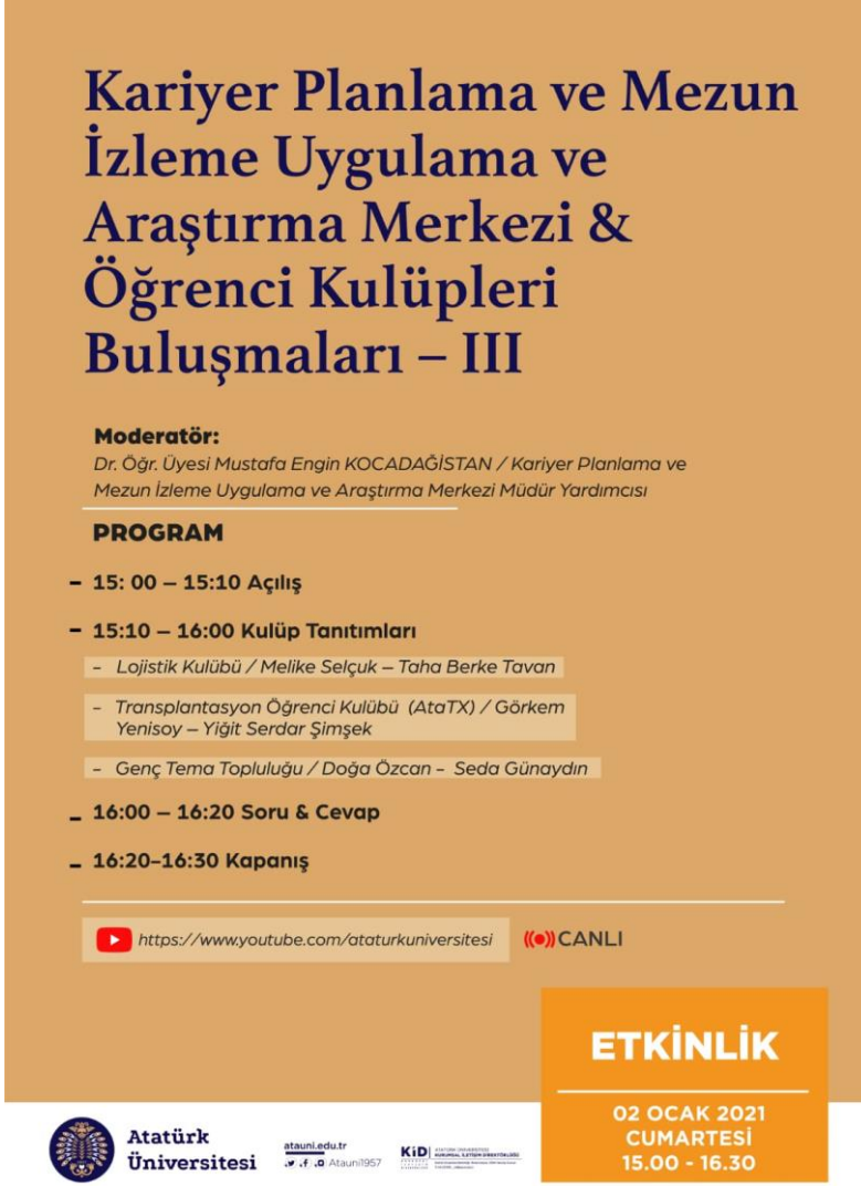
Şekil 1. Atatürk Üniversitesi Transplantasyon, Lojistik ve Çevre Konulu Kulüplerinin Öğrencilere Tanıtım Afifi.