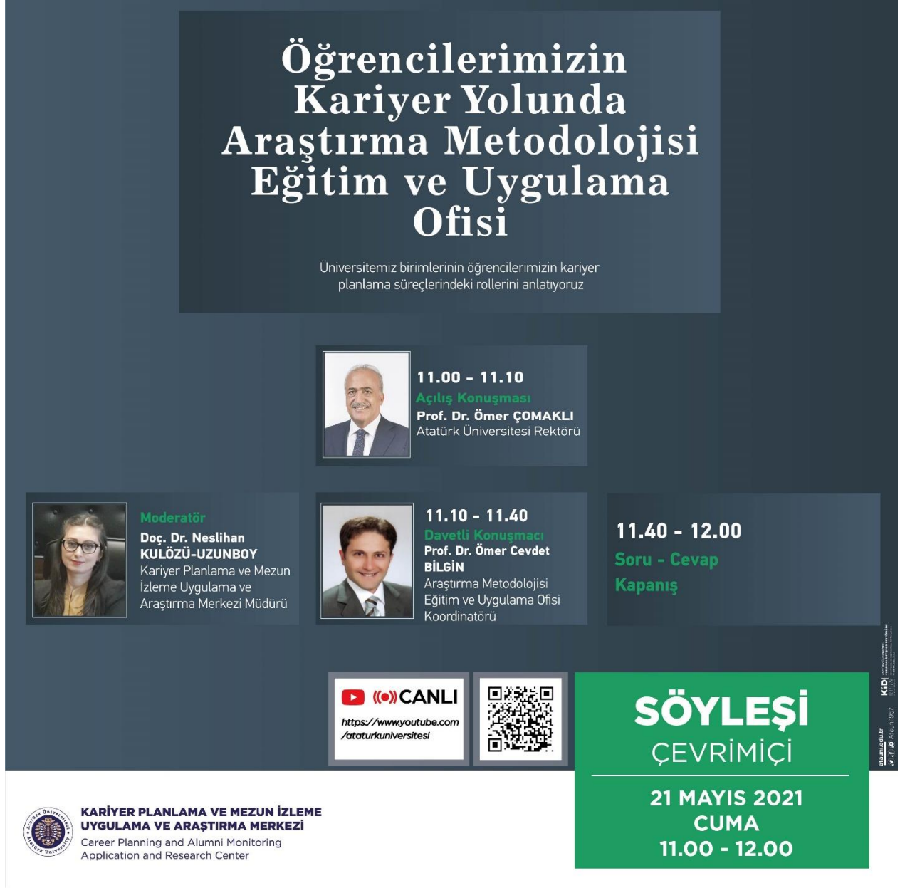
Şekil 1. Öğrencilerimizin Kariyer Yolunda Araştırma Metodolojisi Eğitim ve Uygulama Ofisi Afişi.