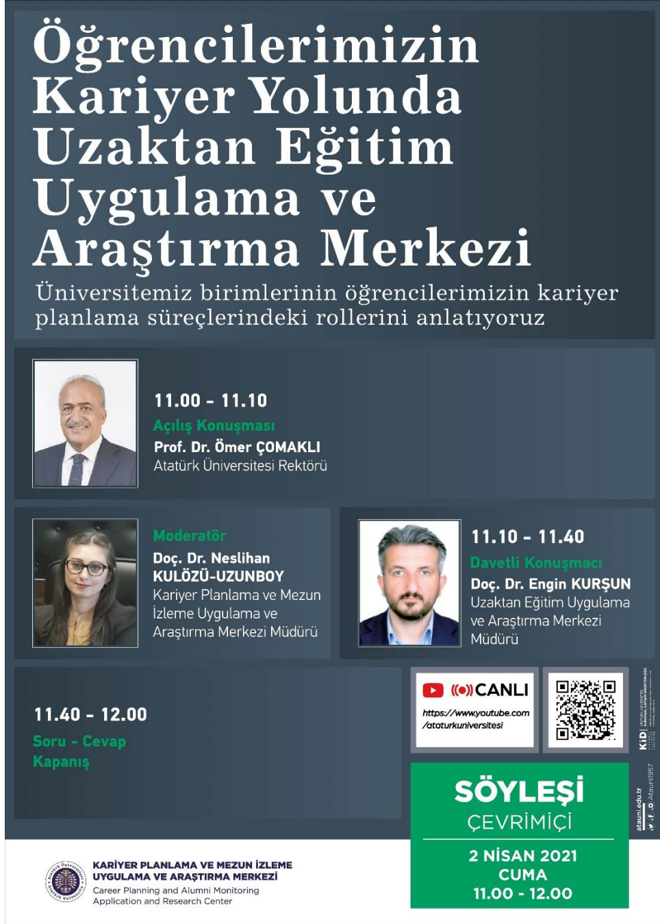
Şekil 1. Öğrencilerimizin Kariyer Yolunda Uzaktan Eğitim Uygulama ve Araştırma Merkezi Afifi.