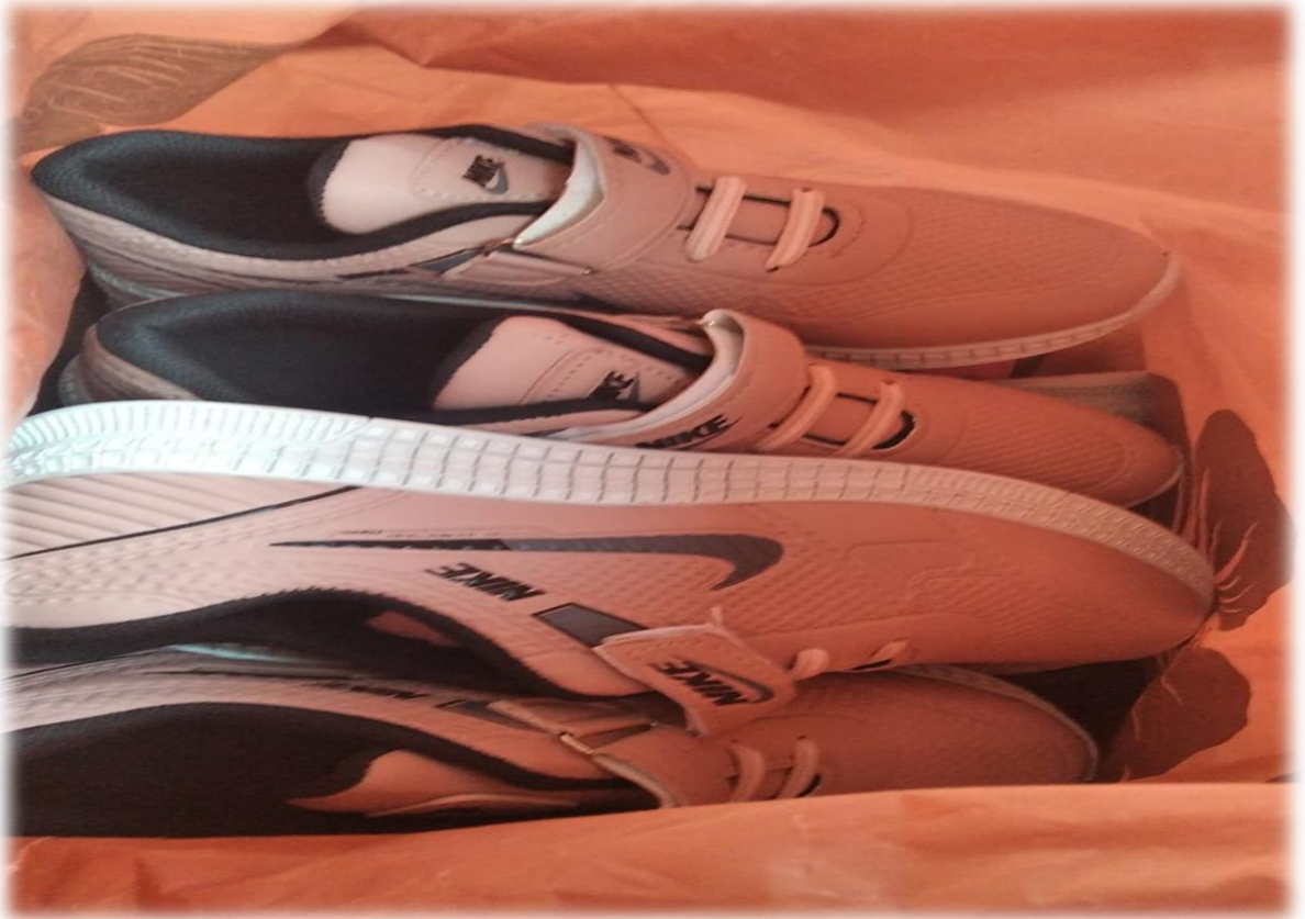
Elden alınan proje materyallerinin teslim alınması