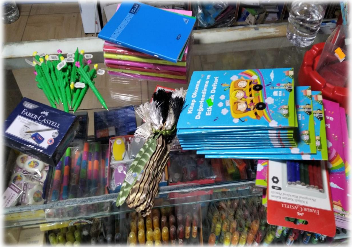
Elden alınan proje materyallerinin teslim alınması