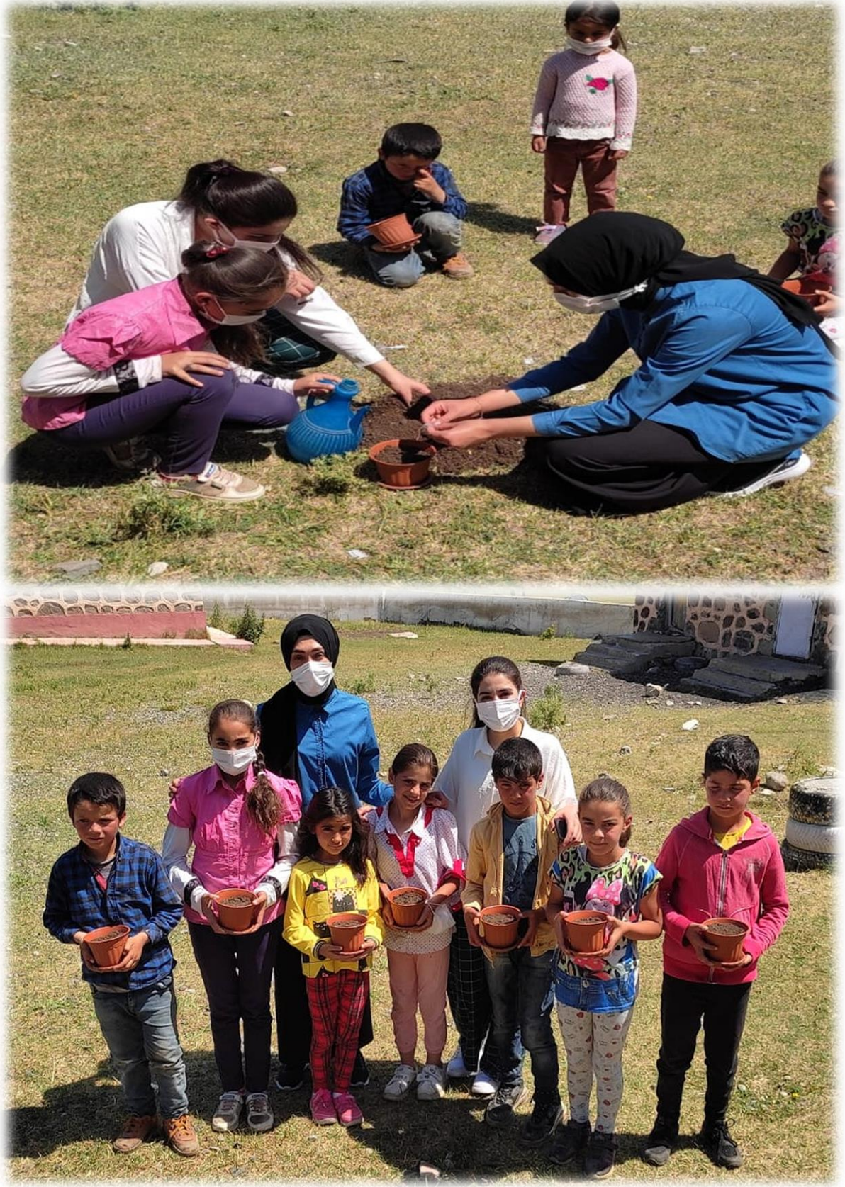
Tohum ekme etkinliđinden sonra ekilen tohumların öđrencilere hediye edilmesi