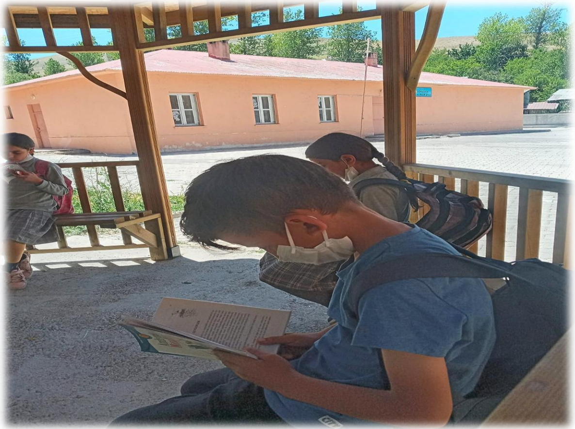
Açık havada gerçekleştirilen kitap okuma etkinliğinden sonra öğrencilere hediyelerinin takdim edilmesi