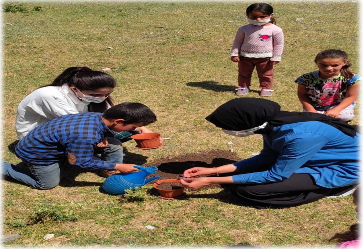
Yapılan uygulamadan sonra tohum ekme etkinliĐinin gerekleřtirilmesi