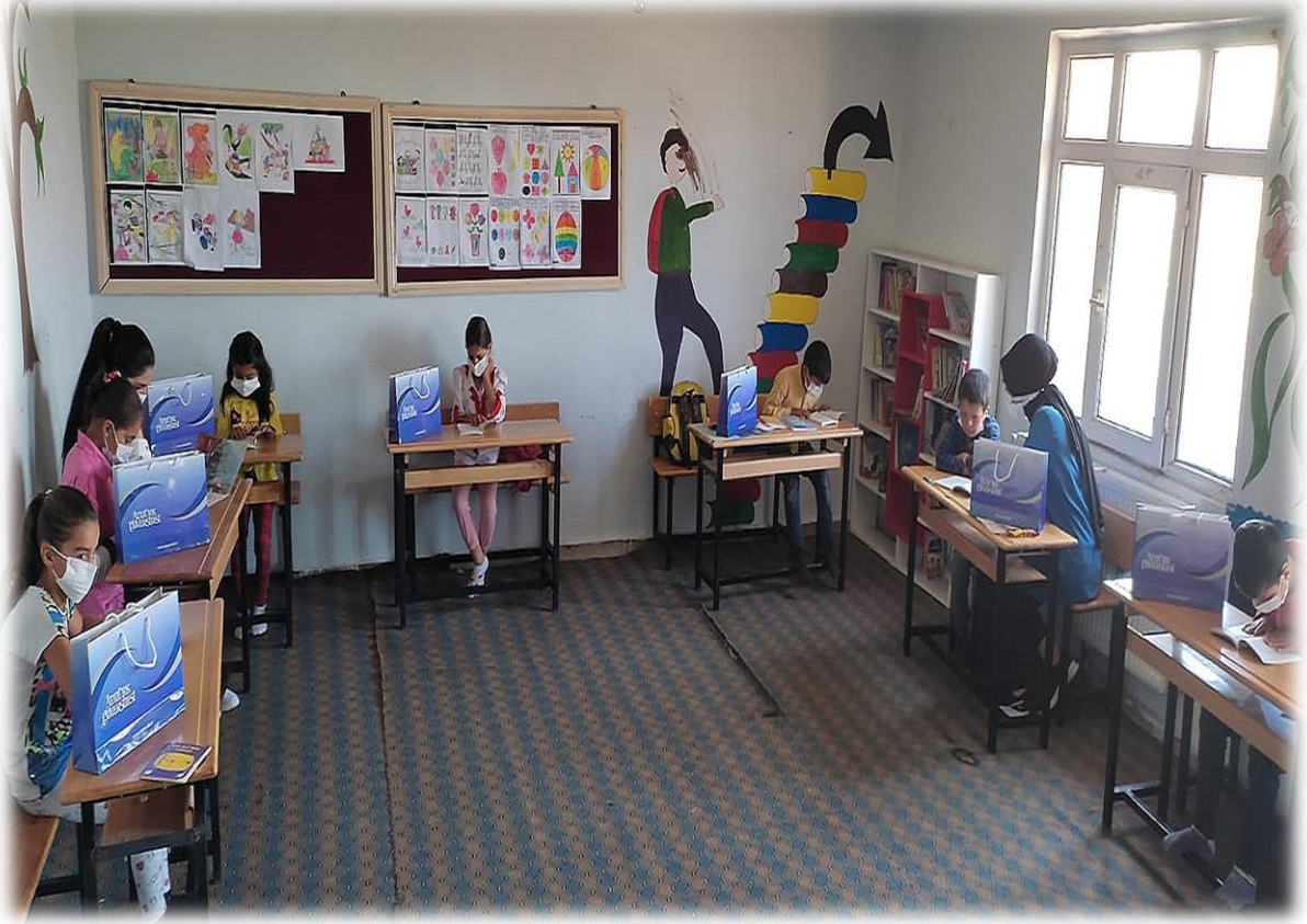
Ortayokuş İlkokulu'nda proje kapsamında olan öğrencilere okuma kitaplarının, özet defterlerinin ve hediyelerinin takdim edilmesi