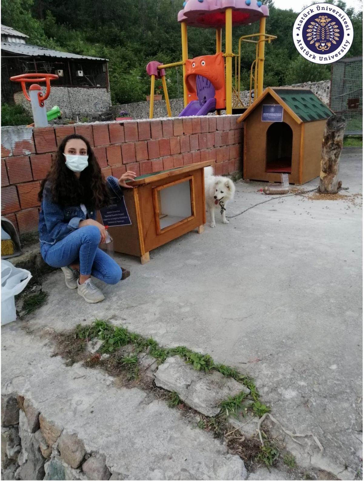
Proje kapsamında hazırlanan kedi, köpek mamalarının ve barınakların hayvanların rahat ulaşabilecekleri parka bırakılması