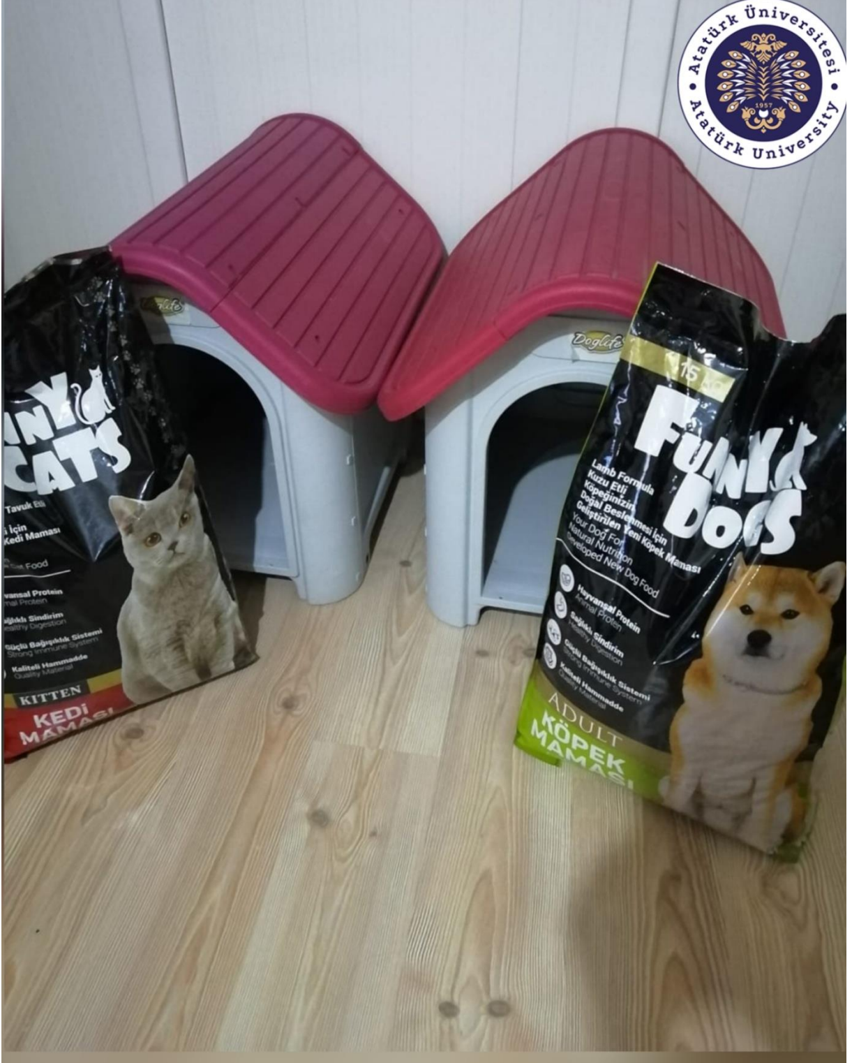
Proje kapsamında temin edilen kedi, köpek mamaları ve barınaklar