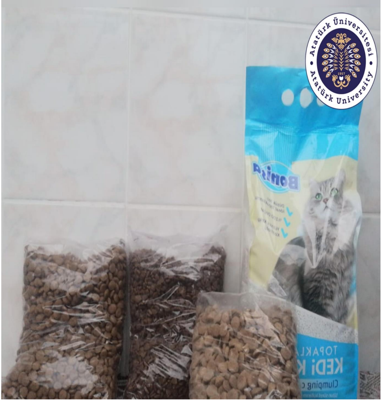
Proje kapsamında temin edilen kedi ve köpek mamaları