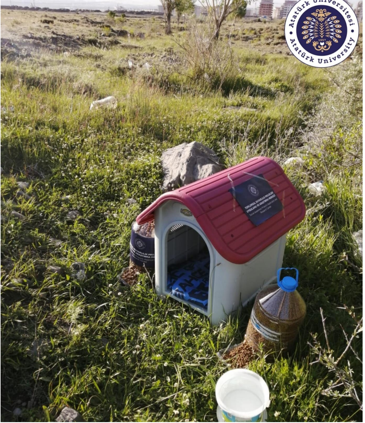
Projenin uygulandığı ortam