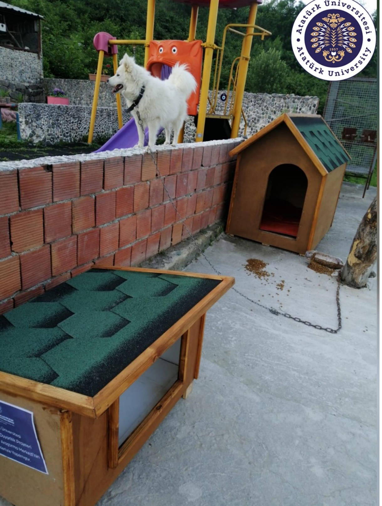
Projenin uygulandıđı ortam