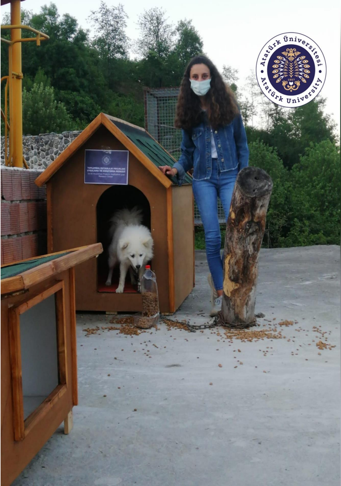
Proje kapsamında yaptırılan ısı yalıtımlı kedi ve köpek barınakları