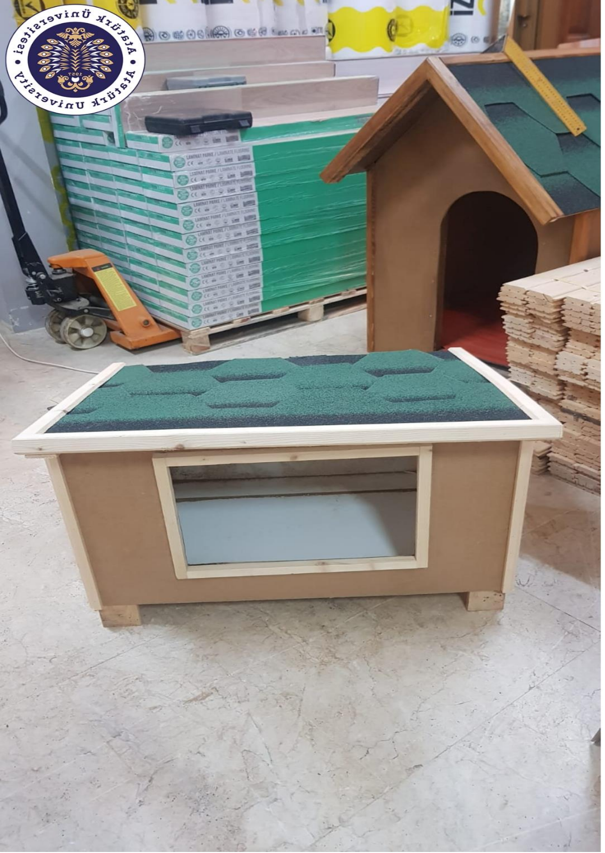
Proje kapsamında temin edilen kedi ve köpek kulübeleri