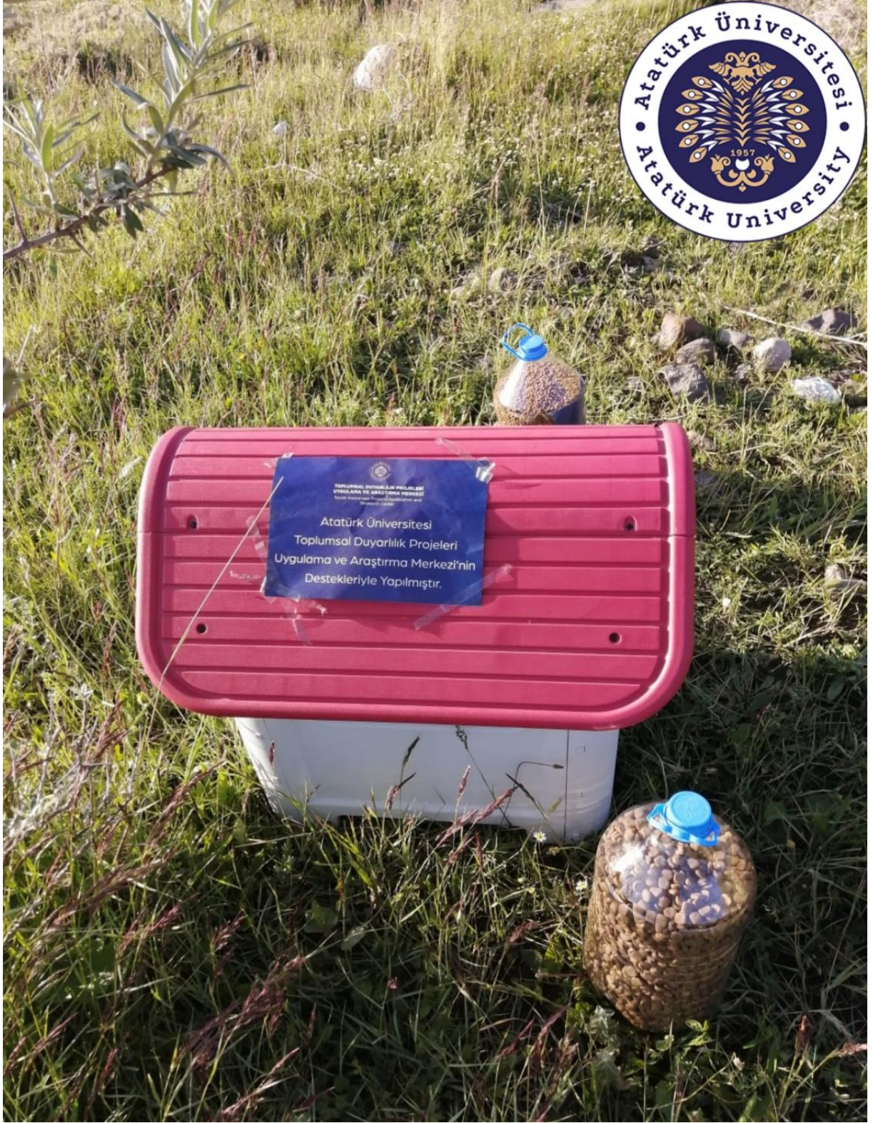
Projenin uygulandığı ortam