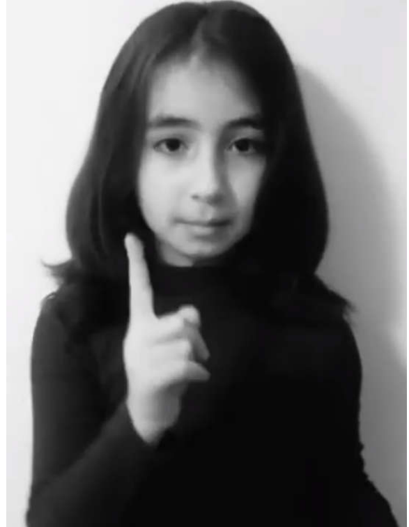
Şekil 2. Klipten Görüntüler