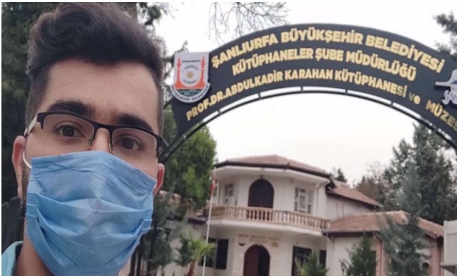
Şekil 4. Kitap Toplama Kampanyasından Görüntüler