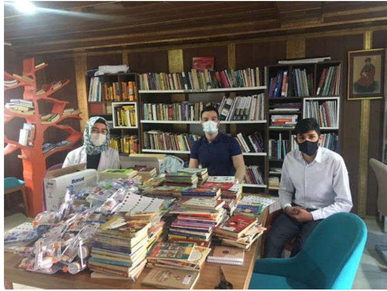
Şekil 3. Kitap Toplama Kampanyasından Görüntüler