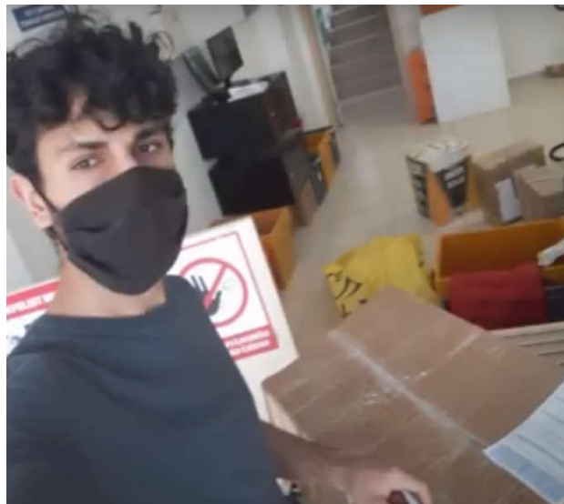
Şekil 2. Kitap Toplama Kampanyasından Görüntüler