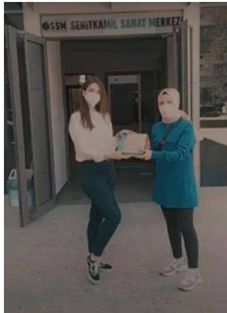
Şekil 5. Kitap Toplama Kampanyasından Görüntüler