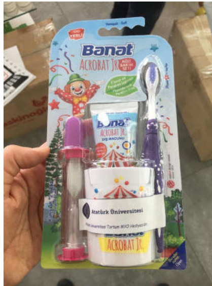
Şekil 5. Okula Hediye Edilen Diş Bakım Setleri