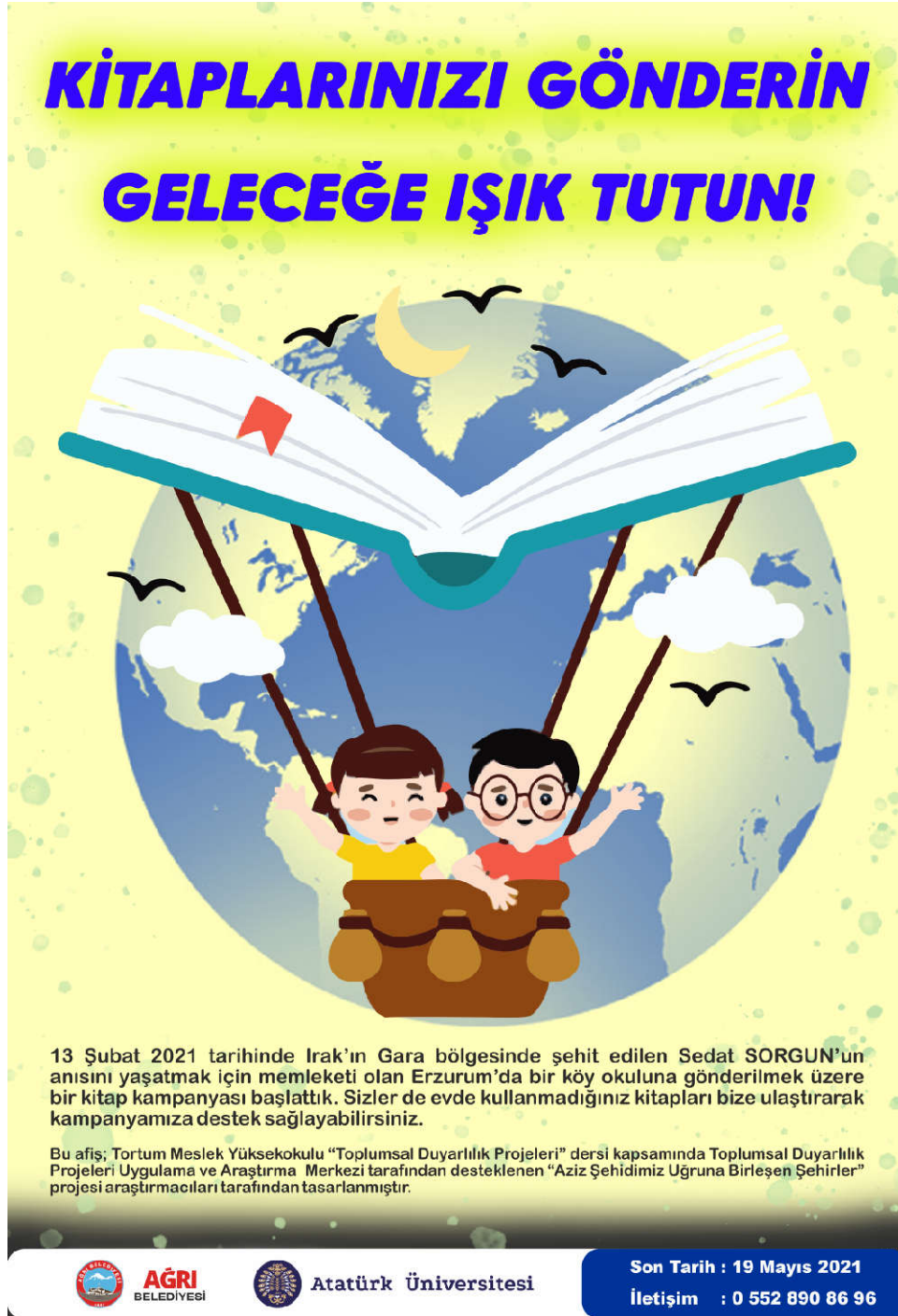
Şekil 1. Proje afişi