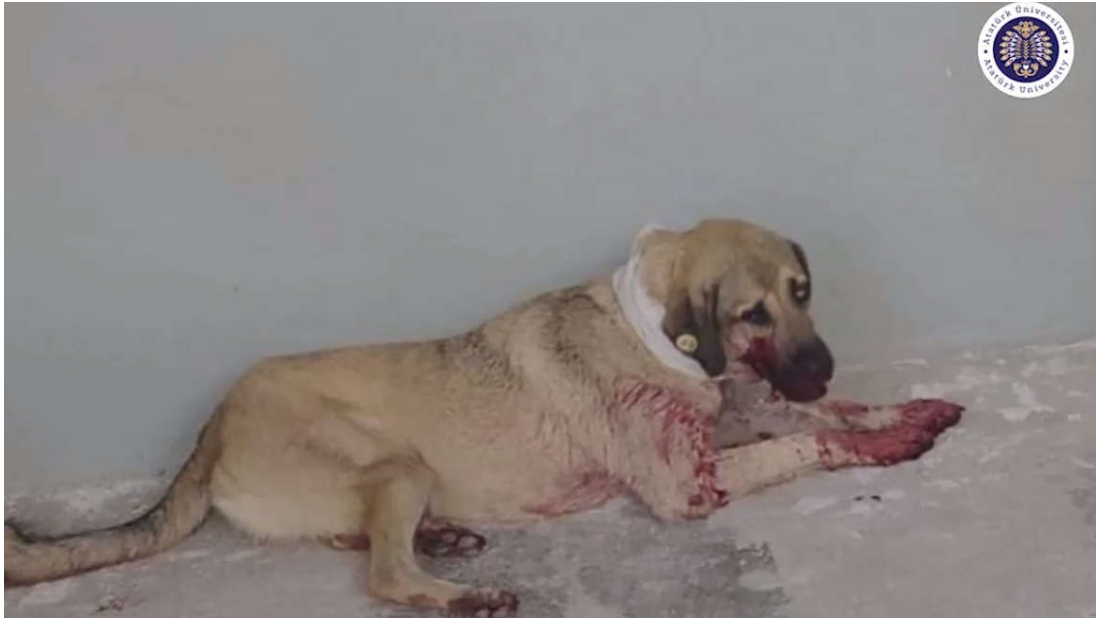
Şekil 2. Farkındalık videosundan görüntüler