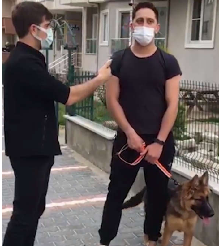
Şekil 3. Röportajlardan kareler