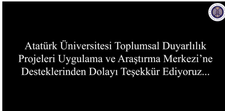
Şekil 4. Videolarda kullanılan TDM'ye teşekkür yazısı