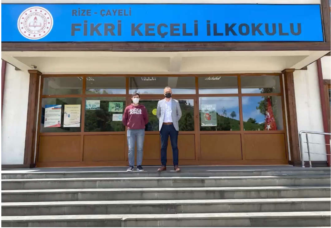
Şekil 4. Okul Müdürüyle Bir Kare