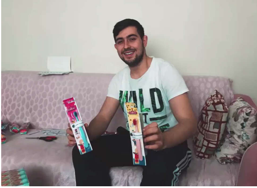
Şekil 2. Diş Bakım Setlerine Logoların Yapıştırılması