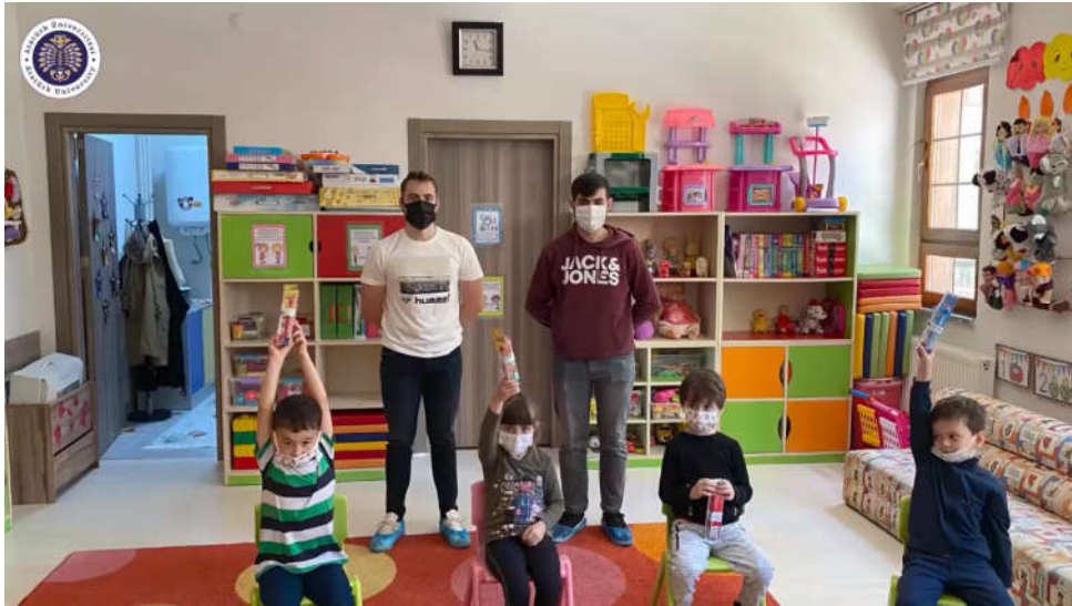
Şekil 4. Diş Bakım Setleri Dağıtılırken