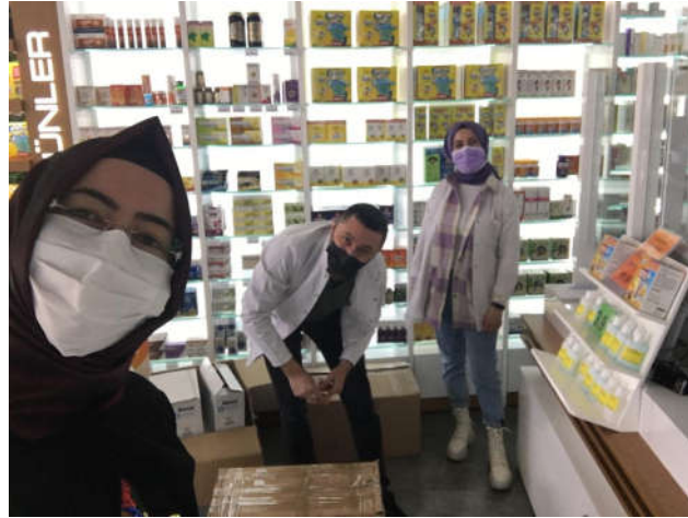
Şekil 1. Diş Bakım Setlerinin Satın Alınması