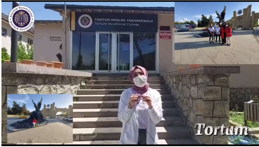
Şekil 1. Röportaj Görüntüleri