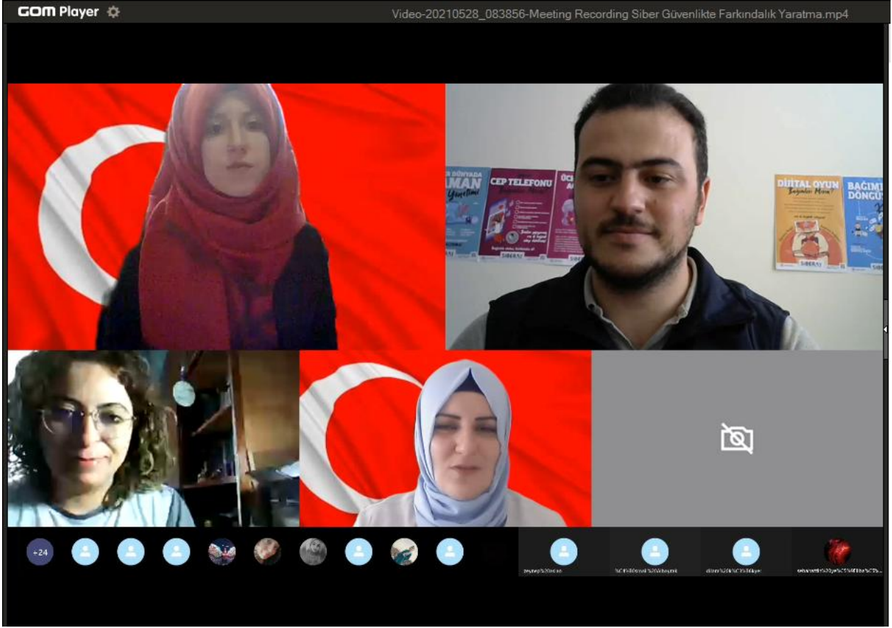
Projenin Sunumunu Gerçekleştiren Komiserimiz.