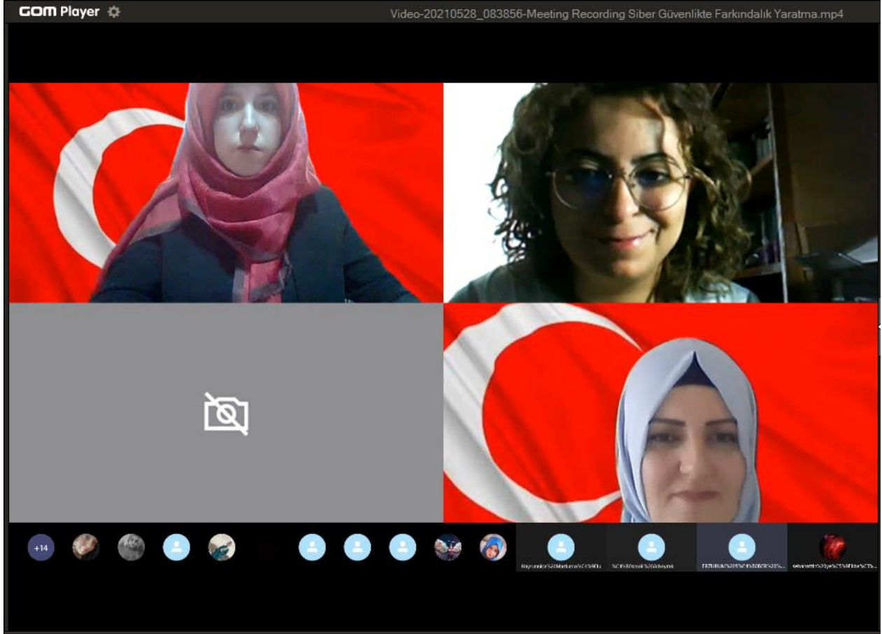
Proje Ekip Üyelerinden bir görüntü